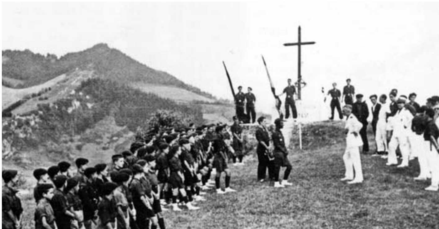
Umeak frankismoan hezteko Orion zegoen udako kanpamendu bat.