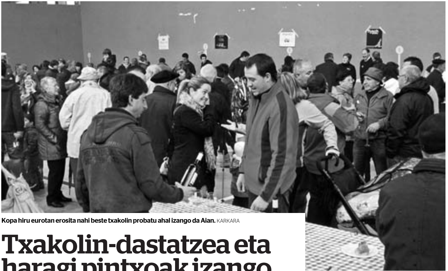
Kopa hiru eurotan erosita nahi beste txakolin probatu ahal izango da Aian. KARKARA