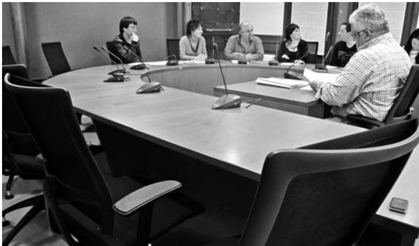
EAJko zinegotzien aulkiak hutsik geratu ziren martxoaren 7ko udalbatzarrean. KARKARA