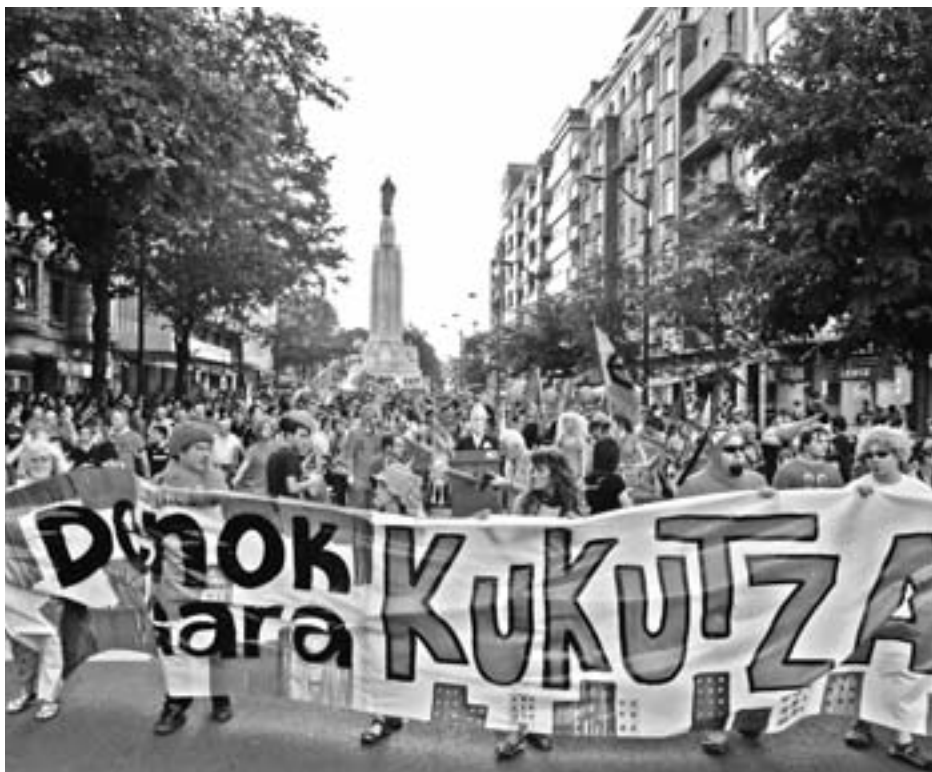
Kukutza kasuan auzipetu izan direnen alde manifestazio asko egin dira. Irudian Bilboko bat.