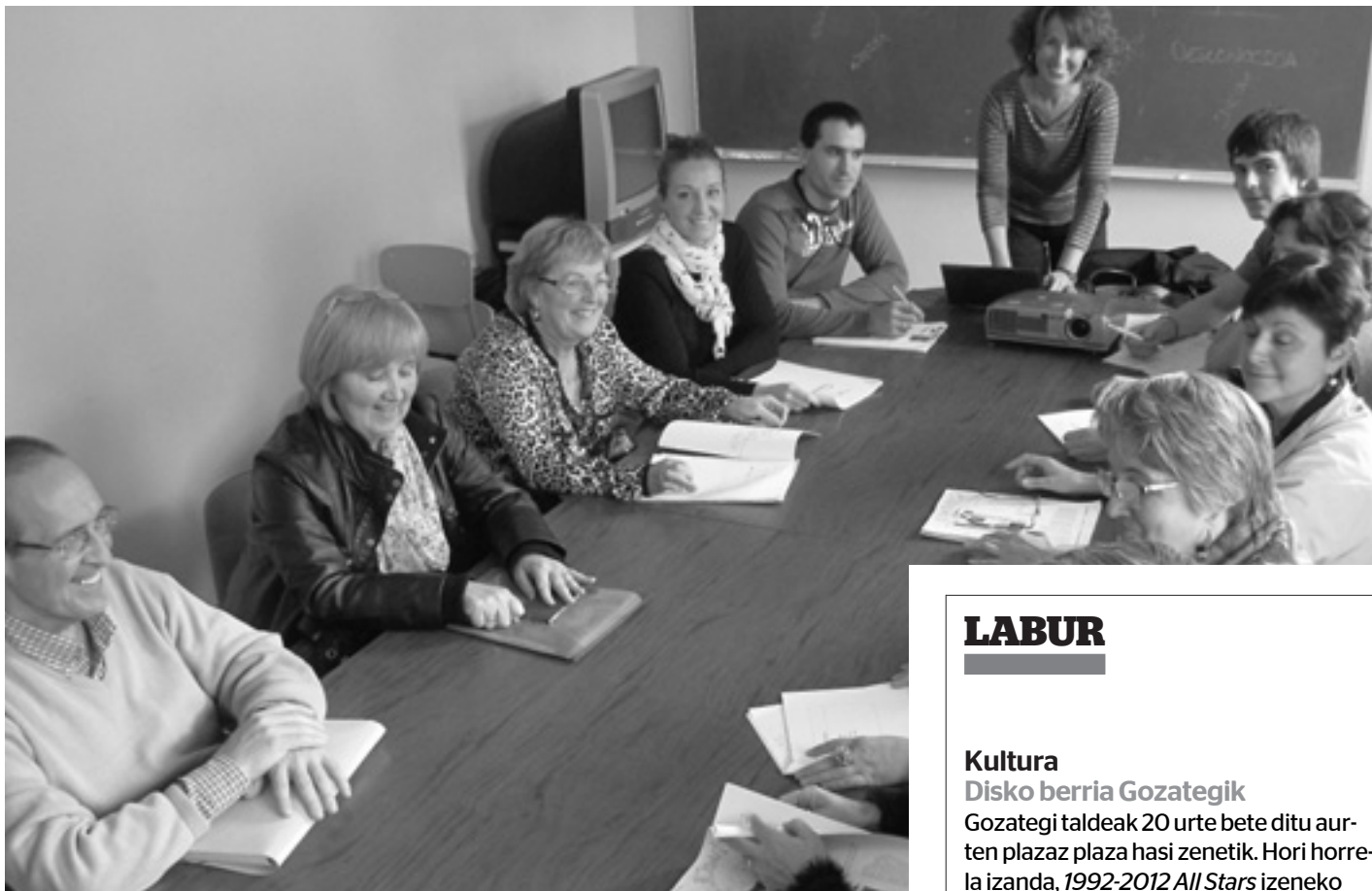
Hamabost inguru lagun bildu dira bazkalondoetan Kultur Etxean ikastaroak egiteko. KARKARA