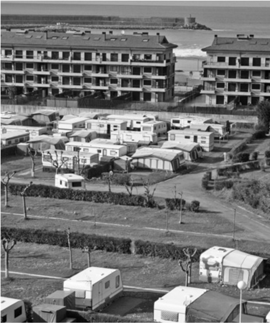
Kanpinean jarriko dituzten bungalowen tarifak 60 eta 120 euro artekoak izango dira. KARKARA