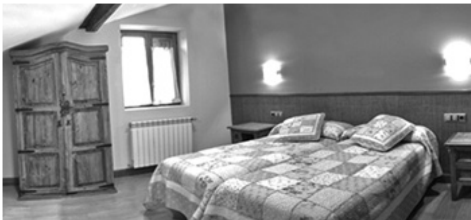
Altzibar Berrin 7 logela dituzte, irudian horietako bat. ALTZIBAR BERRI LANDETXEA