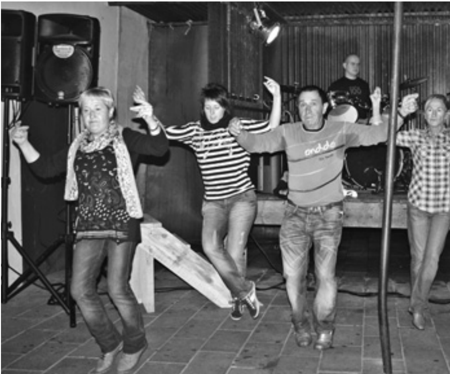
Soltean zein helduan aritzen dira dantzan Aristerrazuko erromerian jai egunetan. KARKARA