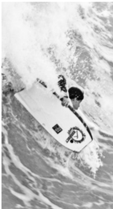
Olatu onak izan zituzten ostiralean. KARKARA

Bost kategoriatan banatuta jokatu dute aurtengo Orioko surf txapelketa. Azaroaren leian eta 2an egin zituzten txapelketako saio guztiak, itsasoaren egoera ona zela aprobeztatuz