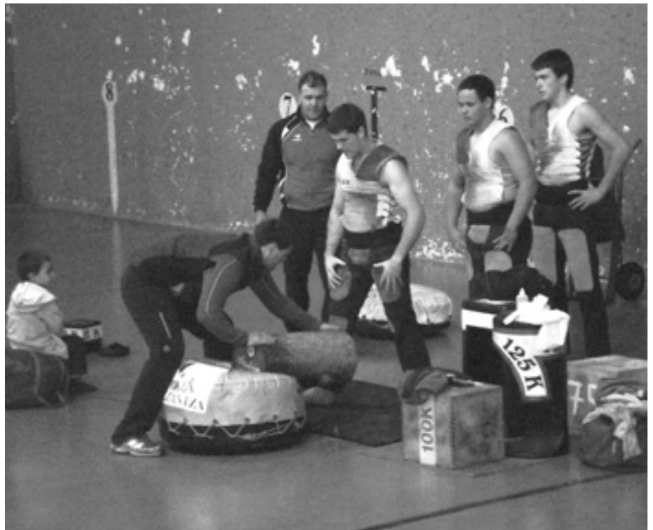
Herri kirolek dakarten jendetza ikusita, harrijasotzaileak izango dira aurten ere. MAIALEN MANZIDOR

Asteburu gutzia nahikoa ez, eta astelehenera arte indarrez irauten dutenak, azaroaren 12an, goizean goiz jaikita, baserriz baserri arituko dira oilaskoak bil-