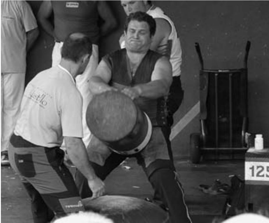
Herri kirol jaialdia izango da, besteak beste, San Migel egunean: argazkian, Ostolaza.