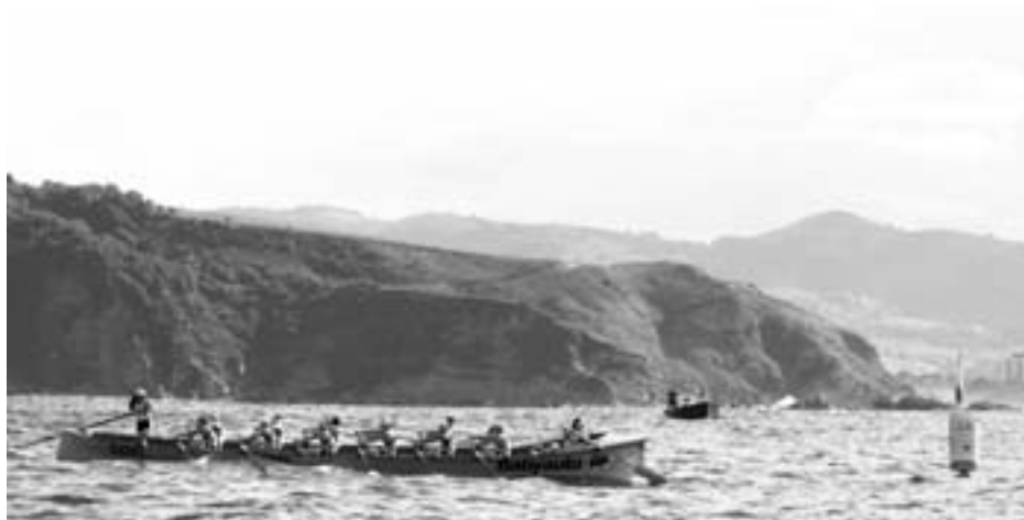
Orioko estropadako kanpoko balizan Orioko nesken trainerua. KARKARA

Lutxanan eta Hondarribian nagusitasunez irabazi zituzten estropadak San Nikolas ontziko mutilek. Dena dela, lehen ontziak zer egiten duenaren zain egon beharko dute KAE-1 ligan ziur izateko