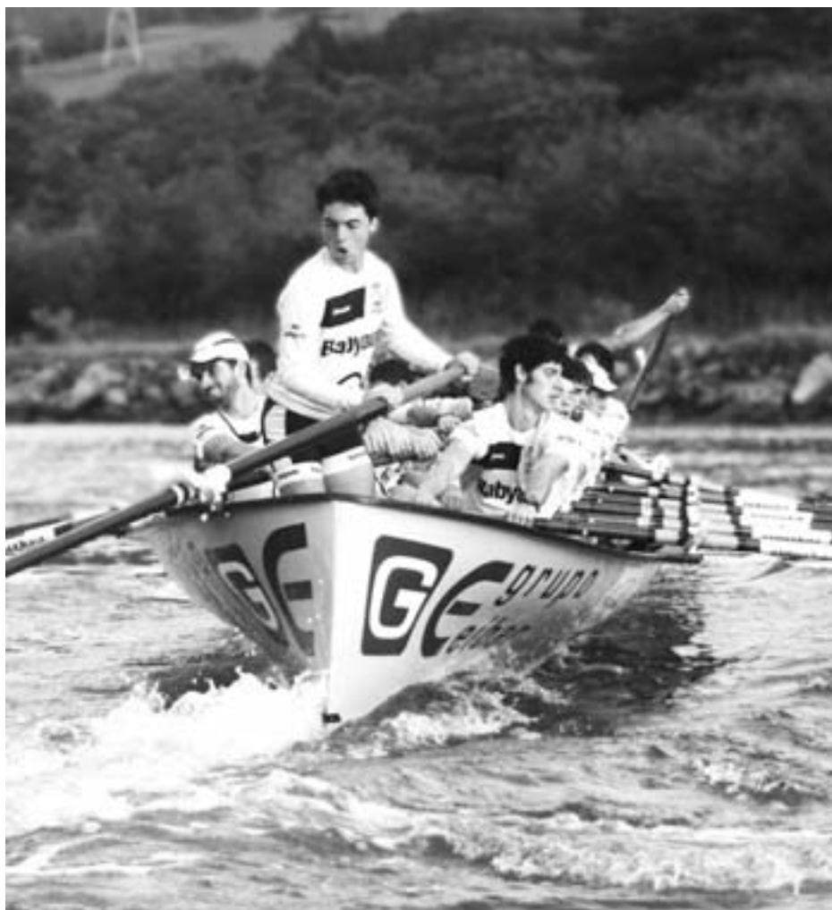
Orio B-ko mutilak play-off aurreko saioan. KARKARA