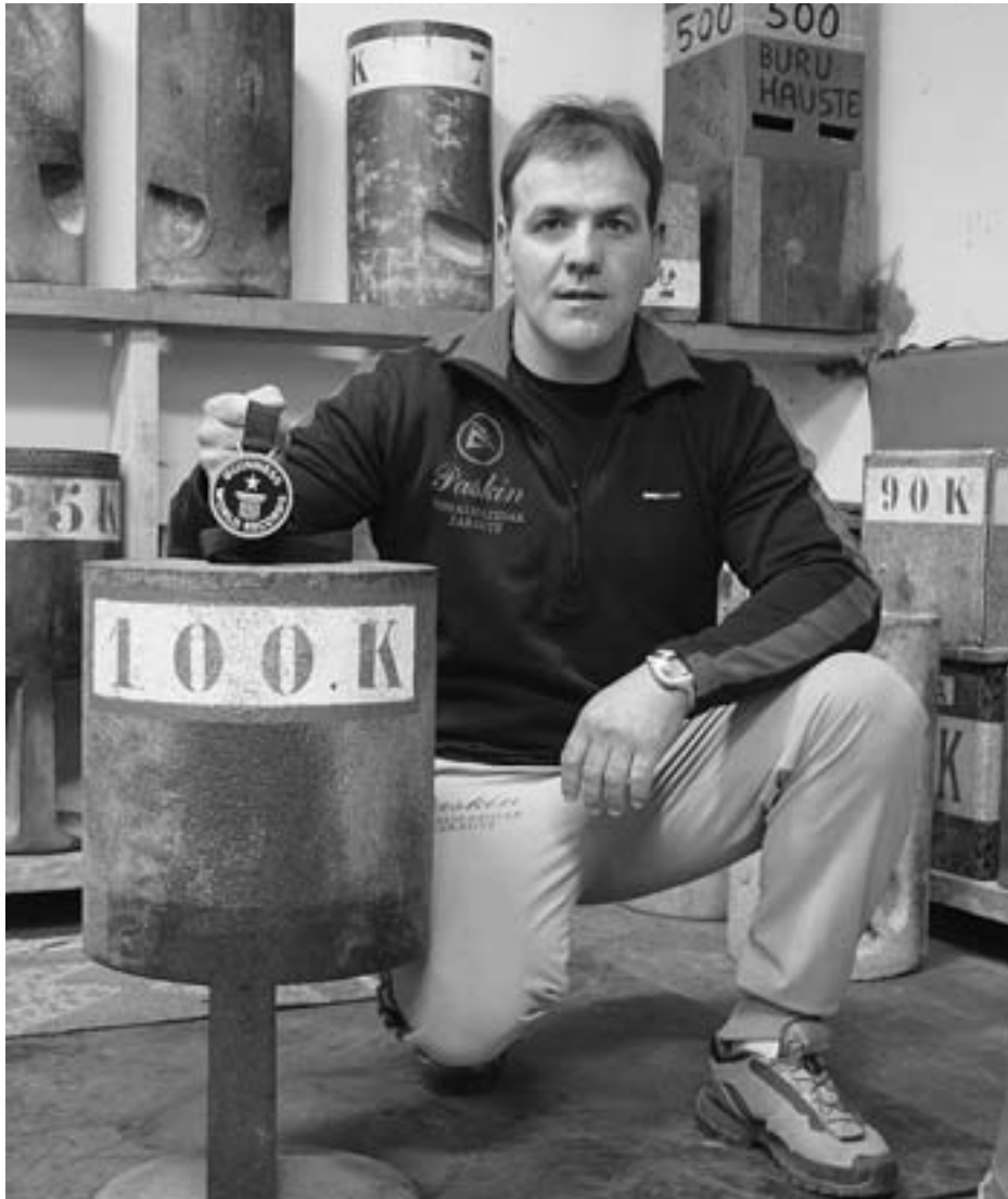
Izeta II.a Guinness marka jarri zueneko domina eskuan duela.