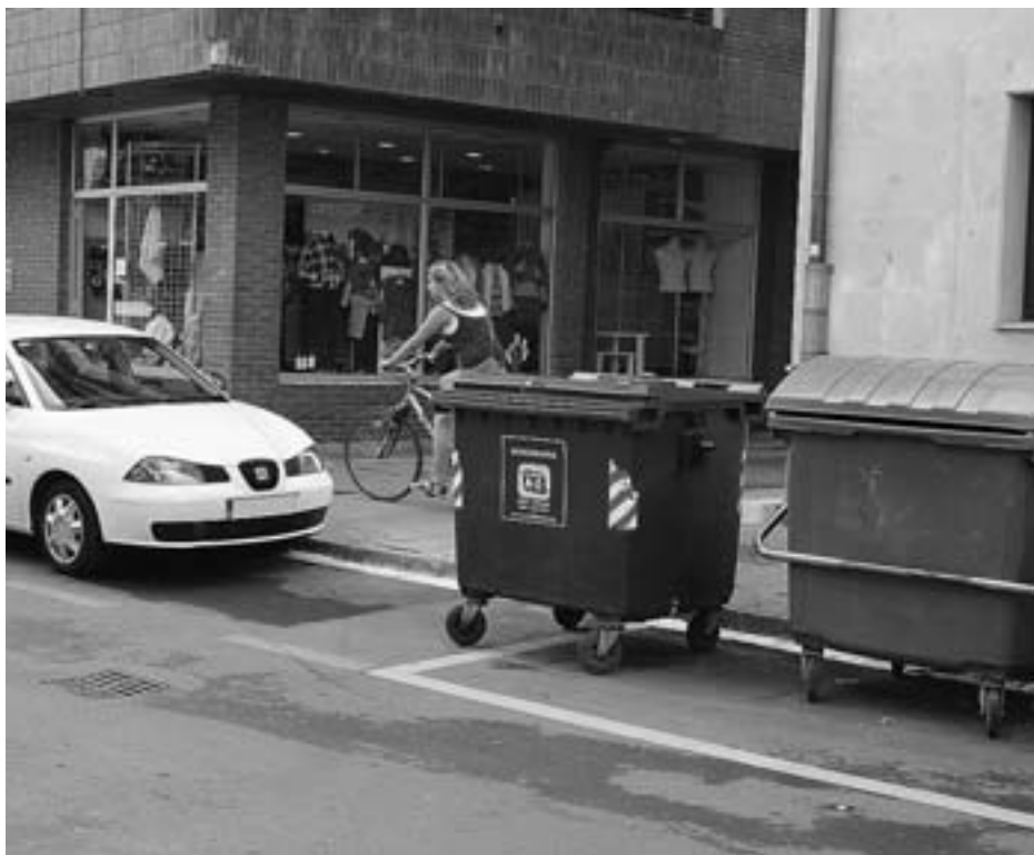
Birziklapen-tasa igo nahi da Ez da marroia: birziklatzea beharrezkoa da kanpainarekin. KARKARA

Baina, oporraldia tarteko, jende gutxik erantzun duenez, inkestari erantzuteko eta ikastaroa jaso nahi duela jakinarazteko epea luzatu egin dute mahaikideek.