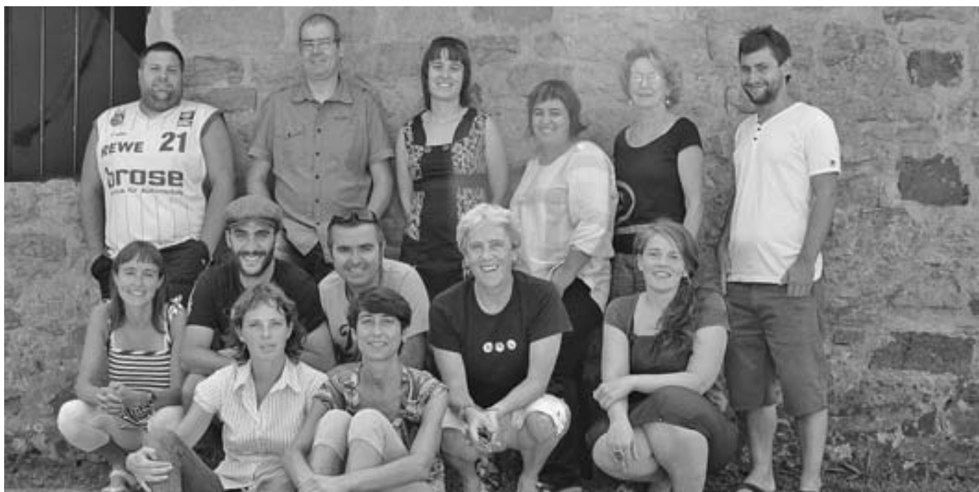
Zahar eta berri, erreleboa iritsi da KARKARA ere. KARKARA

Freskoa da oraindik proiektua, trinkotzeko bidea hasi duena eta erronka berriei heldu nahi diena. Hala eta guztiz ere, KARKARAK hasieratik izan dituen konpromisoak eta izaerari eustea eta sendotzea ditu helburu.