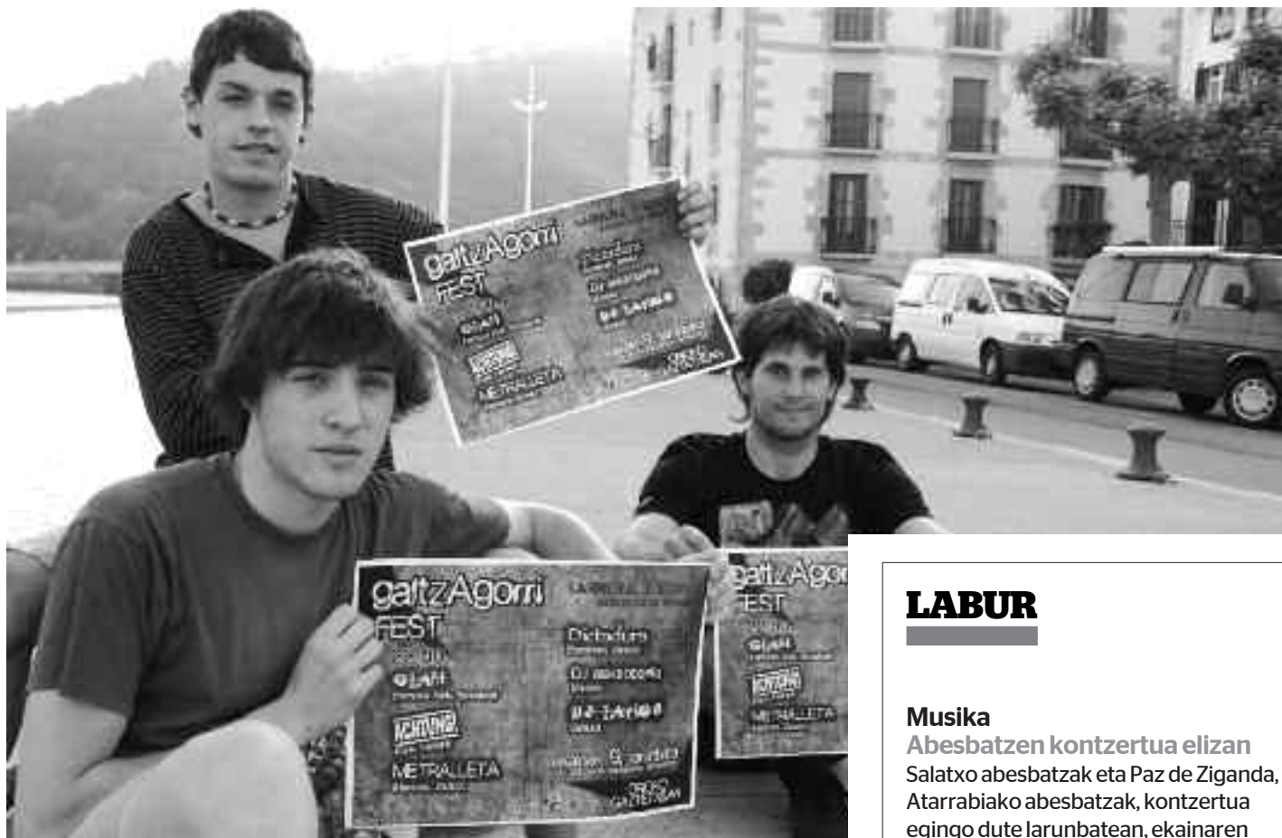
Galtzagorri fest jaia antolatu dute aldizkariaren finantzazioa lortzeko. KARKARA