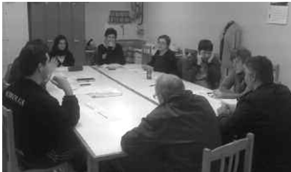
Talde oso zabala da festa batzordea osatzen duena.

Pare bat hilabetez landu dute aurtengo sanpedroetako programazioa. Ekitaldien zerrendan astindu ederra eman nahi izan dute, aurtengo festak asteburuan tokatzen direlako.