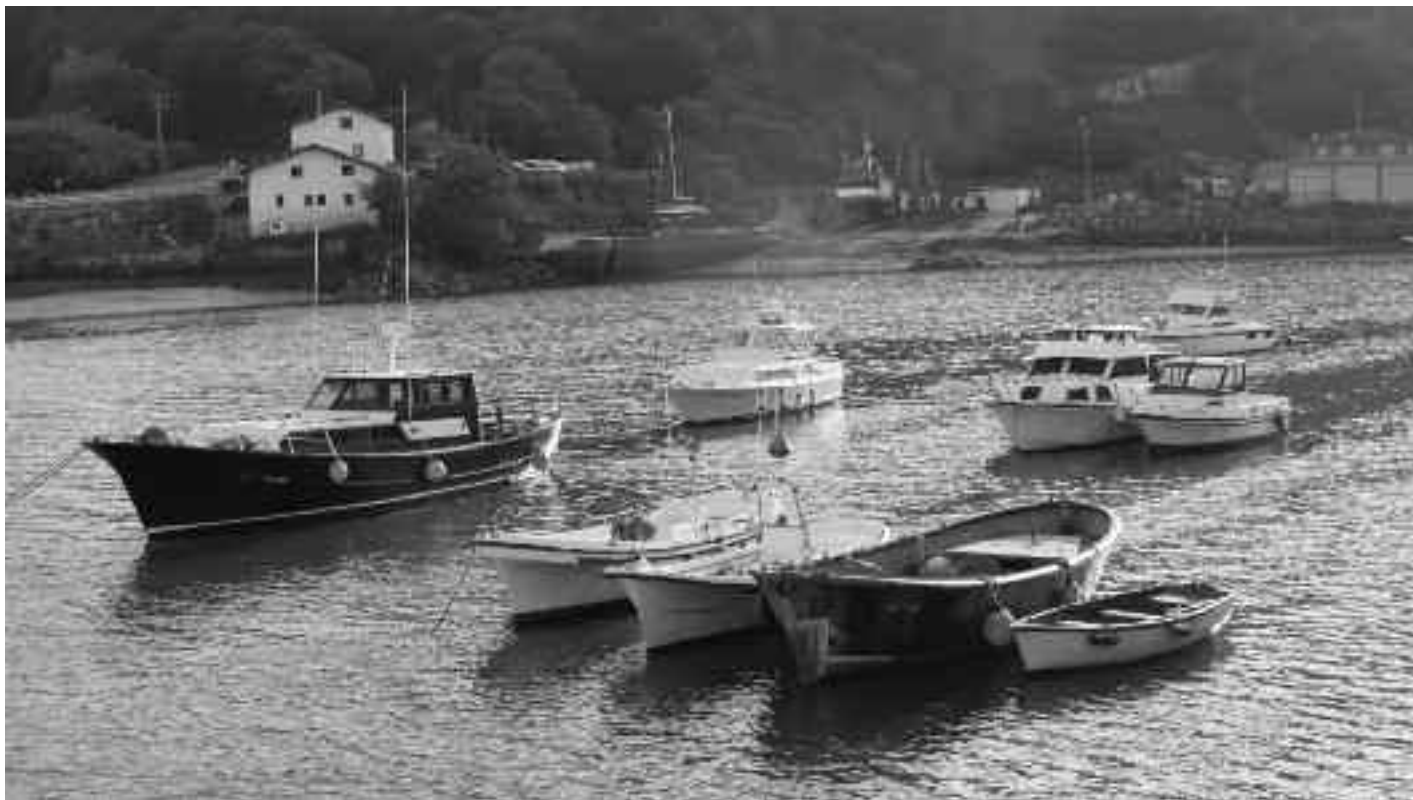
Kofradia eta anbulatorioren kontrara ere badaude hainbat ontzi. KARKARA

ontziak, batean eta bestean badaudela. Gero eta kabinadun ontzi gehiago dago eta horiek bietarako dira, arrantzarako eta paseorako. Batzuk oso gutxitan erabiltzen dute ontzia, badira beste gutxi batzuk, 6-8, goiz eta arratsalde ibiltzen direnak. Etxerako lupia bat harrapatzeak, nori ez dio ilusioa egiten! Udan lagunak bisitan etorri eta paseatzera ere joaten gara txalupan. Arrain txiki txapelketa ere antolatu izan dugu.