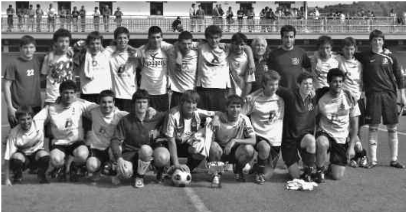
Kopa belar gainean dutela, pozik ageri dira Orioko Futbol Taldeko mutilak. O. ZULOAGA