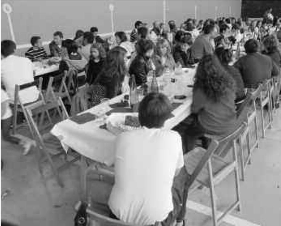
220 laguntzako prestatuko dute bazkaria antolatzaileek. KARKARA