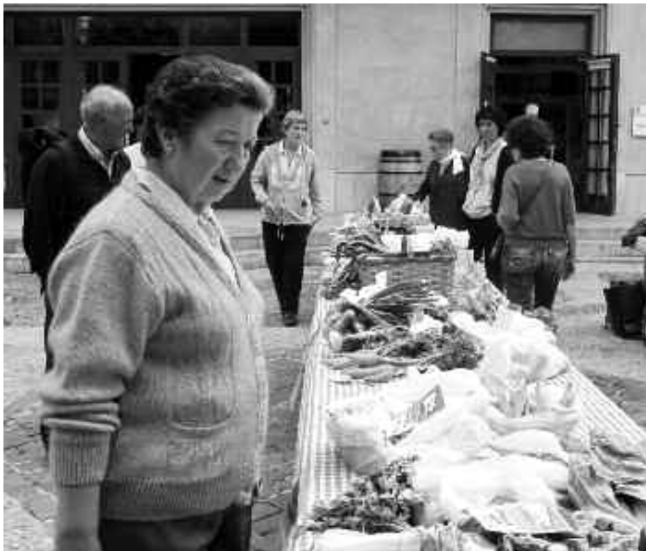
Azken urteetan festetan edo ekitaldi berezietan bakarrik egin dira azokak plazan. KARKARA

Udalaren ekimen honetan, Arkupe elkarteak denez gain, herriko gainerako dendariak ere hartu dute parte.