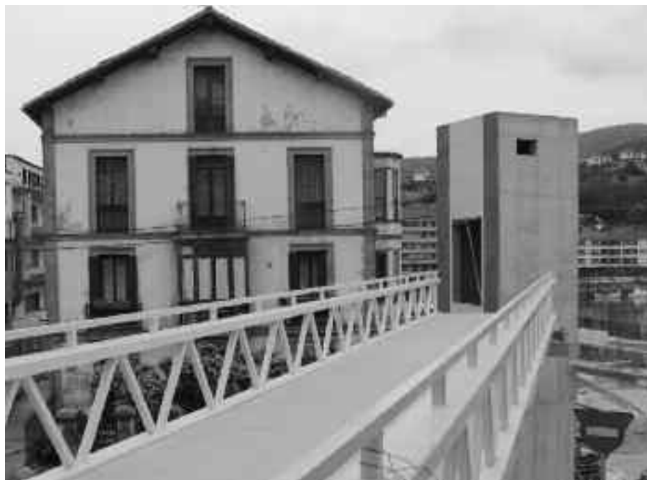
Geltokirako zubia maiatzaren hasieran jarri zuten eta igogailua ekainean ipiniko dute. KARKARA

Igogailuak oinezkoen onerako izango dira, baina auto-gidari entzat ere izango da aukera tren geltokira gerturatzeko. Izan ere, geltokiaren azpian geratu den eremuan aparkalekua egokituko dute eta 55 autorentzako tokia izango da, baita ezinduen automobilentzako beste bi leku ere.