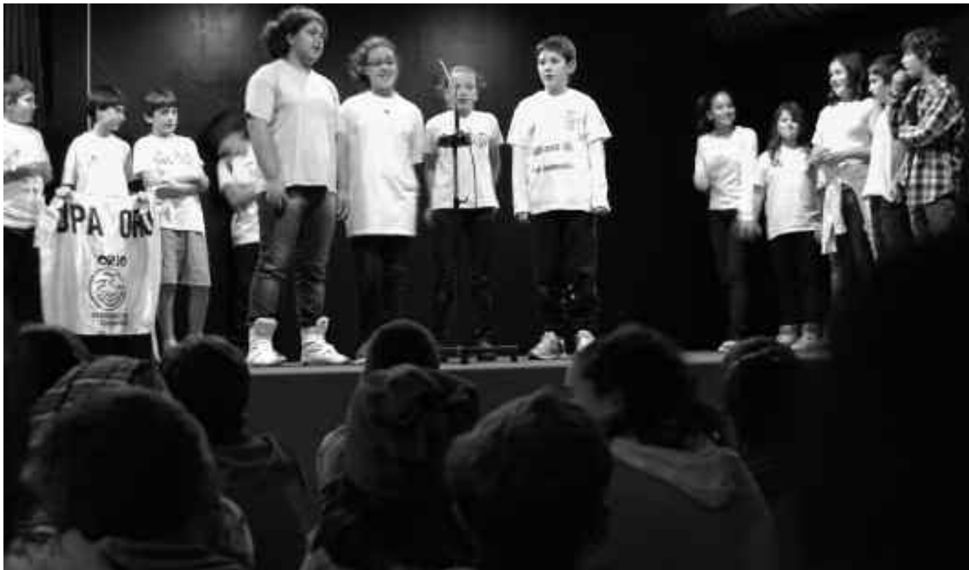
Bi eskoletako umeeek ikastolako aretoan egin zuten bertso-saioan, Zaraguetakoak kantari. KARKARA