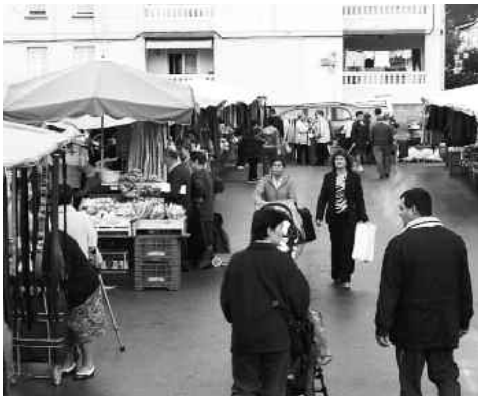
Horrelako irudia festa egunetan baino ez da errepikatuko aurrerantzean. KARKARA