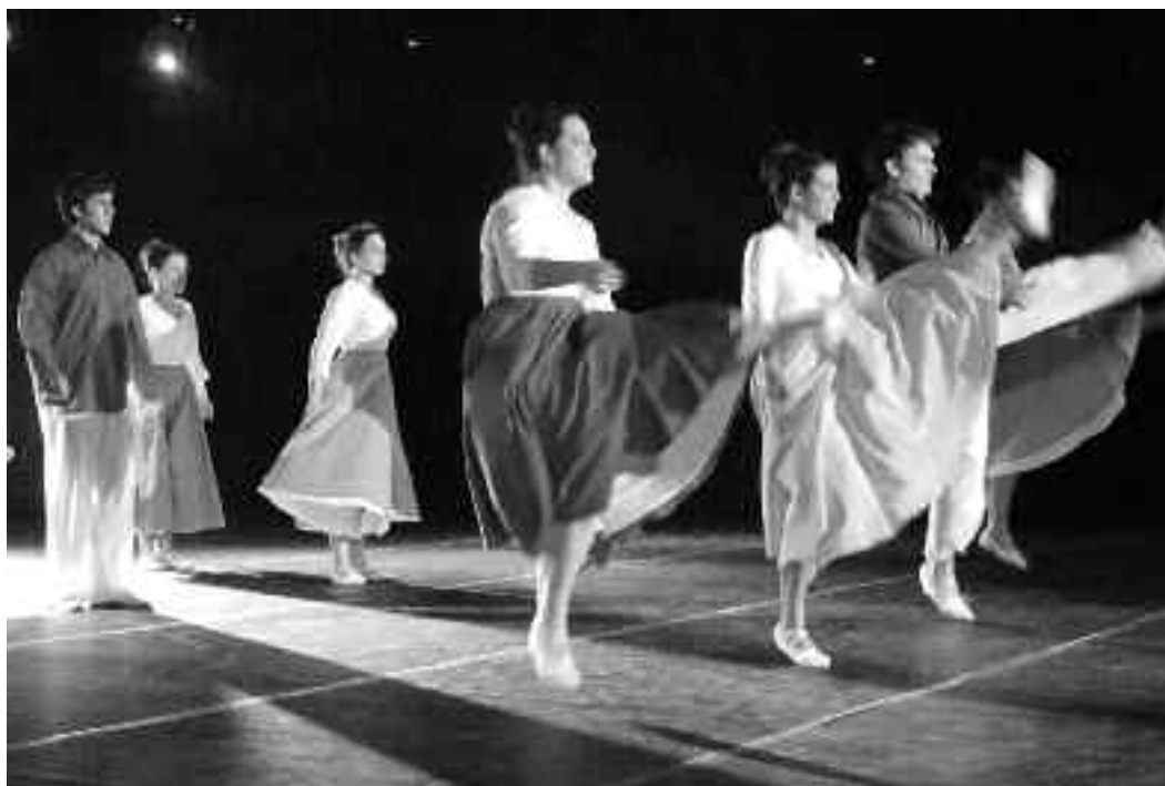
Harribil dantza taldeak ikuskizun berria estreinatu zuen Karelan. KARKARA