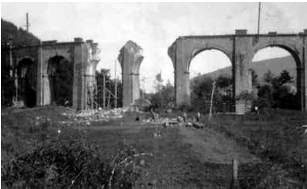
1936an batzuek zubia bota zuten; 1980an, artean, batzuek eta besteek elkar hiltzen segitzen zuten. ARTXIBOA