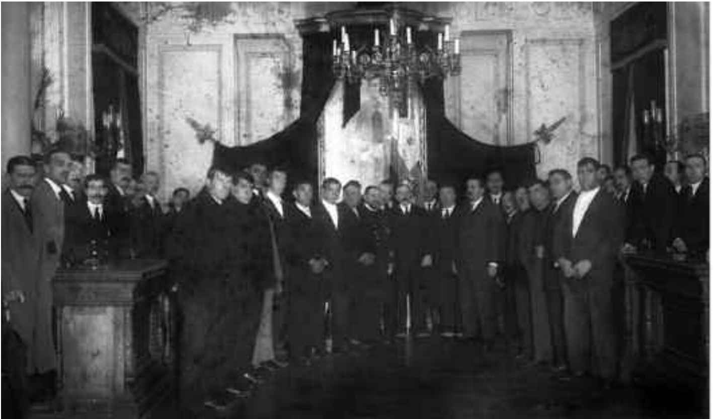
1910eko Kontxa irabazi ondoreneko argazkia.