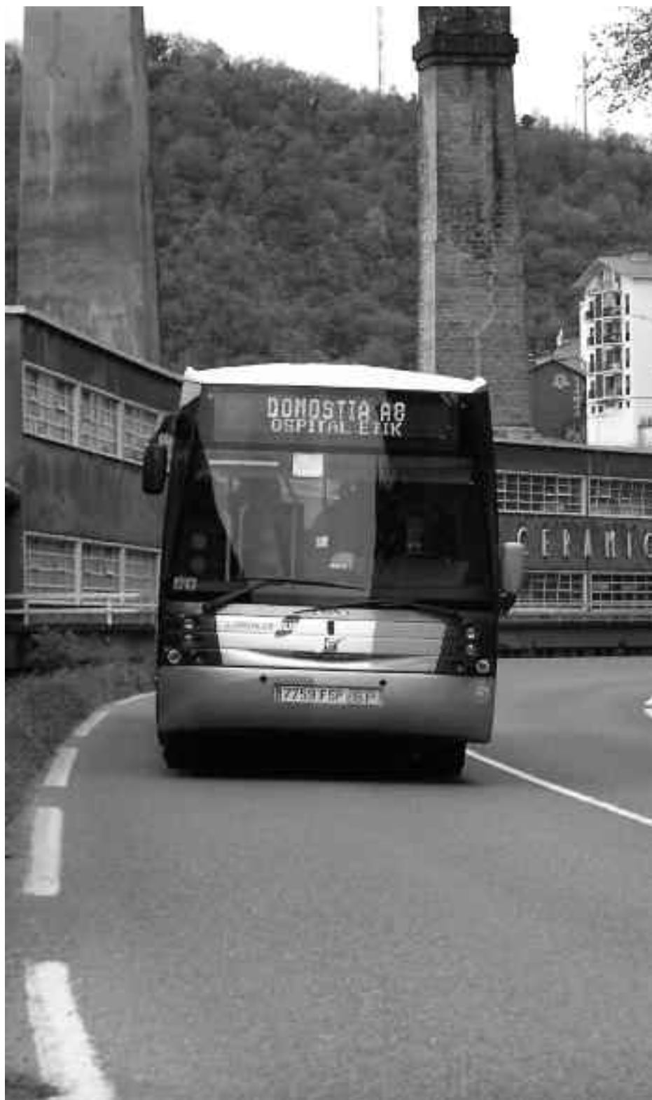
AP-8tik ospitalerako bidea egingo du autobus zerbitzu berriak. KARKARA