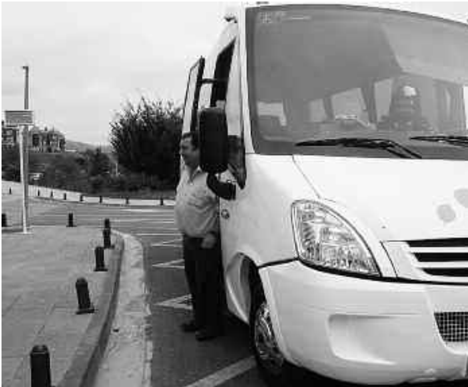
Landabus proiektu pilotoa 2008an jarri zuten martxan Aian. KARKARA