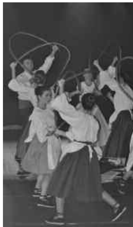
Harribileko dantzariak Herribilen. J. MANTEROLA

Estreinako ikuskizunaren ondoren, Argi Ilun lana beste herri batzuetan ere erakutsi nahi lukete Harribilekoek.