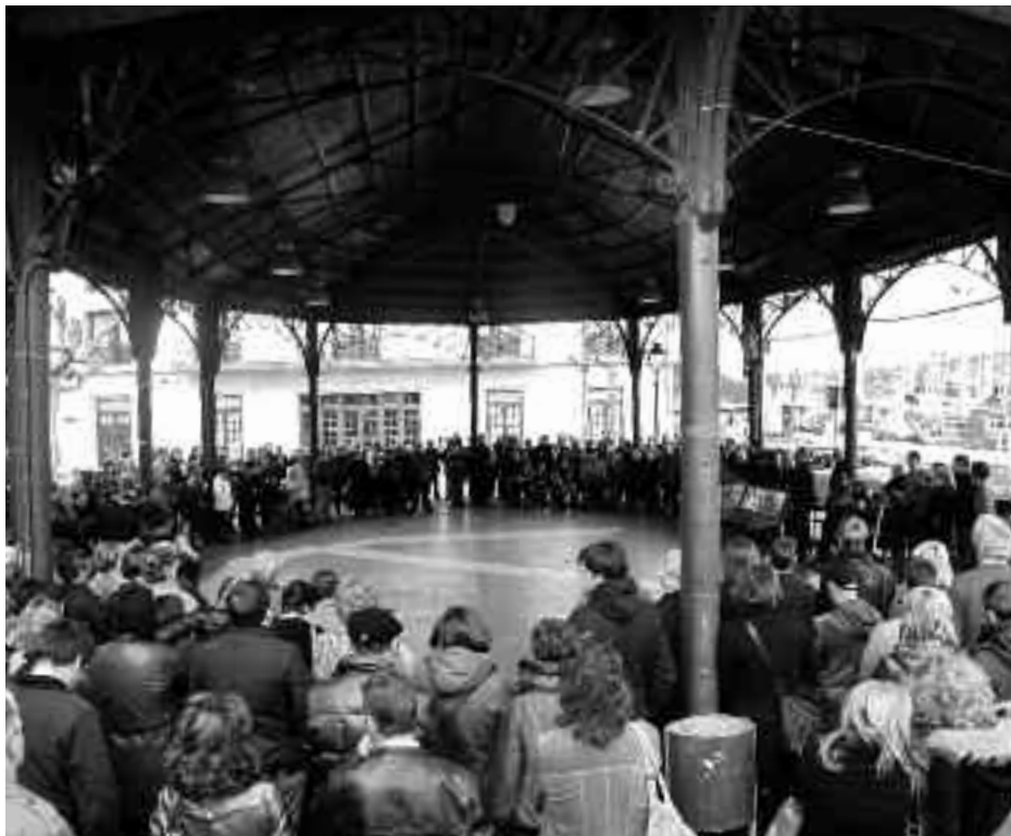
Jende asko izan zen plazan azken elkarretaratzean ere. KARKARA

Auzipeturik zegoen 18 urteko gazteari 10 urteko zigorra ezarri diote –jarri zitekeen handiena– eta, behin hori betetakoan, 5 urteko zaintzapeko askatasuna izango du. Hamar urteko giltzapeko zigorra bete beharko du ustezko hiltzaileak eta ondorengo bost urteetan ezin izango du Getaria, Orío eta Zarautzera hurbildu. Horrez gain, bi urtez ezingo du Azkueren familiakoekin komunikatu, ezta haiek dauden tokitik 500 metro baino gertuago ere. Gainera, 922.000