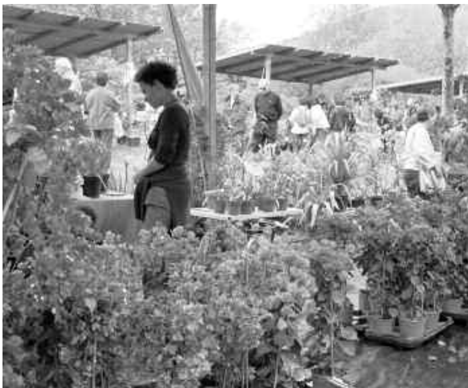
48 mintegitako ordezkariak askotariko loreak ekarriko dituzte. ARRETA PAGOETA

Azokara joan nahi dutenentzat bi aparkaleku egokituko dituzte; bat Aian eta