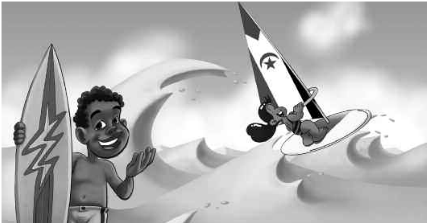
Kanpainarako erabiliko duten irudian Saharako haurrak uretako kirolak egiten ikusten dira.