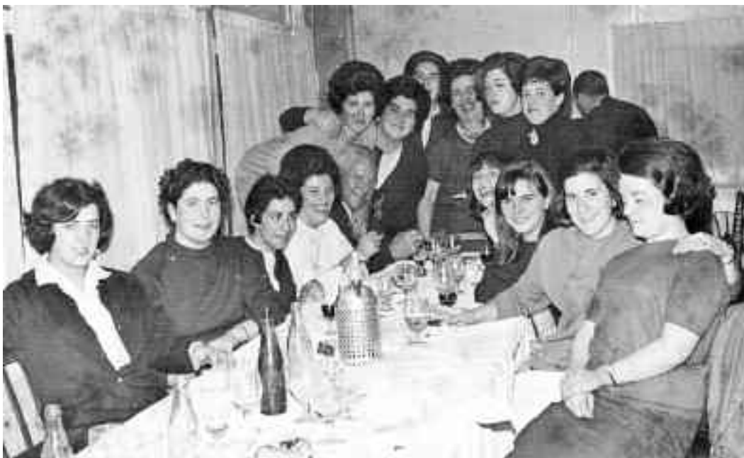
Emakume kortsarioaren argazkirik ez dugu, baina neska hauek Toki Alain jan-festa egin zutenekoa bai.