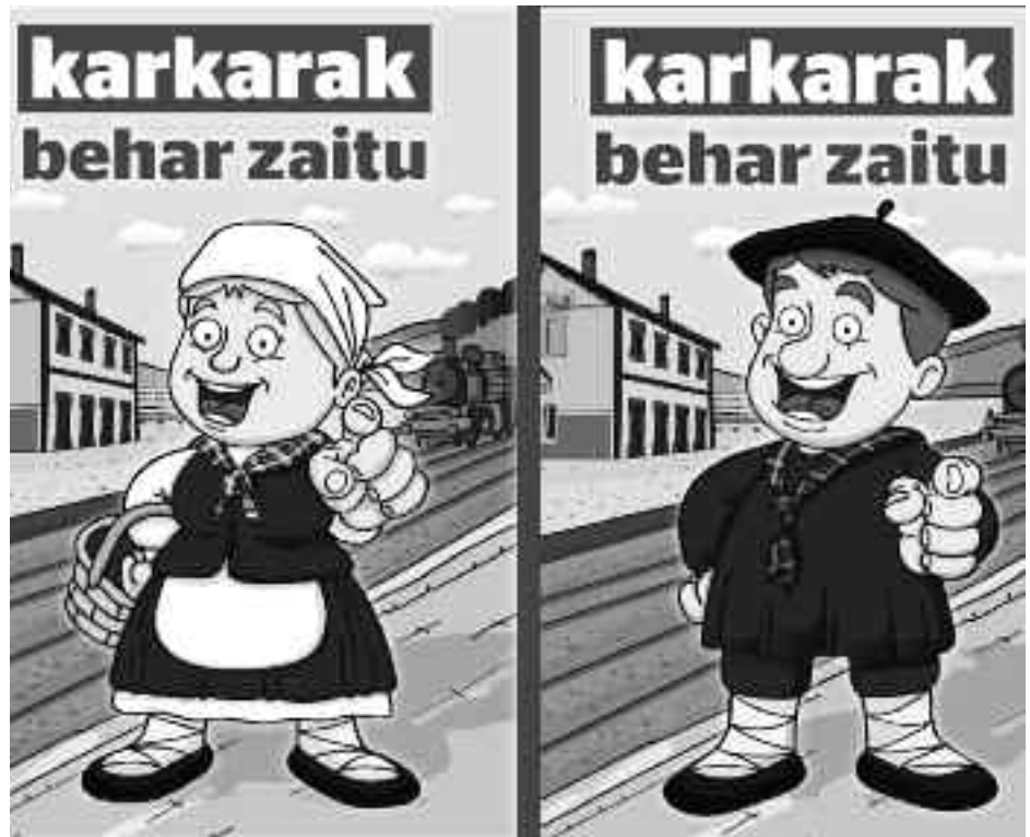
Atzeko azalekoaz gain, irudi hauek erabiliko ditu Karkarak egingo duen kanpainan. J. TOQUERO

Bide horri helduko dio KARKARAK datozen hilabeteotan eta horretarako abiatu du Karkarak behar zaitu kanpaina. Aldizkaria egiten dutenen helburua da 500 laguntzaile izatera iristea.