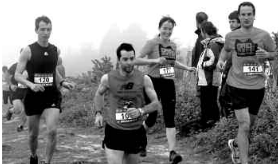
Iaz lanbroa izan zuten Kukuarri inguruan korrikalariak.

Ibilbide desberdina izango du aurten probak eta izena emateko epea irekita dago. Gehienez ere 350 pertsonentzako izango da dortsala eta dagoeneko 236 korrikalarik eman dute izena sarean.