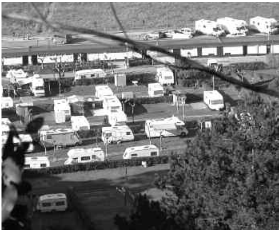
Aurrekontuetako zati bat 2012an kanpinean bungalowak jartzeko bideratuko dute. KARKARA

Bestalde, nabarmendu dute herriko elkartei bideratutako diru-laguntzek gora egingo dutela; batez ere, kirol elkarteentzako laguntzek. Kirol elkarteek 130.000