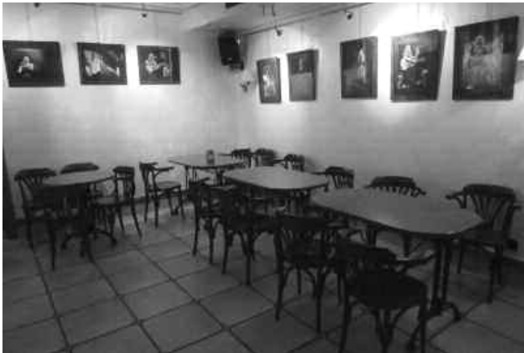
Argazkiak ikusteko toki aproposa da Salatxo, eta erakusketak merezi du bisita. KARKARA