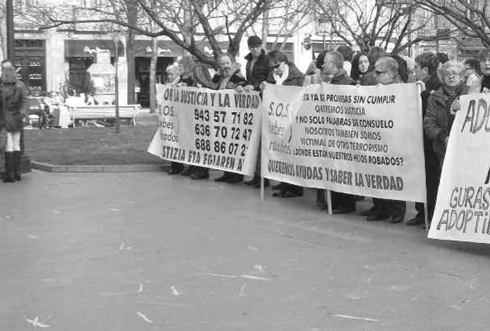
Martxoaren 3an, SOS Haur Lapurtuak elkarteak deituta, Donostiako Artzain Onaren eliza aurrean egin zuten agerraldia haur lapurtuak aurkeztuz.