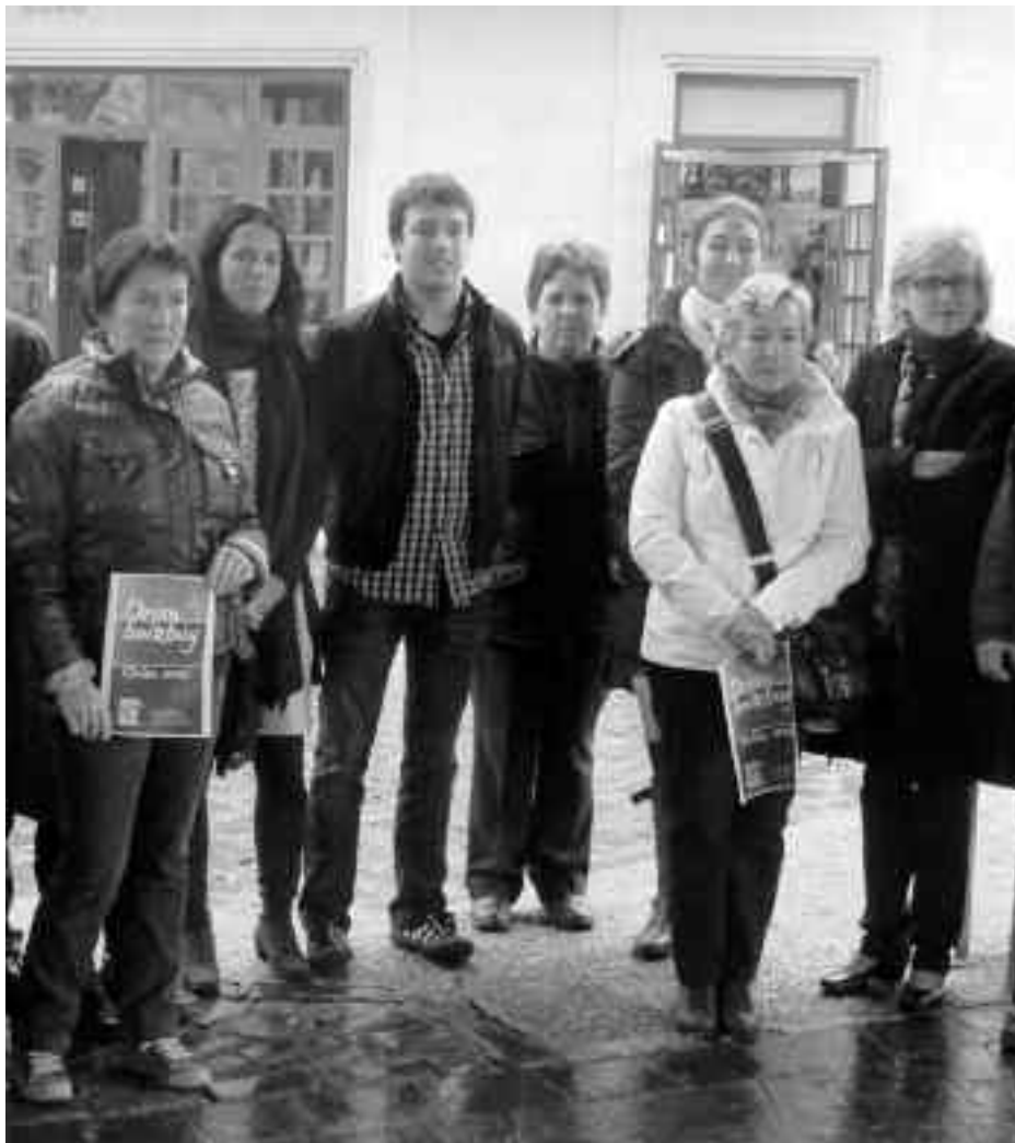
Kanpaina berrian Arkupekoetz gain, herriko beste dendariak ere hartuko dute parte. KARKARA

Iazkoari jarraituz, bigarren eskuko azoka izango dugu hilean behin Orion. Saltzeko gauzak dituzten oriotar guztiek izango dute mahaia jartzeko aukera.