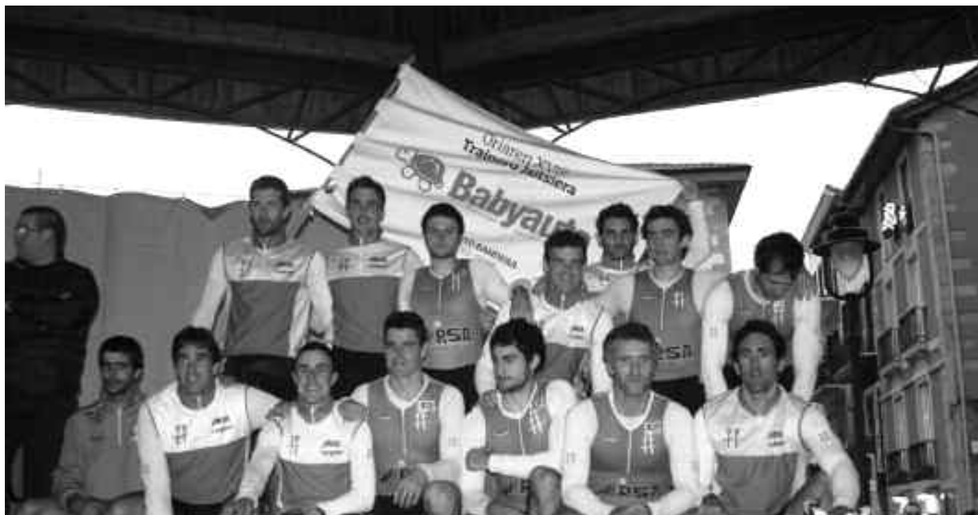
Hondarribian Oriok irabazi zuen hilaren hasieran; hondarribiarrek berriz Orion. KARKARA