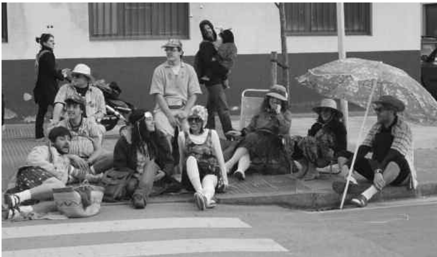
Taldekako mozrorrik onenak saria jasoko du desfilearen ondoren, baita bakarkako edo binakakoak eta karrozarik onenak ere. KARKARA