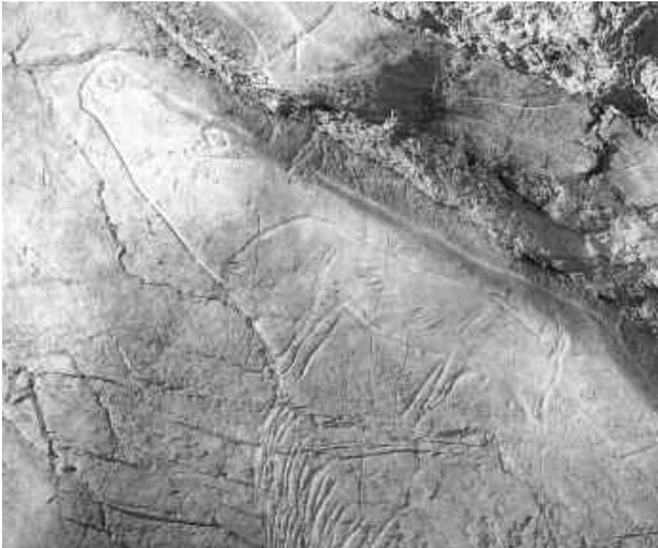
Elur-oreina eta azeria Altxerriko kobazuloko horman grabatuta. ARANZADI ZIENTZIA ELKARTEA