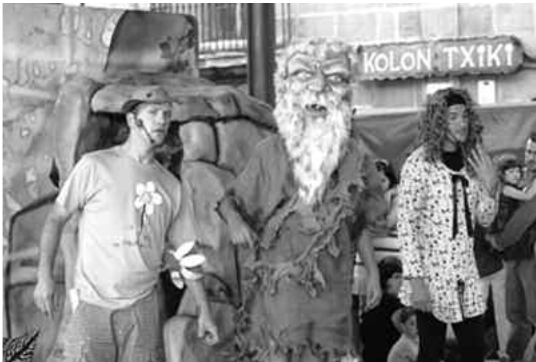
Sanpedroetan plazan egin zuten emanaldia Trikuharri taldekoek.