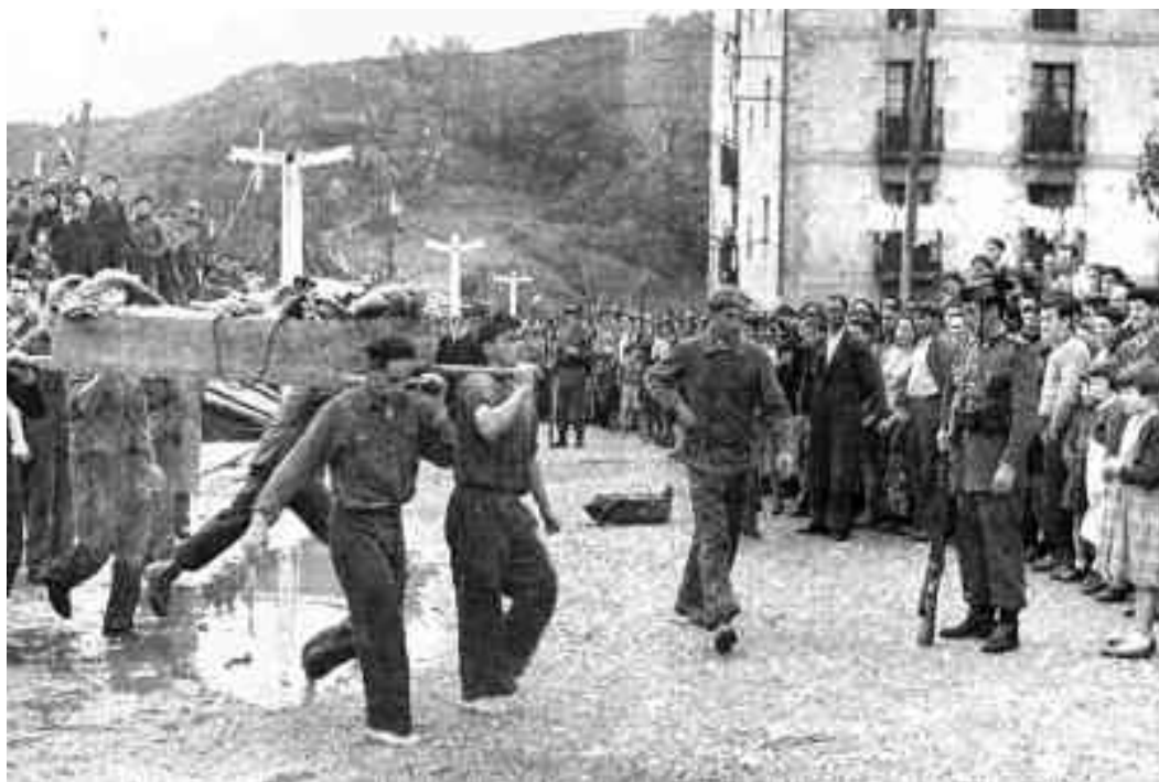
Jendeak gogoan duen zorigaiztoko azken hondoratzea Virgen Carmelirena izan zen, 1952an.