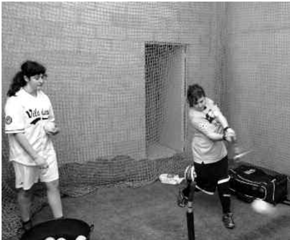
Astearte eta ostegunetan bateatzeko tunelean aritzen dira OBBko neskak. KARKARA