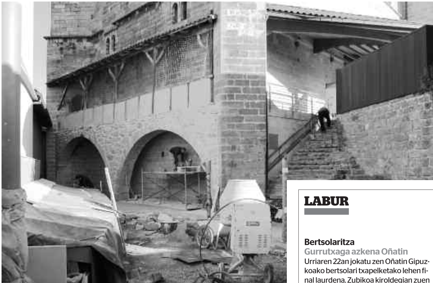
Salatxo eta elizaren artean plaza txiki bat egiten ari dira. KARKARA