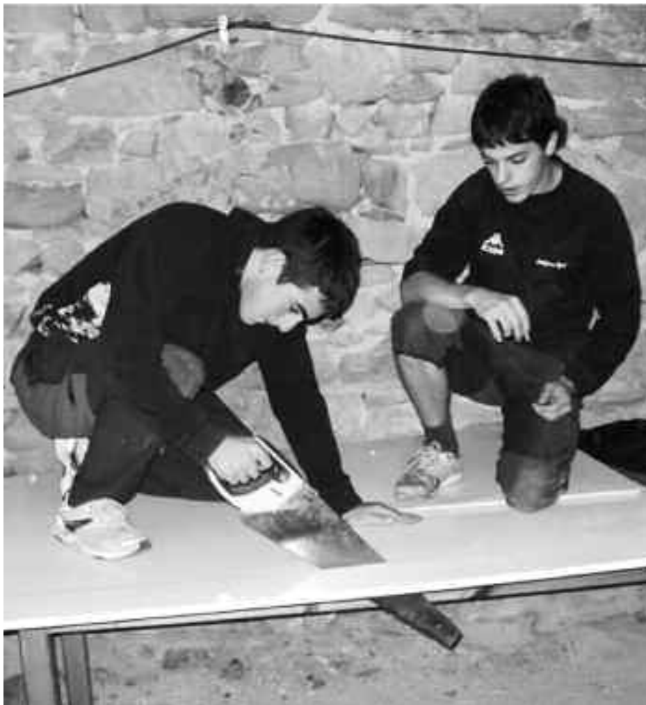
Aurreko auzolanetan bezala, oraingoan ere gazte ugari bildu dira Etxeluzen. LAIDA ITURRALDE