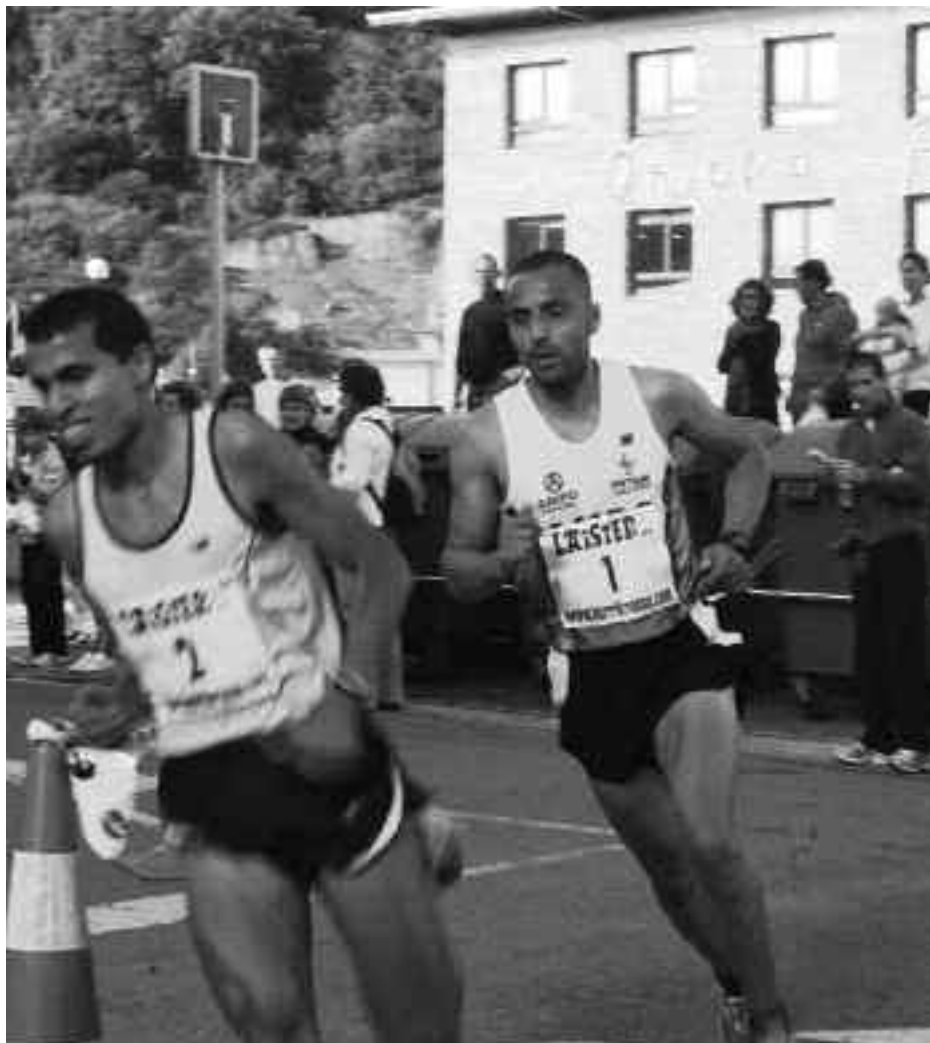
Kaanache 2 zenbakiarekin 2. izan zen ibilbide luzean; Ziani 1 zenbakiarekin garaile laburrean. KARKARA

Parte-hartzea handia izan zen urriaren 23an egindako lasterketan. 300 inguru korrikalari izan ziren irteeran eta 278k bukatu zuten Orioko Herri Ikastolak berriz ere martxan jarri duen proban.