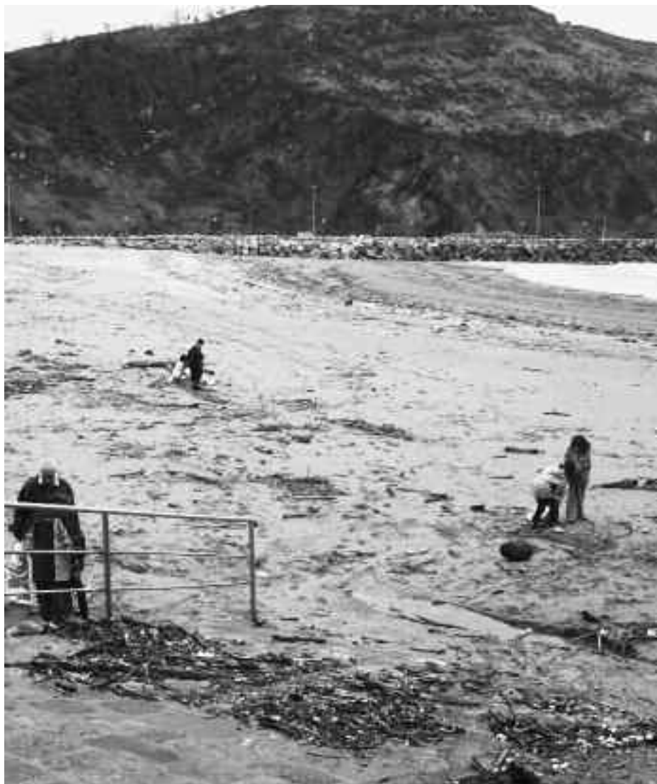
Besteak beste, hondartzaren egoera aztertzeko, aholkularien beharra nabaritu du Udalak. KARKARA