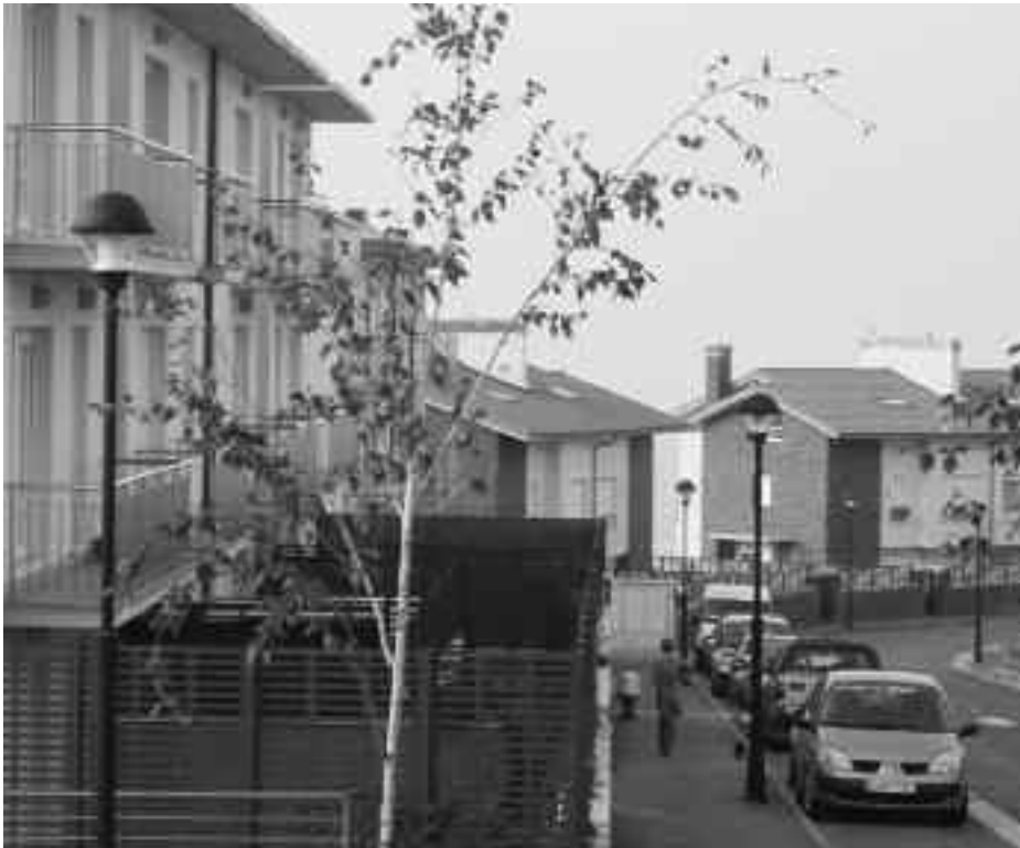
Amets Gain kooperatibako kideei trabak jarri zizkieten etxebizitzaren eskriturak egiterakoan. KARKARA