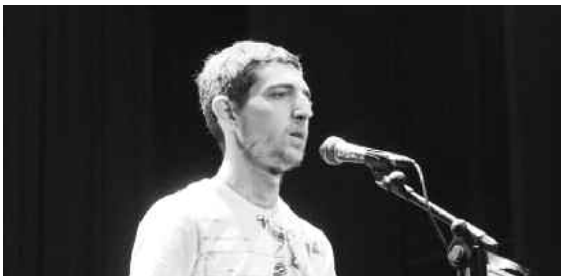
Gipuzkoako txapelketan, Elgoibarko final zortzirenean, kartzelako ariketan kantatutako bertsoak. KARKARA

KARKARAK ez du bere gain hartzen aldizkarian adierazitako esanien edota iritzien erantzukizunik. KARKARAN argitaratutakoa berremen daiteke, osorik edo zatika, baldin eta iturria aipatzen bada.