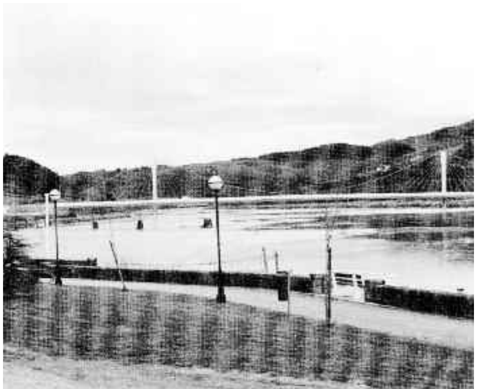
Zubia eraikitzea izango da azken lana; baina ez dute orain egingo. ALDUNDIA