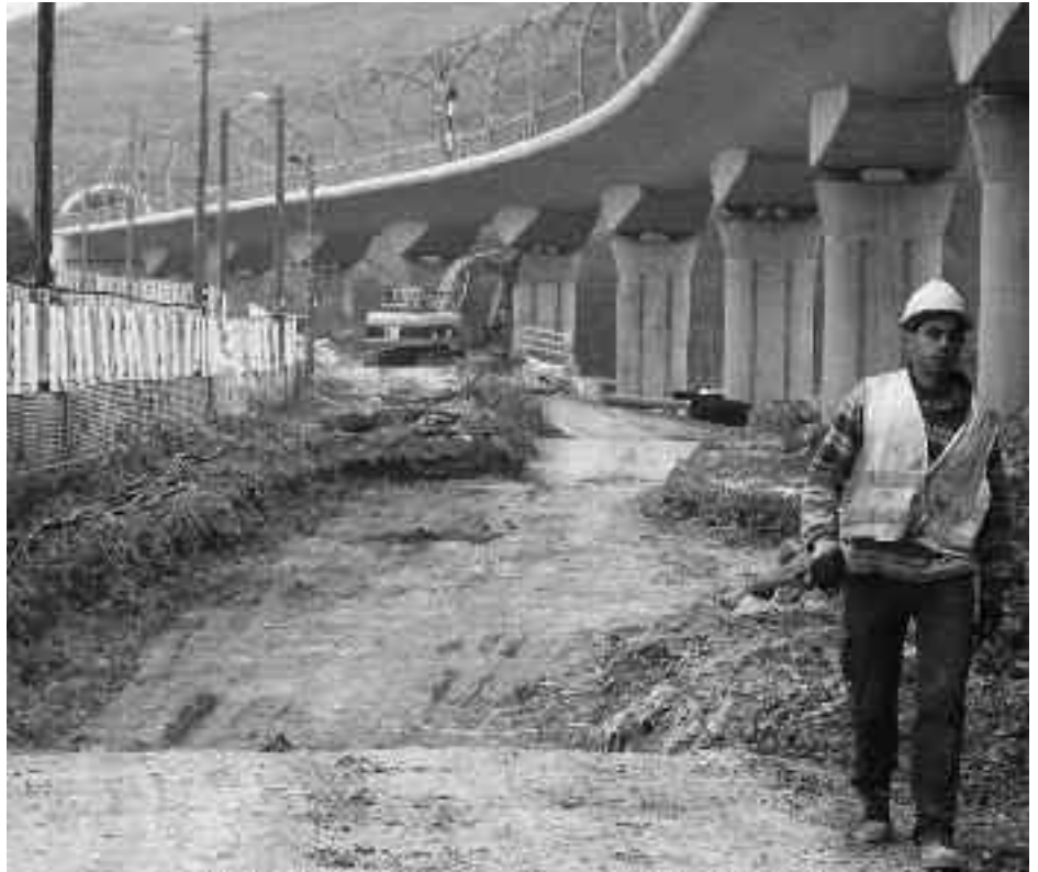
Lehenengo errepedearen ondoan ari dira berria egiten. KARKARA

Lanaren azken fasean erriorearen bi aldeak lotuko dituen zubia egingo da. 2008an egin zuten proiektua eta horrekin bukatuko da saihesbidea.