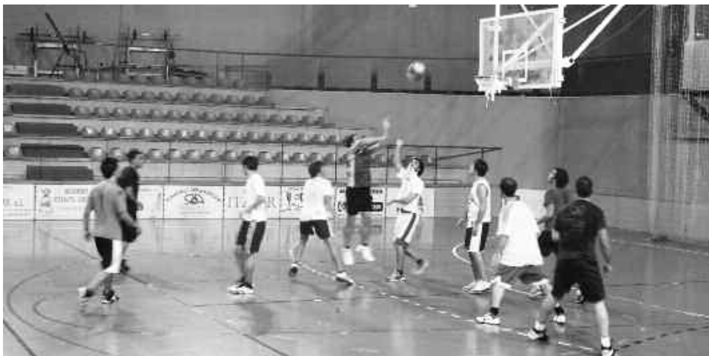
Entrenamenduetan taldekoak ez diren hainbat jokalarik ere jokatzen dute Alustiza Autobusak-Orio taldeko mutilekin. KARKARA

Benjaminen 3x3ko eskolarteko jardunaldiak ere martxan jarri ziren urriaren 8an. Lehen jardunaldian, Ikastolako eta Zaraguetako taldeek Karela kiroldegian izan zituzten partidak. LH 3. eta 4. mailako 12 talde ari dira guztira eskolartean lehiatzen eta hemendik hasi eta Gabonak arte iraungo du benjaminen saskibaloit denboraldiak.