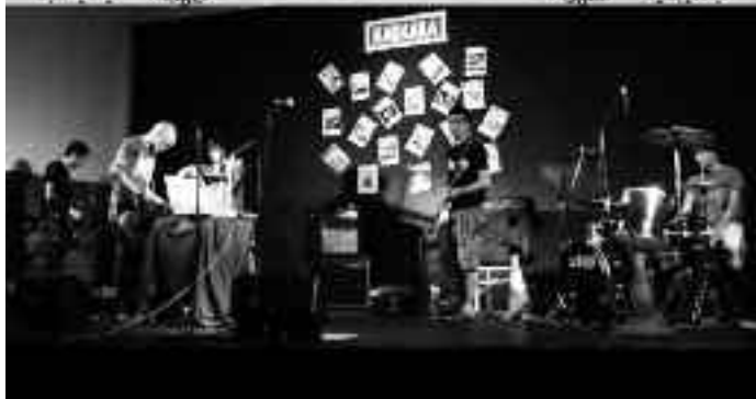
Beheko irudian, duela bi urte eman zuten kontzertuan. GIRANICE / KARKARA

karren artean melodia nagusia eramatearen erantzukizuna denboraz aldatuz. Abilezia aparta erakusten du taldeak, erritmo dantzagarri eta melodia alaietatik, ezustean, mantso eta doinu melankolikoetara pasatzeko, edo alderantziz, aukera ugariarekin dotore jostatuz.