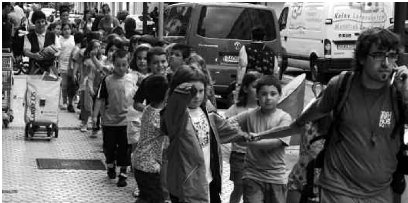
Iaz baino 70 haur gehiagok eman du izena aurtten udaleku irekietarako. KARKARA

Txurrumuskitik eskaera berezia ere egin nahi diete oriotarrei: udalekuetan moztu- rrotu ahal izateko arropa zaharrak behar dituzte; beraz, etxean soberan izanez gero, udalekuetako egunetan Ikastolako pergolara ekartzea eskertuko dute.