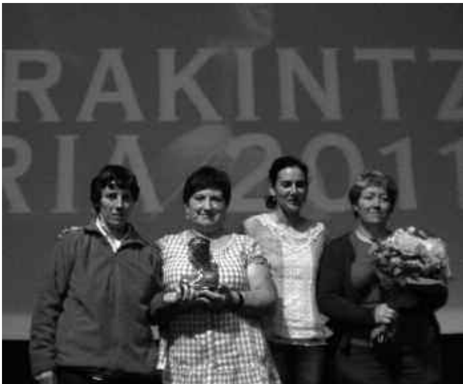
Eskultura eta dirua jaso zituzten Hitzez elkarteok Muskizko Udalaren sariarekin. MUSKIZKO UDALA

Ekainaren 26an, larunbatarekin, Euskadiko Lur Gaineko Sokatira Txapelketa jokatu da kanposantu ondoko zelaian 11:30ean. 600 kiloko modalitate mistoan honako taldeek hartuko dute parte: Getxo, Gaztedi, Gaztedi Mistoa, Gohierri A, Gohierri B eta Mutriku.