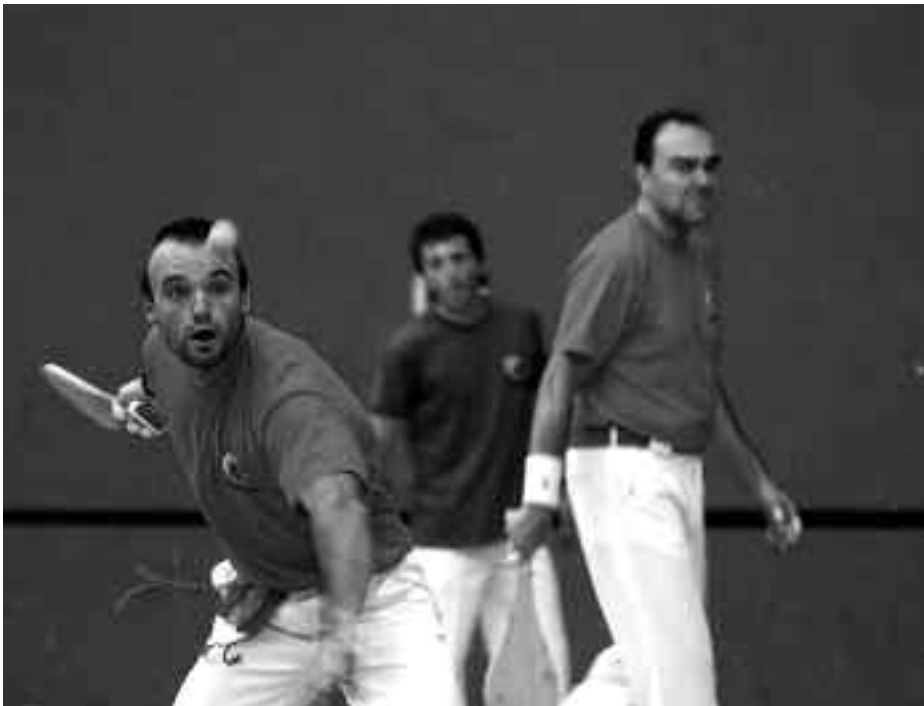
Matxain eta Polo irabazleek beste bikotekide banarekin arituko omen dira datorren urtean. KARKARA

Bestalde, Pilota elkarteak eta gaztetxeak antolatuta, frontenis txapelketa izango da uztailaren bigarren astetik aurrera. 15 urtetik gorakoentzat izango da, eta parte hartu nahi dutenek ekainaren 24a baino lehen eman behar dute izena kiroldegian edo Baraka, Errusta zein Aterpe tabernetan eta 10 euro ordaindu.