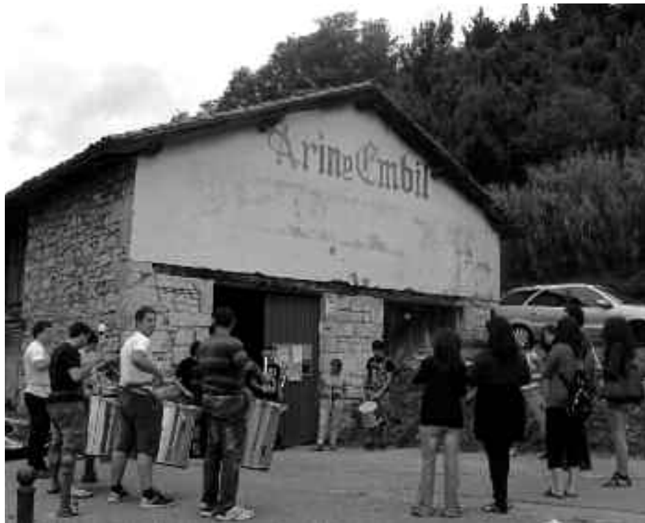
Asteartetan entseatzeko dute batukadakoei, antolatu duten ikastaroan. KARKARA

Bileran, beste hainbaten artean, Etxeluze eraikina bera izan zuten gai nagusi.