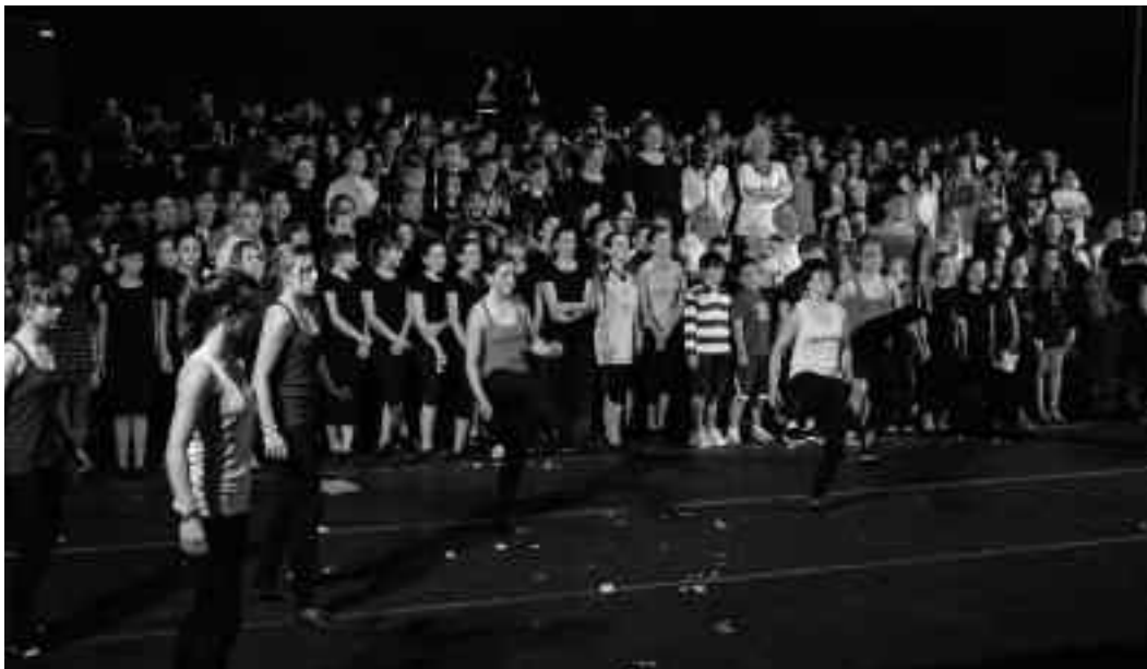
Parte hartu zuten guztiek batera kantatu zituzten Bailearen bertsoak, bandak eta dantzariak lagunduta. KARKARA