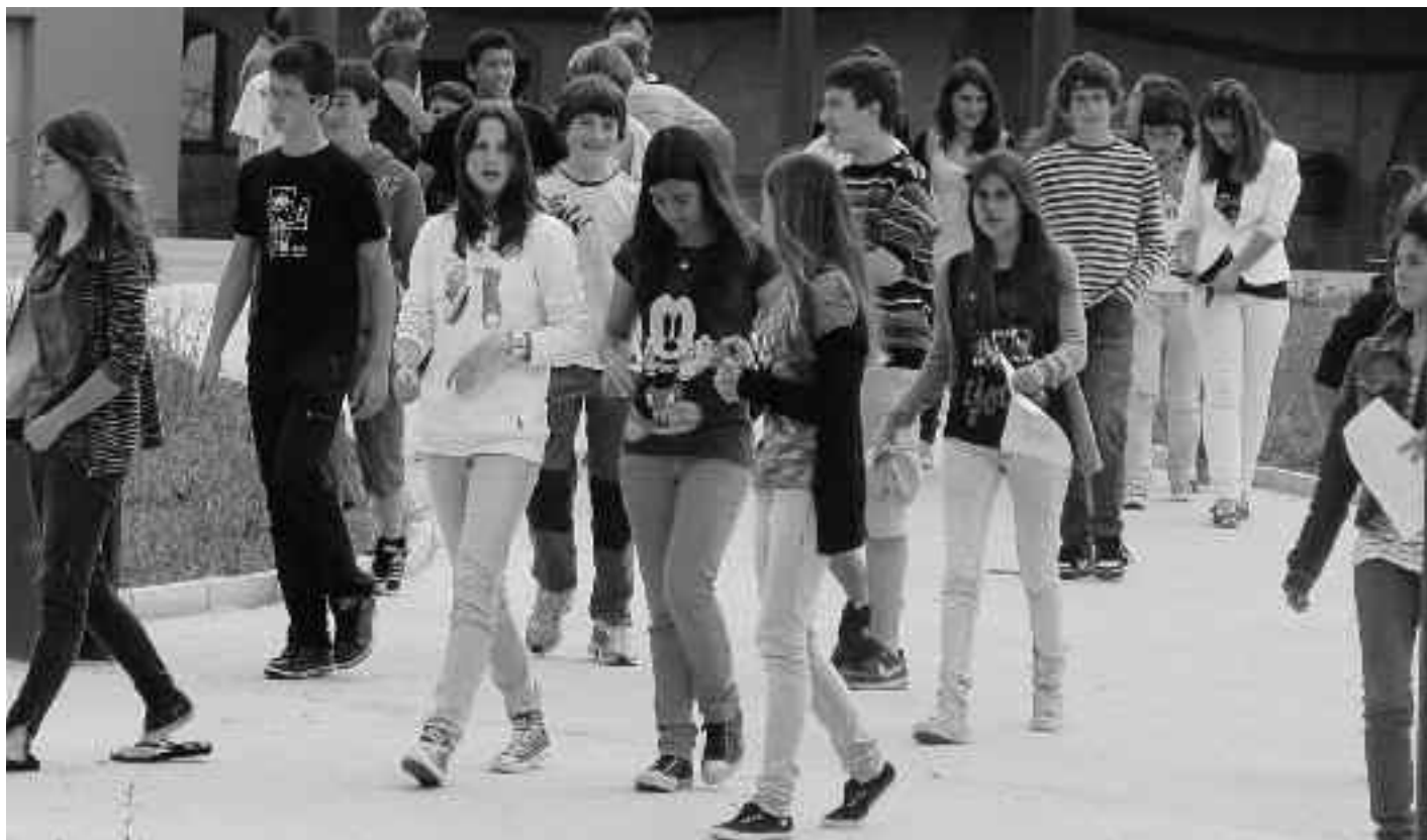
Gaztetxoekin lan handia egiten ari dira herriko ikastetxeetan Askagintzakoak. KARKARA