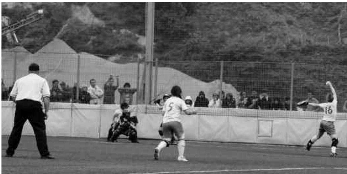
Orioko pitchera jaurtitzear bertan bildu ziren ikusleen begiradapean. KARKARA

Eguzki OBB taldea oso fin dabil azkenaldian. Kadeteak Espainiako txapeldu-norde izan dira eta seniorrak, liga bukatzeko 3 jardunaldi falta direnean, bigarren dira sailkapenean. Lehen lauen artean sailkatuz gero Erreginaren Kopa jokatuko dute uztailean, eta Europako txapelketan izango dira OBBko sofbolariak Bulgarian abuztuaren.