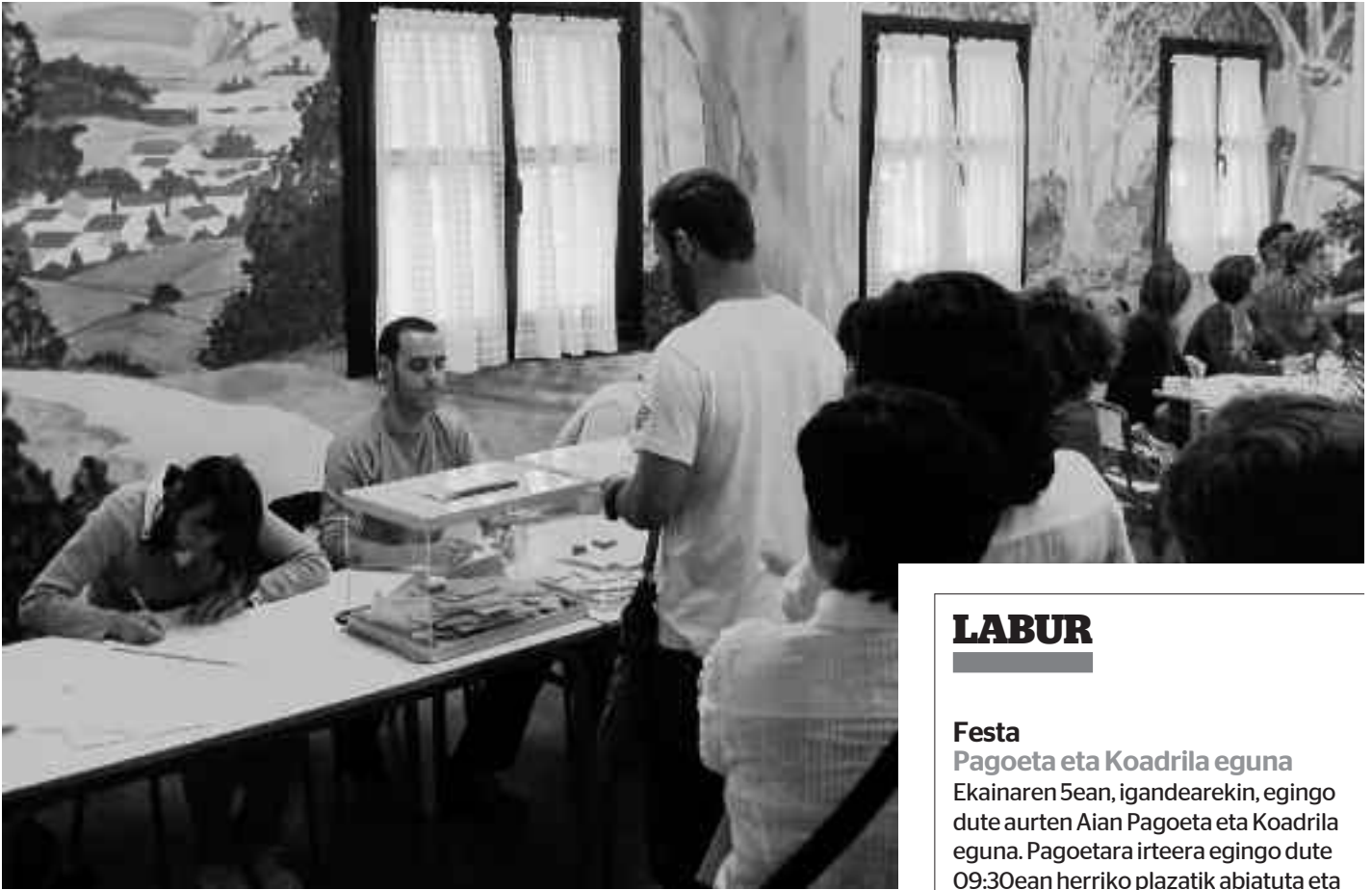
Aiako eskolan sekula baino jende gehiagok izan zuen bozkatzeko aukera. KARKARA