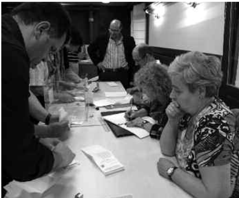
Boto kontaketa arreta handiz egin zuten ikuskatzaileek. KARKARA

Datuon argitan, ez dago garbi nor izango den Orioko hurrengo alkatea, aukera bat baino gehiago dago-eta.