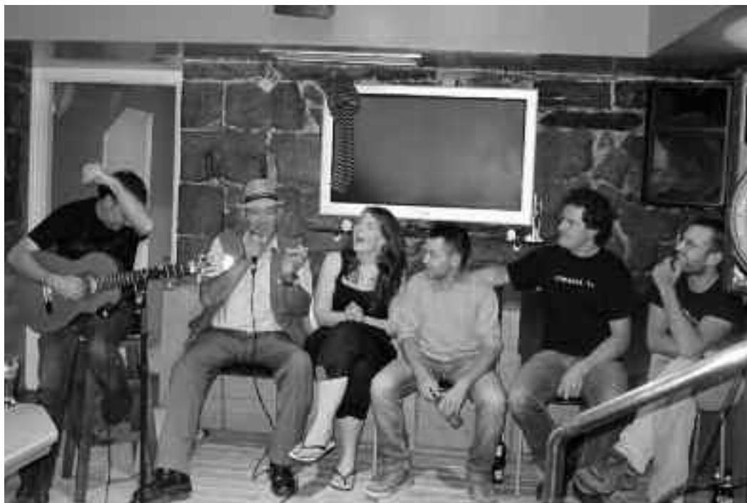
Esteve Barcelo Verderolek barre asko eragin zuen Kalakarin . KARKARA