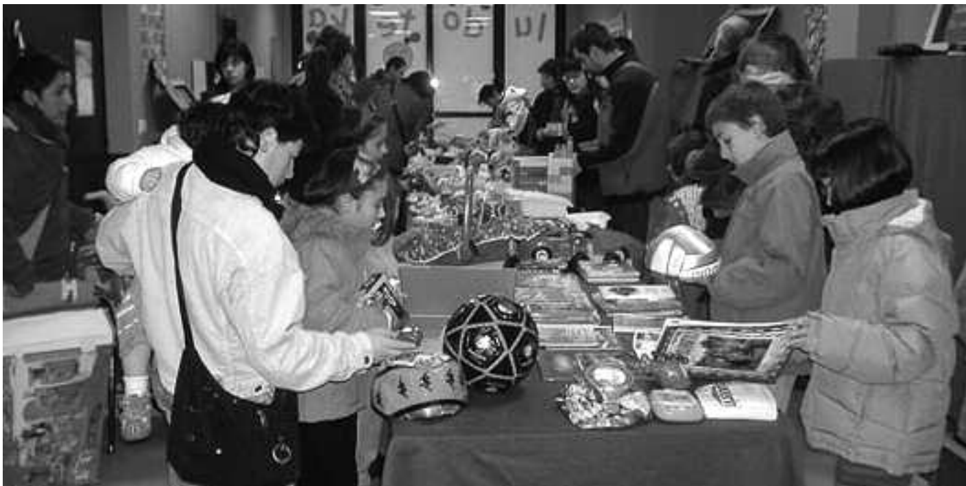
Beste hainbat eta hainbat herritan egiten dira jostailu azokak. Orion aurreneko aldia izango da. MONDRABERRI

Behin azoka bukatuta, jostailuak sobera geratuz gero, Gobernu Kanpoko Erakunde bati emango zaizkio, beste haur batzuek erabil ditzaten.