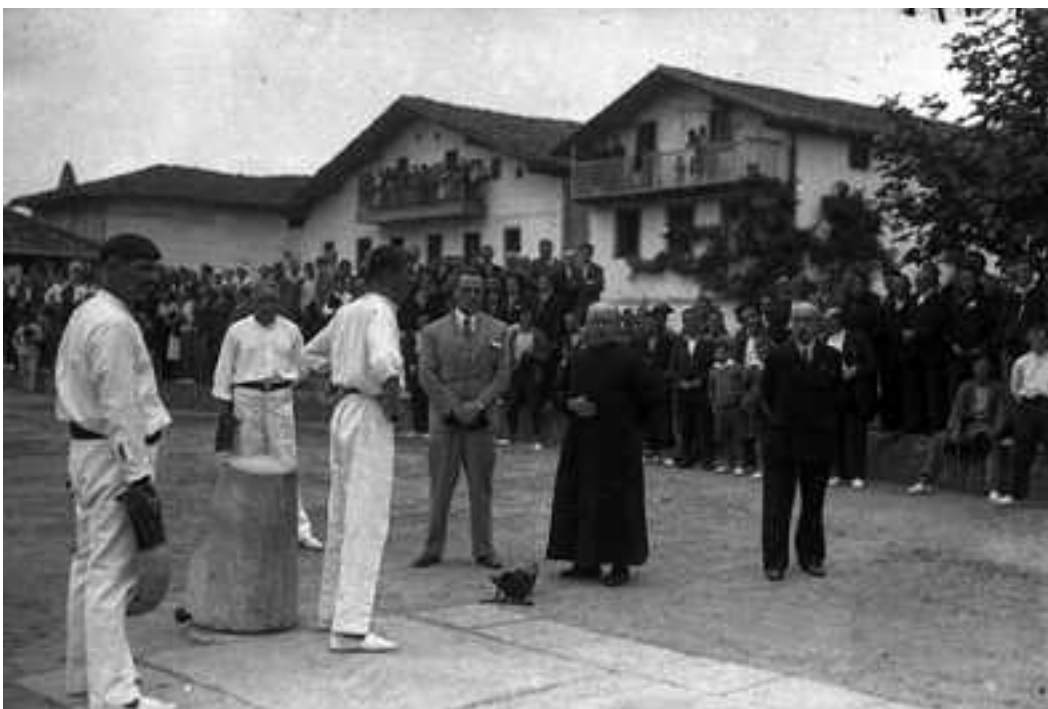
Angelusa errezatzen erreboteko partidariak Zubietan (1931-12-31).