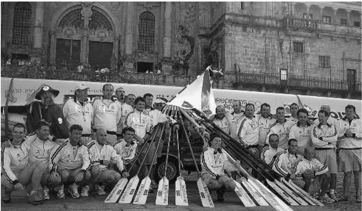
Itsasoko erromesak Santiagoko katedralaren aurrean, joaneko abentura bukatuta. ERROMESAK

Kultur etxean egingo dute Itsasoko erromesak lanaren aurkezpena Gabon festen atarian, abenduaren 23an, herritar guztientzat. Garmendiak aitortu digunez, itsasoko erromesak, behintzat, bertan izatea gustatuko litzaiokoe, egindako lana bertatik bertara ikusteko.