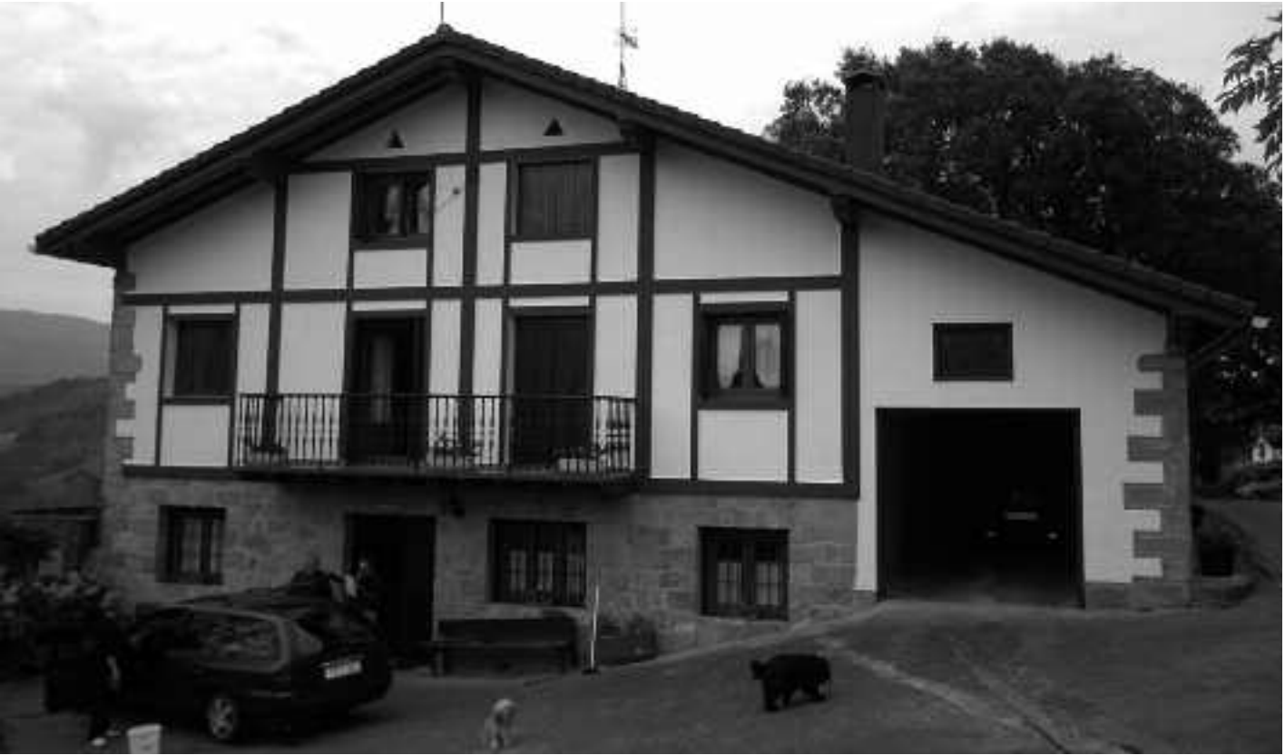
Baserriz baserri, bizilagun edo jabeekin hitz egin dute informazioa jasotzeko; Aldape baserrian ere izan ziren bisitan . ZEHAZTEN