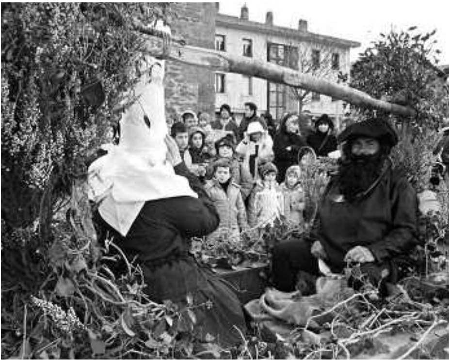
Abenduaren 22an etorriko da Olentzero gutunak jasotzera . KARKARA