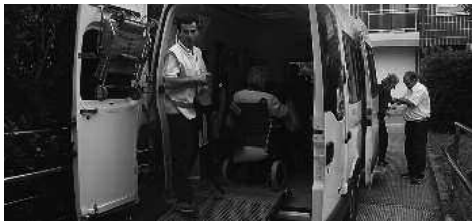
Aitona-amona gutxi batzuk oinez iristen badira ere, autobusak ekartzen ditu gehienak. KARKARA