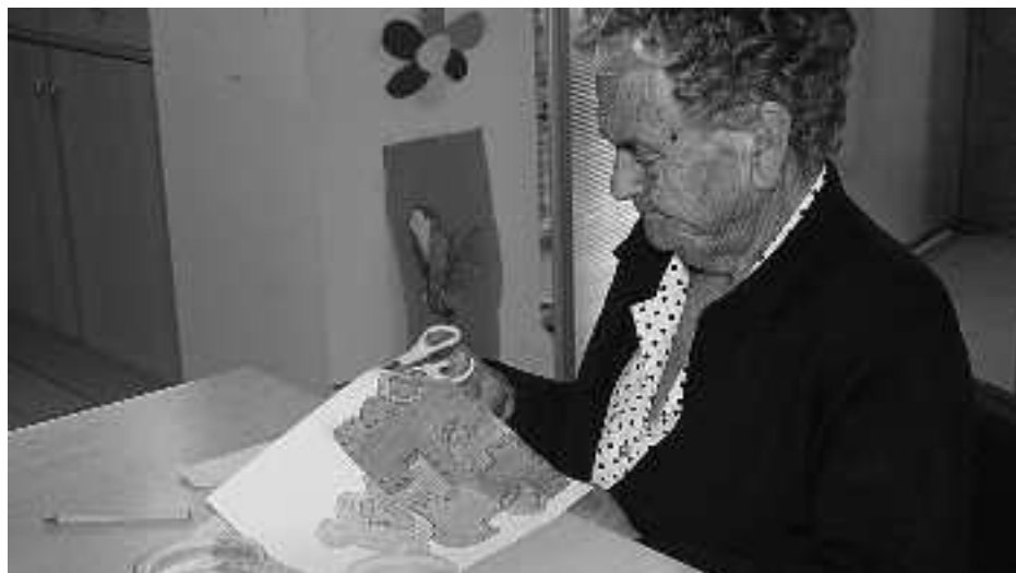
Eskulanak, matematikak, jolasak egiten dituzte, bakoitzak ahal duen neurrian. KARKARA

Egunkariak jasotakoaren berri ematen die atzetik erizain laguntzaileak.