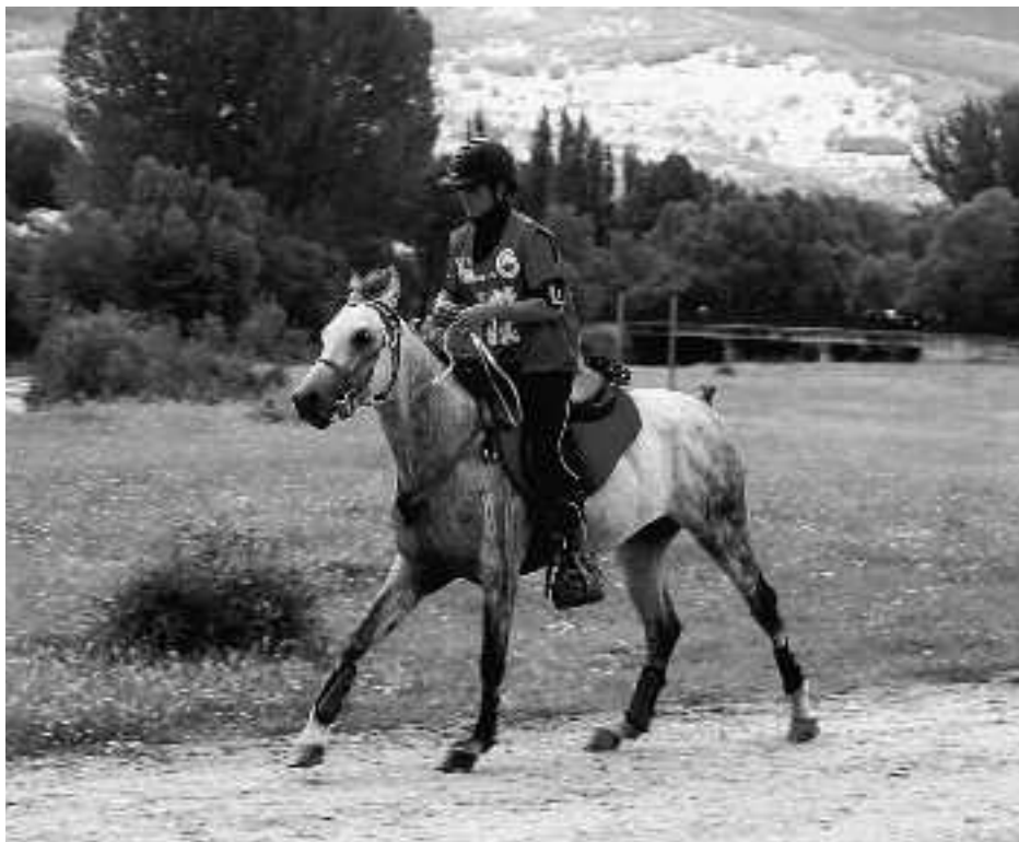
Trosta goxoan ibili beharko dute 30 zaldik, berrogei kilometroko ibilbidean. OIER ETXENIKE