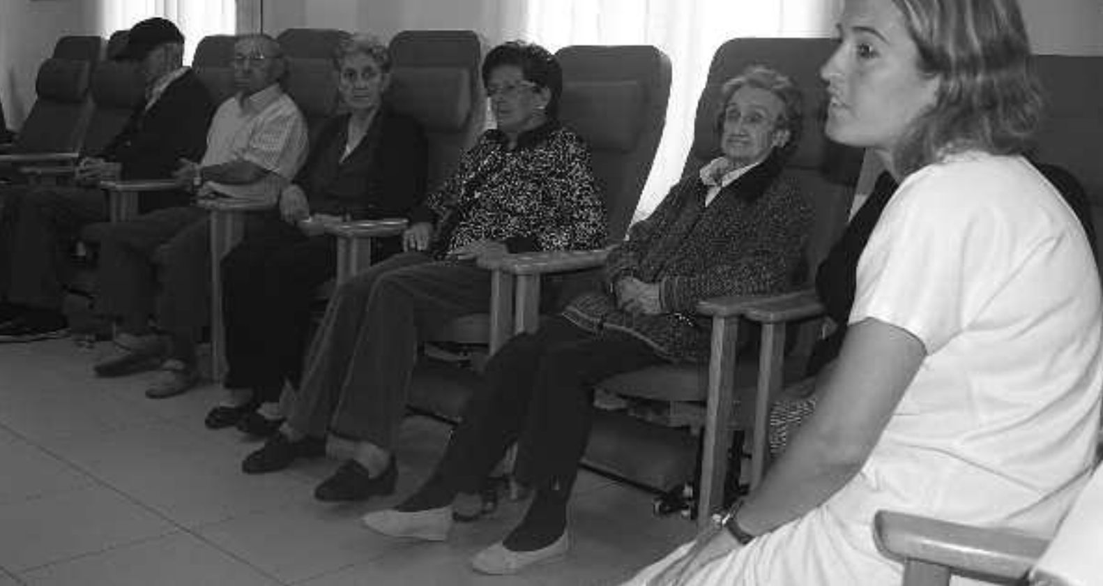
Memoria lantzeko ariketak tarte handia hartzen dute egunero; aurreko egunak emandakoa errepasatuz, datorrenari heltzen diote. KARKARA