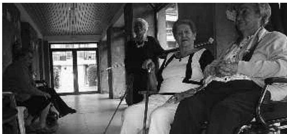
Pasiatzeko eta bisitak jasotzeko aukera ere izaten dute. KARKARA

Korrika eta presaka bizi garen jendarte honetan, haurrak eta edadetuak dira, babes gutxien dutenak. Eskoletara bidaltzen ditugu txikienak; zaharrenei, berriz, eguneko zentroetan egiten diegu lekua. Lagunartean, entretenituta eta zainduta egiten dituzte eguneko orduak, familiakoak jasotzera etorri arte