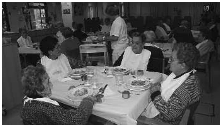
Guztiak batera, launakako mahaietan, bazkaltzen dute, 13:00etan. KARKARA

Euskaraz eta erdaraz egiten dituzte albisteei buruzko azalpenak.