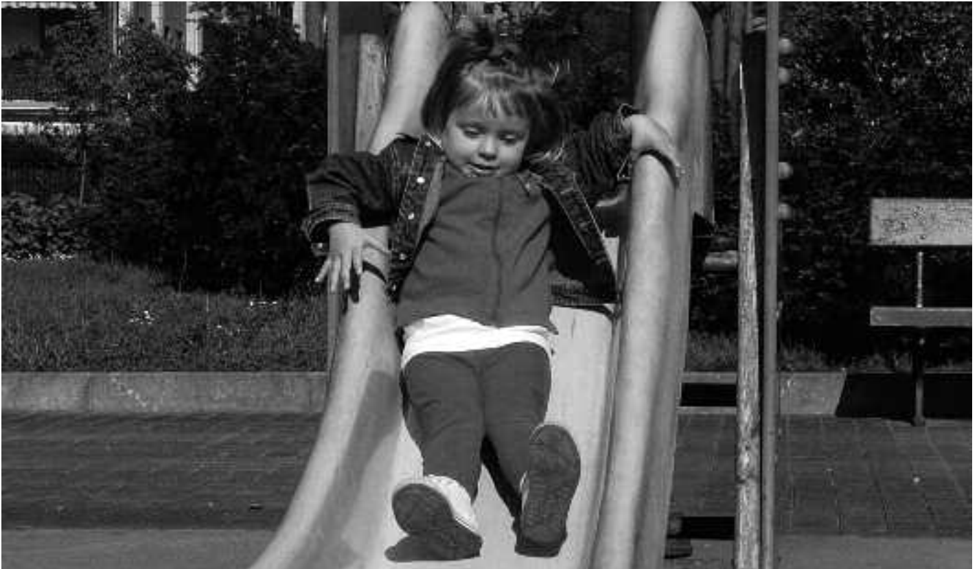
Childsplay lurra jarriko dute Baxoaldeko eta Bikamiotako parkeetan. KARKARA