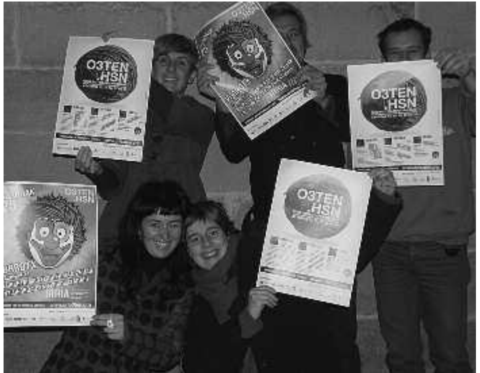
O3ten hezkuntza jardunaldien antolatzaileak kartelak eskuetan dituztela. ORIOKO INDEPENDENTISTAK

Gaur egungo hezkuntza sistemaren errealitatea izango da hizpide Euskal Herria sailean. Azkenaldian izandako aldaketak aztertu eta hezkuntza propioaren bidea egiteko beharrezko diren ele-