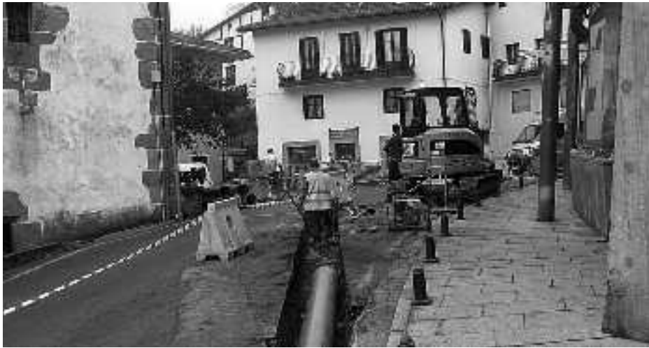
Lanak hasita daude eta abendurako bukatuta egon behar lukete. KARKARA