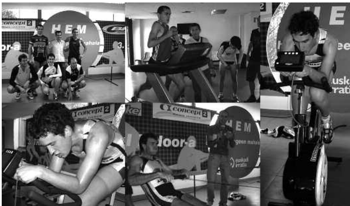
Ergometroan, bizikleta gainean eta korrika neurtu behar dituzte indarrak trindoorrean. HIRU ERREGEEN MAHAIA

Ohorea ez ezik, irabazleentzat opari bereziak ere izango dira jokoan: goi mailako bizikleta, ordenagailuak eta GPSak, besteak beste.