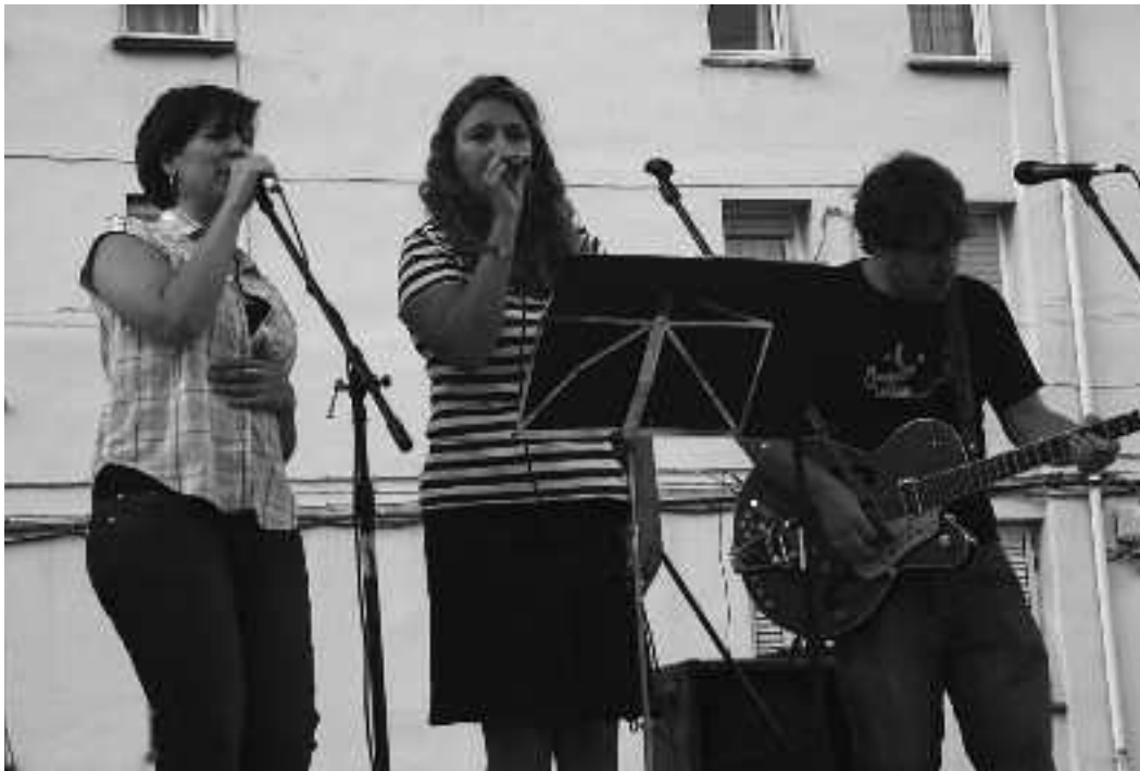
Orioko stock azokan kontzertua eskaini zuen Azkaiter Pelox &amp; the Road band taldeak. KARKARA