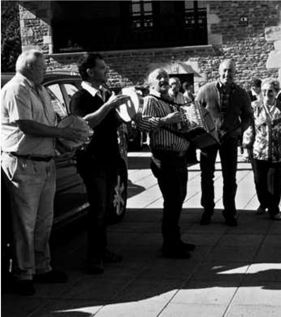
Irailaren 29an, San Migel egunean, hasi zituzten jaiak Laurgainen. KARKARA

Irailaren 29an hasi ziren jaiak, txupinarekin, eta urriaren 3an, ordu txikietan, bukatuko dira, Tapia eta Leturia eta Ostolaza trikitilarien erromeria doinuekin