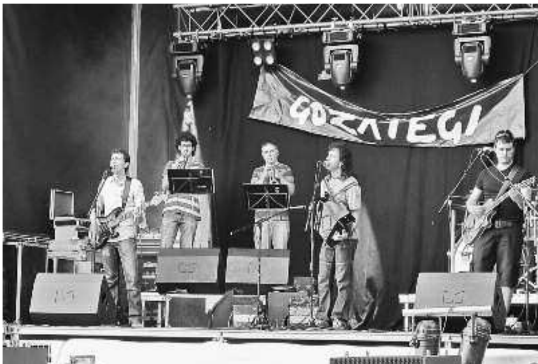
Disko berria plazako eszenatokian aurkeztu zuen Gozategi taldeak Orioko San Pedro festetan.