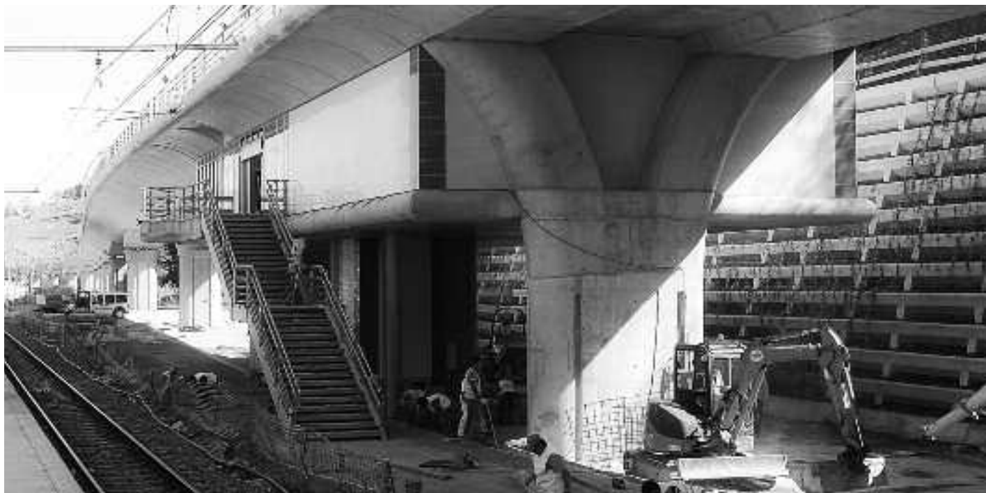
Tren geltoki berria ireki aurretik egin beharreko azken lanetan ari dira langileak. KARKARA

Lan guztien bukaera, berriaz, datorren urteko martxorako iragarri dute.