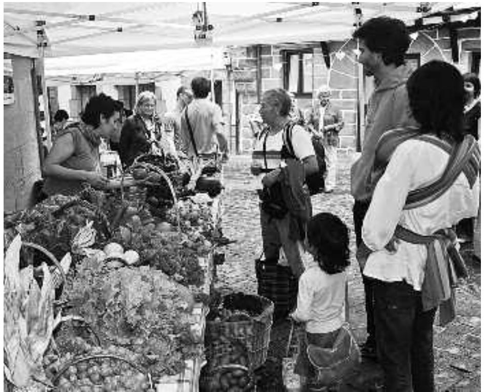
Iaz egin zen lehen aldiz azoka eta zapore ona utzi zien antolatzaileei. KARKARA

Eguna eta herritar nahiz bisitariak girotzeko eta alaitzeko musikariak ere ari-tuko dira kalez kale, goizez.