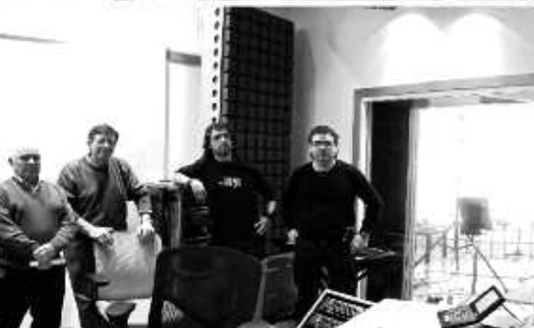
BALEA MUSIKA IDEIAK

Zuzenekoa kaleratzeko aukera beti hor dago, Grandes éxitos deitzen zaiona ere bai, baina zenbat eta gehiago atzeratu, orduan eta aberatsagoak izango dira, noizbait egiten badira, jakina.