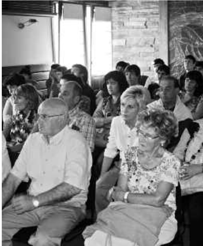
Gai bategatik edo besteagatik, ikusmin handia sortu zuen bilkurak.