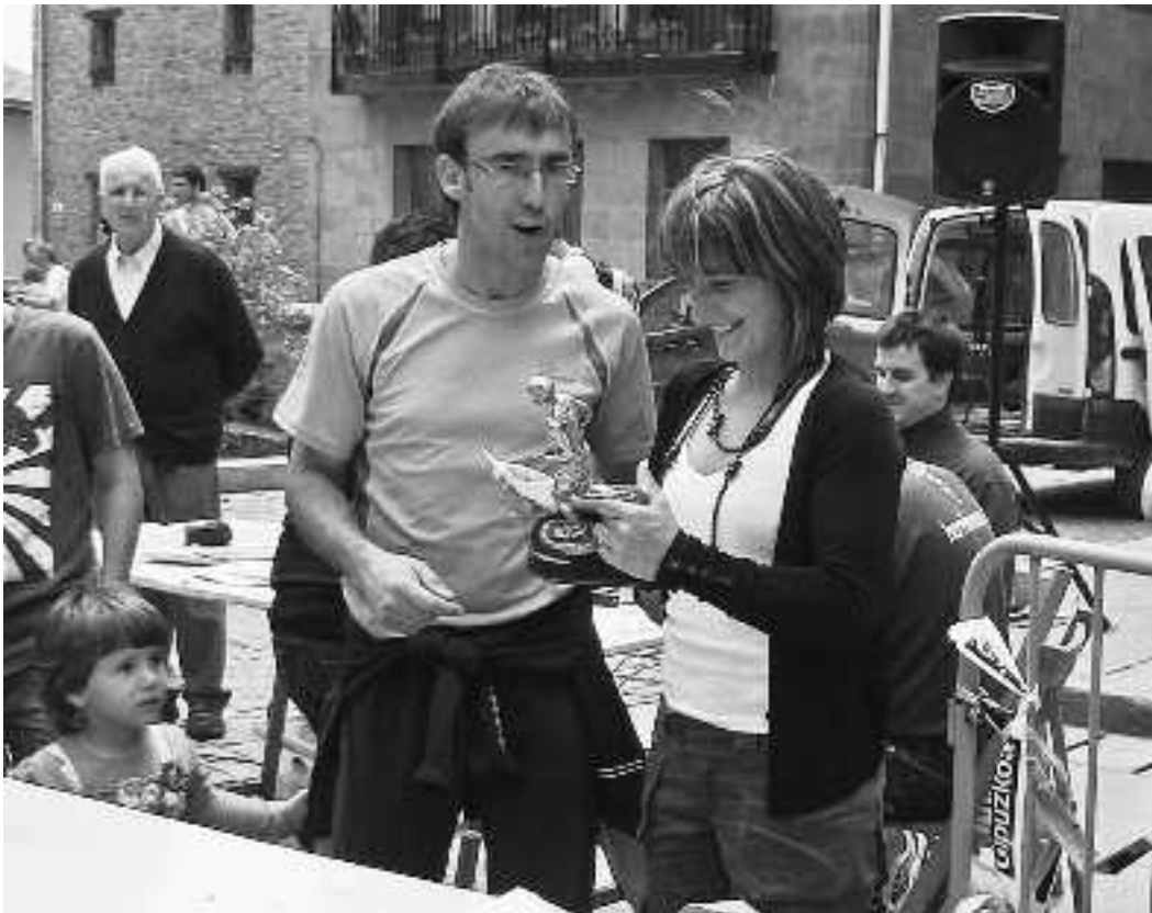
KARKARA inprentara bidaltzeko orduan 2 aiarrek eta oriotar bakarrak eman dute lasterketan aritzeko izena.