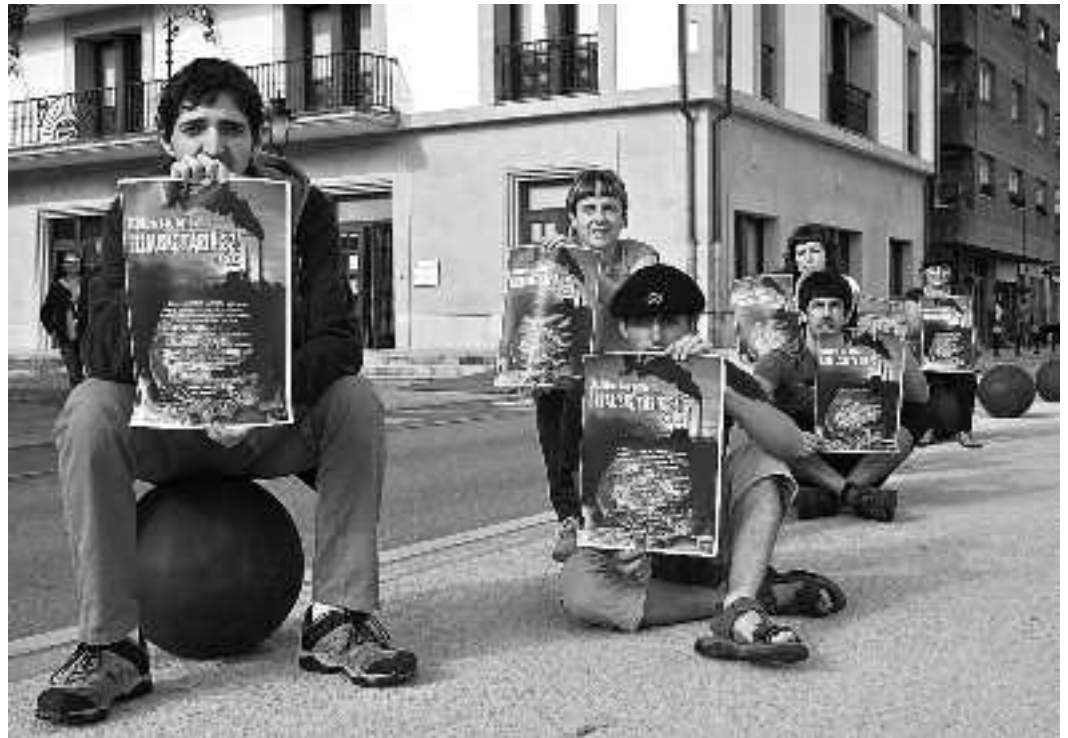
Orioko Errausketaren Aurkako Taldeko batzuk, Errausketarik ez eguneko kartelak eskuan dituztela.

Hamaiketakoaren txanda izango da gero, Herriko Plazan, 12:00etan. Ordu berean hasi eta eguna bukatu arte ikuskizun eta informazio gunea ere izango da plazan