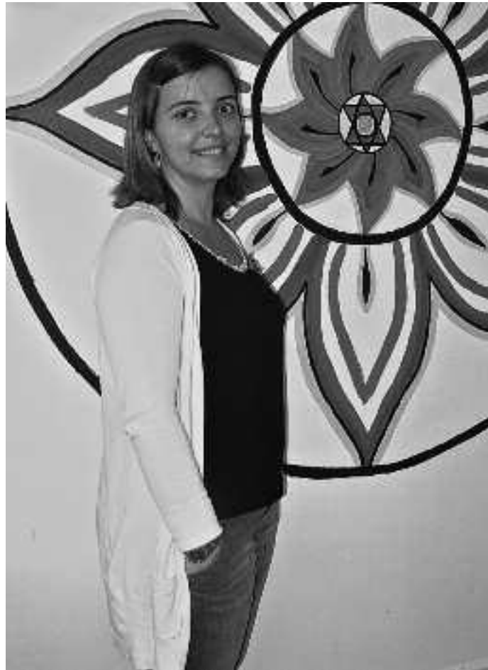
Karmelek berak margotutako mandalaren aurrean.

Lau zatitan banatuta dago zirkulua eta non eta nola margotzen den, esanahi ezberdina du, zati horietako bakoitzak garuneko zati bat ordezkatzen baitu. Erabiltzen diren koloreak, tonuak, geometriko formak... denak du zentzua. Azken finean, norberaren oreka aurkitzen, lasaitzen eta erlaxatzen laguntzen du