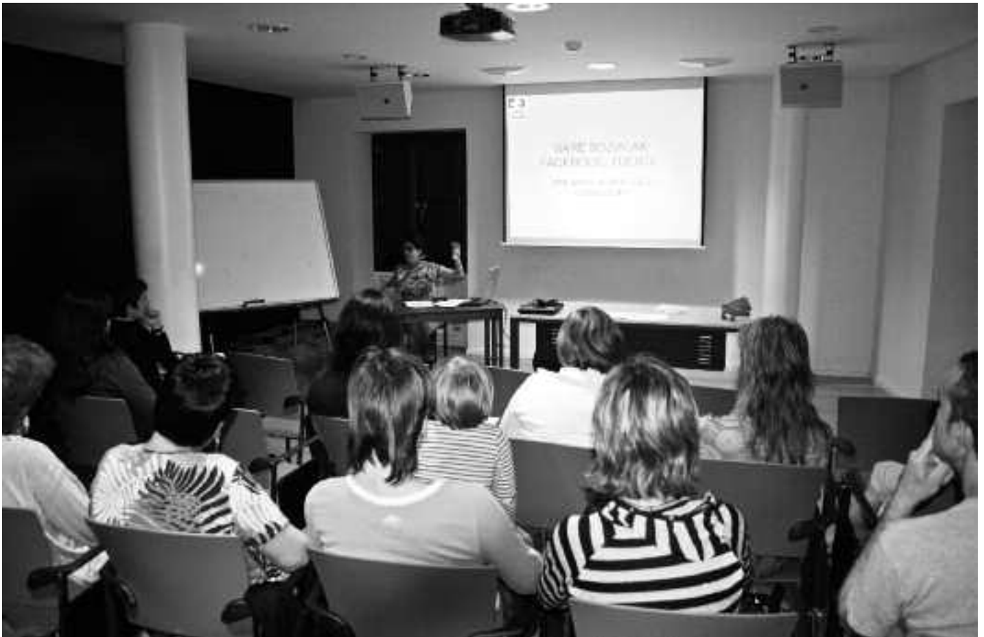
Galdera erantzunen joan-etorria etengabekoa izan zen hitzaldiak iraun zuen ordu eta laurdenean.