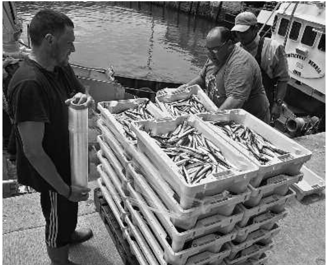
Montserrat Berria baporekoak, harrapatutako antxoak lehorreratzten, Getariako portuan.

Adierazpenaren sustatzaileek erabilitako formekin ere ez dago konforme: Prensa ohar baten bidez jakin