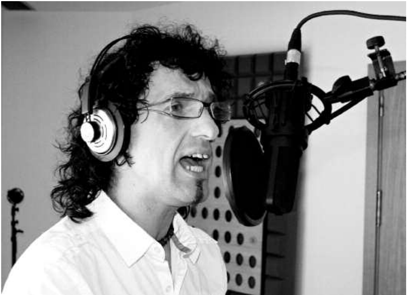
Gogo biziz hartu dute Gozategi taldekoek beren disko berriaren grabaketa.