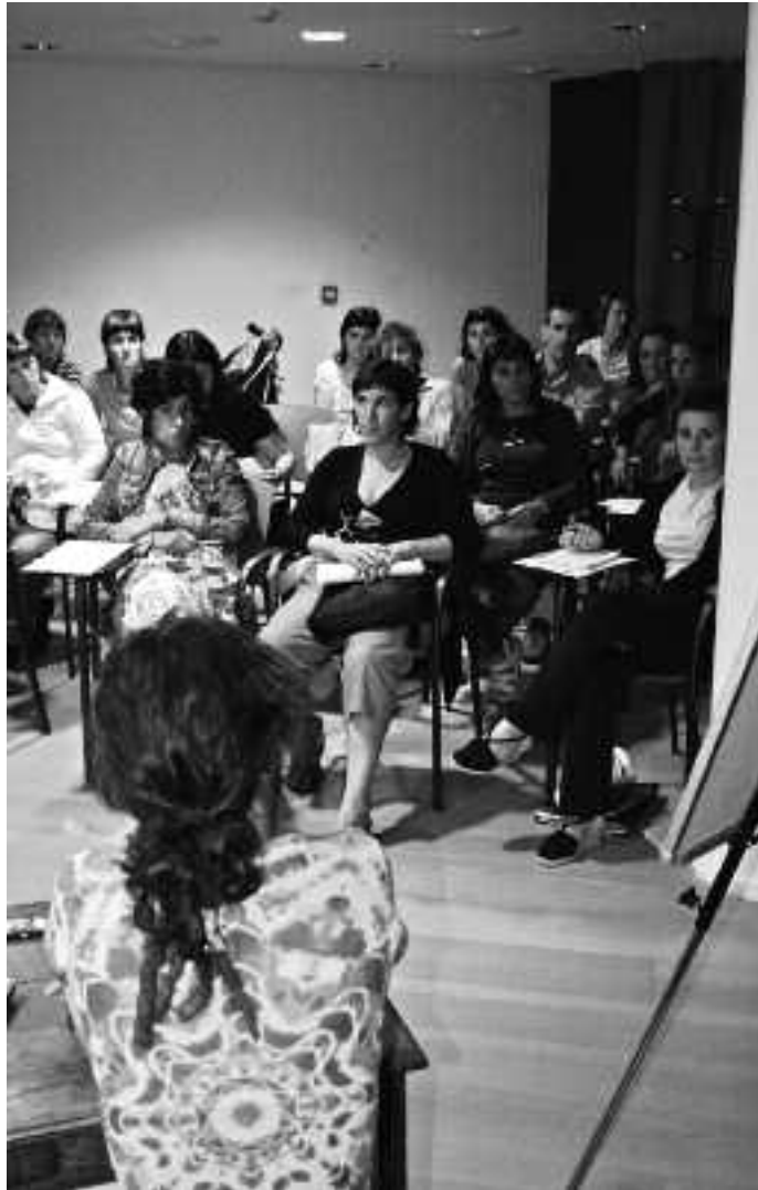
Gehienak amak baziren ere, tartean agertu zen aitaren bat ere.