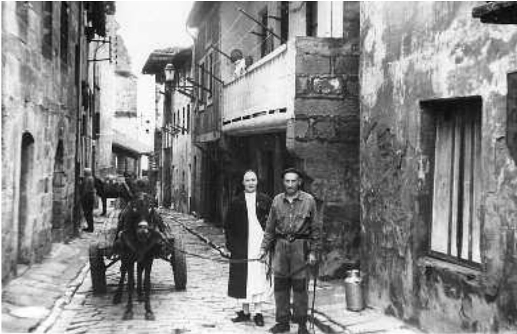
Garai horretan nekazaritzak eta elizak presentzia handia zuten oriotarren bizitzan.