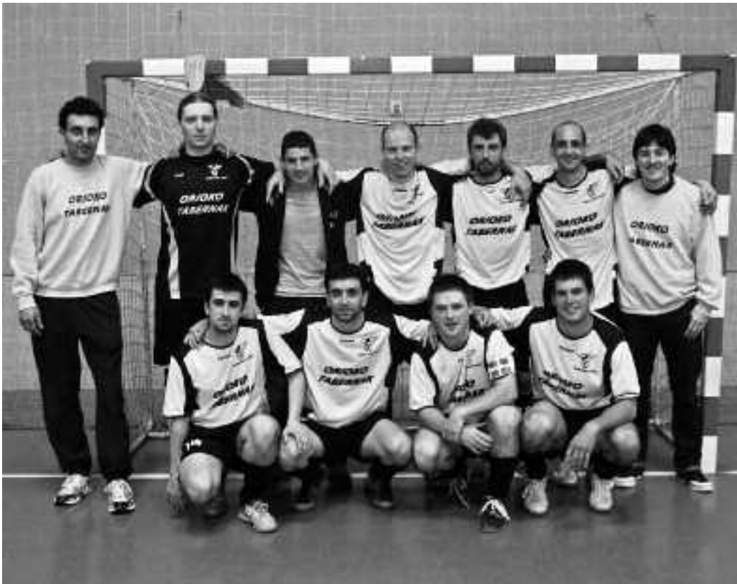
Taldekideak pozik ageri dira etxeko azken partida irabazi eta gero.