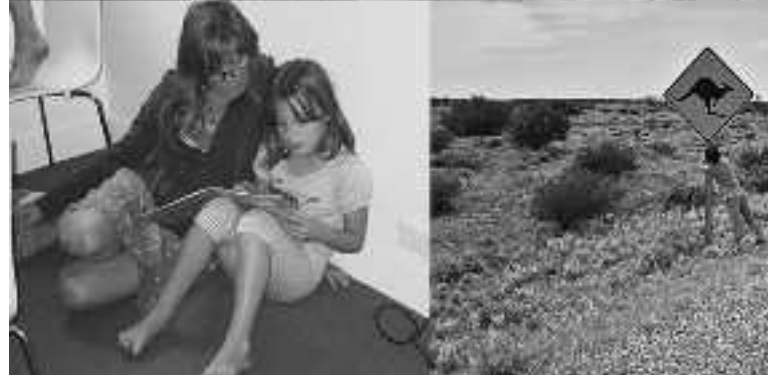
Australian eta Tasmanian ateratako argazki batzuk: Uluru, koalak, autokarabana, baso izu...

Hiriak kuriosoak dira, baina ez ederrak, historia falta zaielako, azken 200 urteetan kontrolik gabe eraiki direlako. Ez dute alde zaharrik, erakuntzek koktel bat dirudite. Sidney, ordea, bada polita, eta lorategi botaniko ederra du.