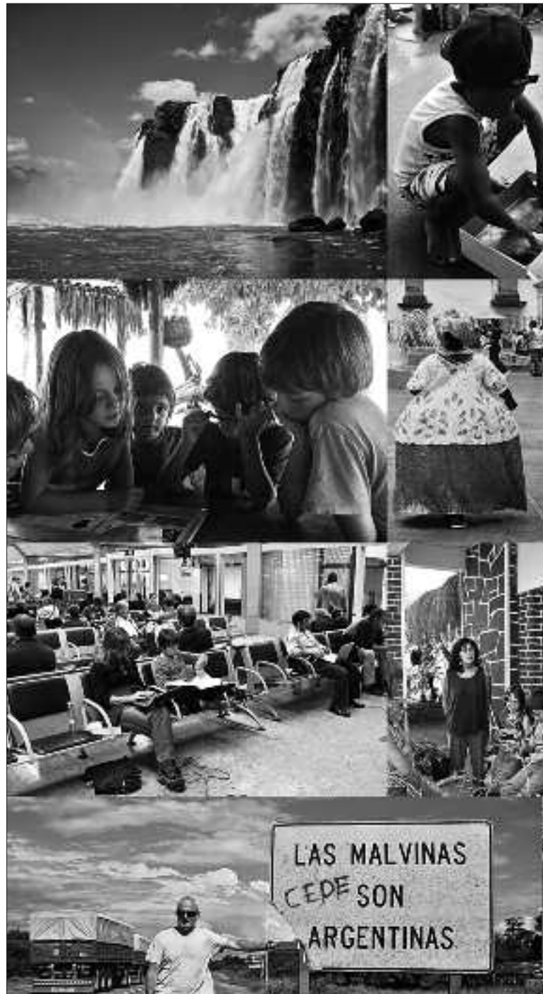
Brasilen eta Argentinan kontraste handiak aurkitu zituzten.

O: Gutxi gorabehera, Argentina Euskal Herria baino 5 aldiz merkeagoa da, eta Brasil, ostera, 2 aldiz merkeagoa hau baino. Australian ekonomia aurreratua dute, Argentinan klase ertain txirotua eta Brasilen dirudunak eta pobreak, kontraste handia eta bortitza.