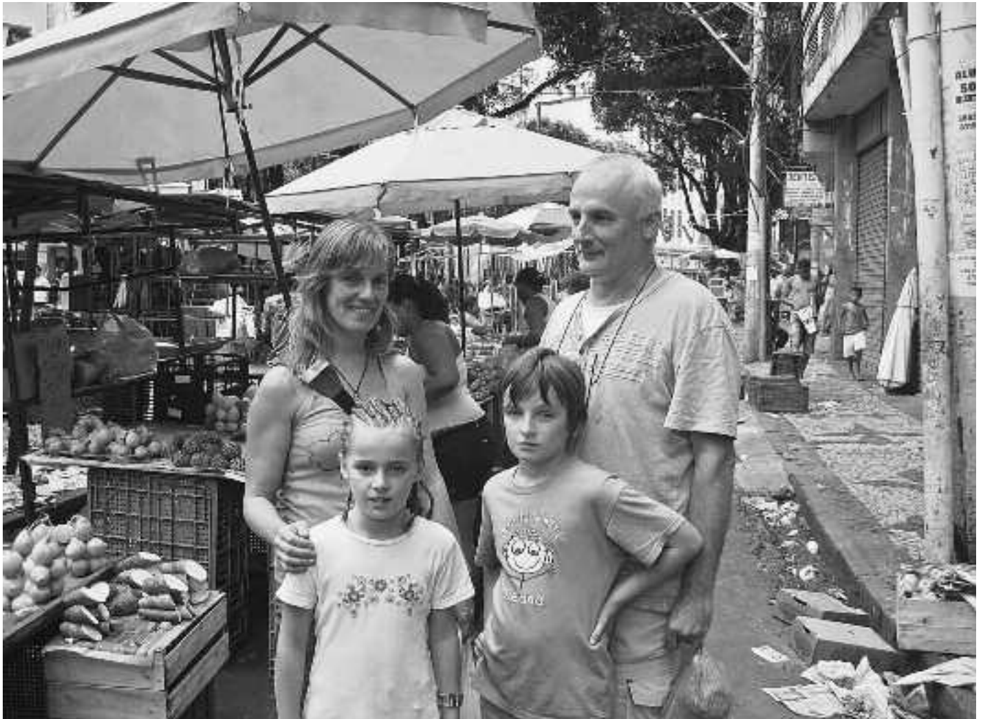
Bizilekua Aian duten arren, munduan barrena asko ibilitakoa da familia hau.