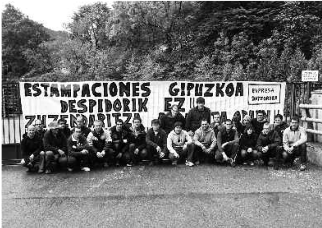
Kaleratuak berriz hartuko ez dituzten arren, lanerako baldintza hobekak lortu dituzte grebarekin langileek.