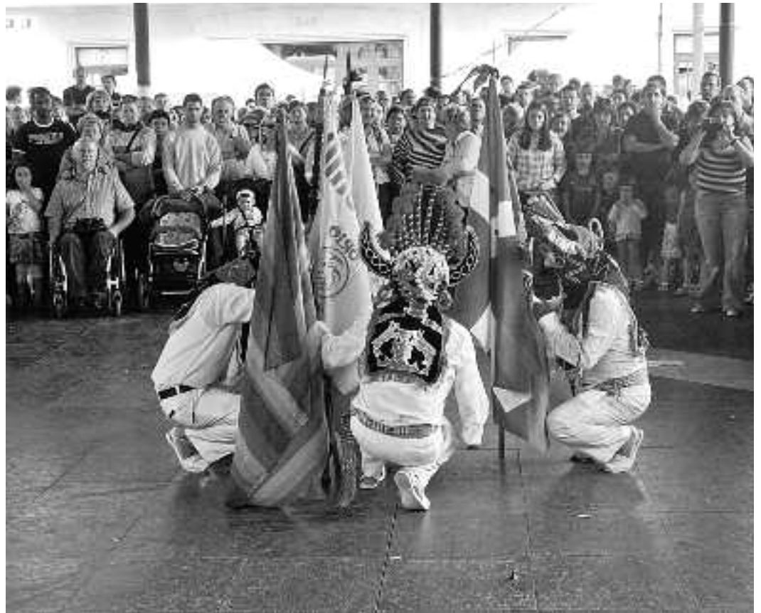
Mundu zabaleko musikak eta dantzak izango dira ikusgai eta entzungai datorren asteko larunbatean.

Gu, Afrikan, Amerikan, Asian edo European jaiotako oriotarrak, gaurko festak batu gaituen herritarrak... hitz horiekin hasiko da Kultur Aniztasunaren Asteko izana jasotzen duen adierazpena, maiatzaren 29an irakurriko dena. Iazko lehen edizioan ez bezala, astebe hartuko du aurten go jaiak, hilaren 26an hasi eta 30arekin, Kukuarri egunarekin, bukatuz. Hala ere, festa giroa hartzen joateko, hasiak daude munduko sukaldaritza ikastaroarekin. Hiru saio egin dituzte, dagoeneko, eta beste bat dute oraindik. 17 lagun aritu dira Mexikoko, Nikaraguako eta Portugalgo jakiak prestatu eta dastatzen. Datorren astean Brasilen txanda izango da.