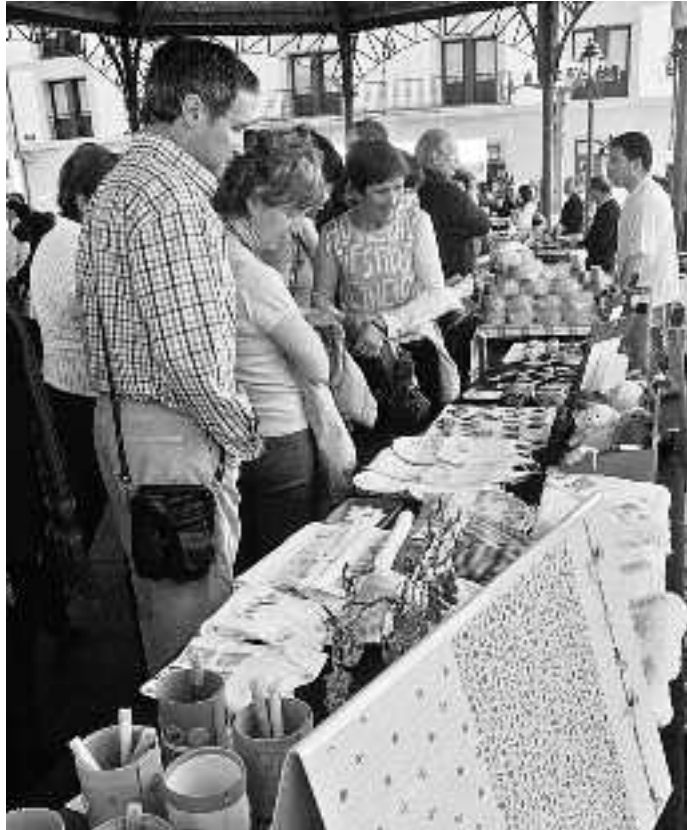
Tailerrek izango dute garrantzia aurtengo edizioan.

Urtero bezala, azoka balea harrapatu zeneko urteurrenaren inguruan egiten denez, arrantza eta itsasoko gaiekin apainduko dituzte kaleak. Aurtan, ordea, ez da azoka bakarrik izango, bestelako ekitaldiak ere antolatu baitira, eguna osatzeko: kale antzerkia eta pilota partidak.