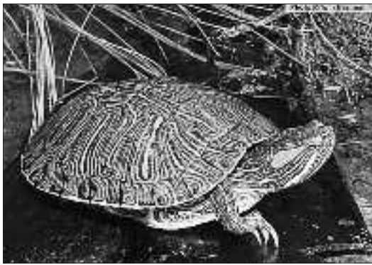
Floridako dortoka ( Trachemys scripta ). TOM BRENNAN