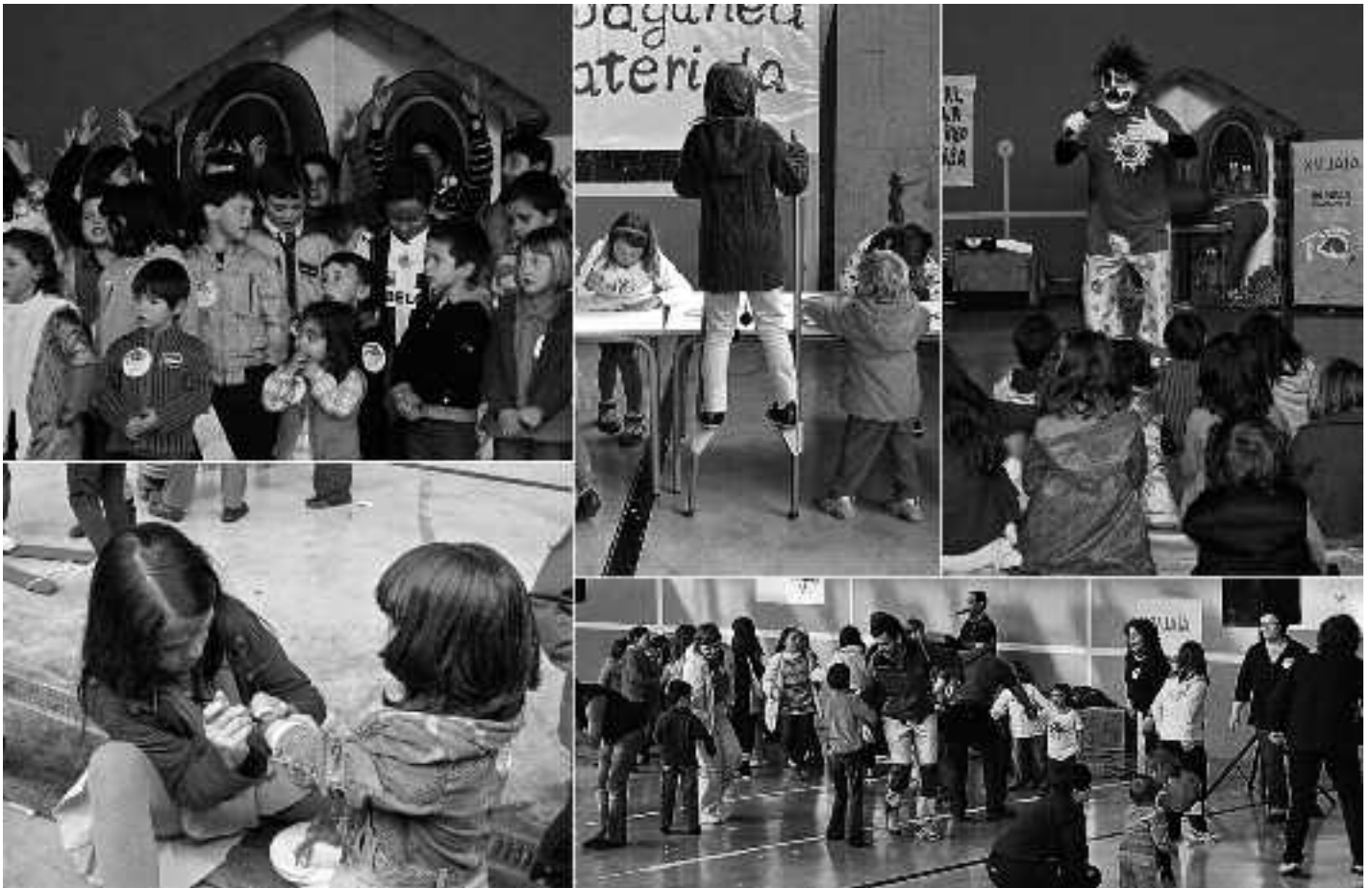
Sortzen-Ikasbatuazek antolatutako festan Gipuzkoako eskoletako eta Lardizabaleko hainbat ikasle, guraso eta irakasle elkartu ziren gozatzeko asmoz.