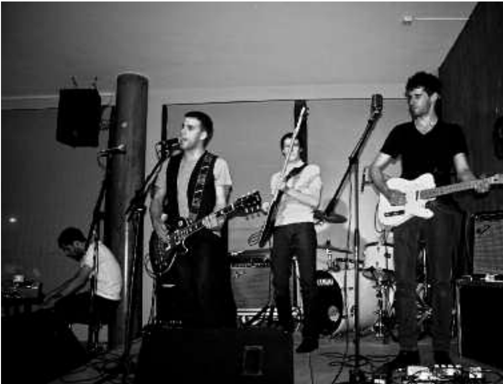
Malenkonia taldeak kontzertu ederra eman zuen apirilaren 30ean hondartzako Txalupa musika antzokian.