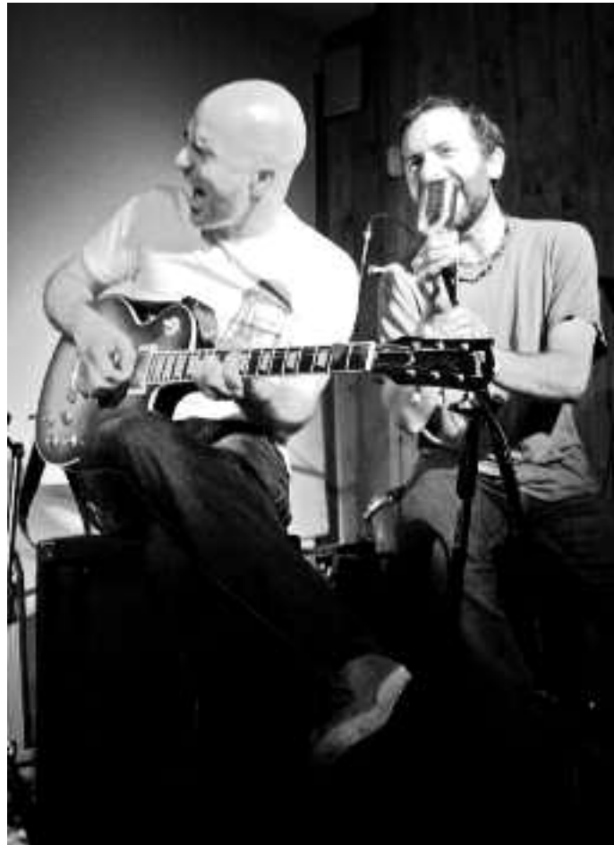
Uda partean geldialdia egin eta urrian hasiko dira berriz, kontzertuekin. KARKARA

X: Horrez gain, datak finkatu beharra zegoen. Maiztean otorduak ematen ditugu eta horrek asko zailtzen du kontzertuaren prestaketa. Ezin da arratsaldean soinu probarik egin, kontzertua has-tear delako bezeroak ezin dira mahaitik altxarazi... beraz,