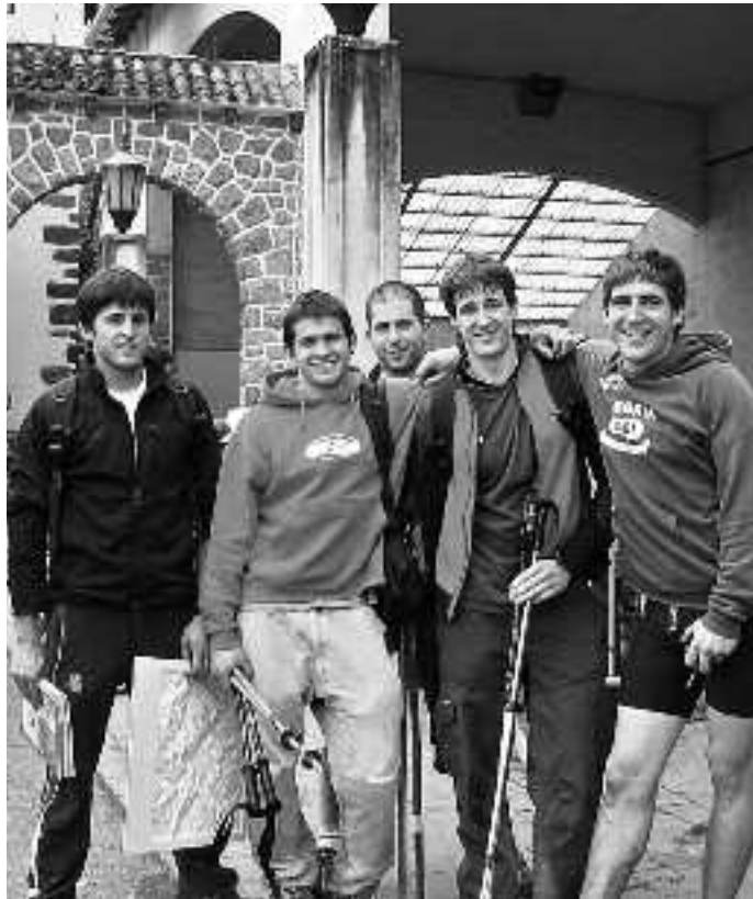
Aiako eta Orioko 19 lagunek eman dute izena, oraingoan.

Tolosaldeko bailara izango dute helmuga ondoren; Hernialde, hain zuzen ere.