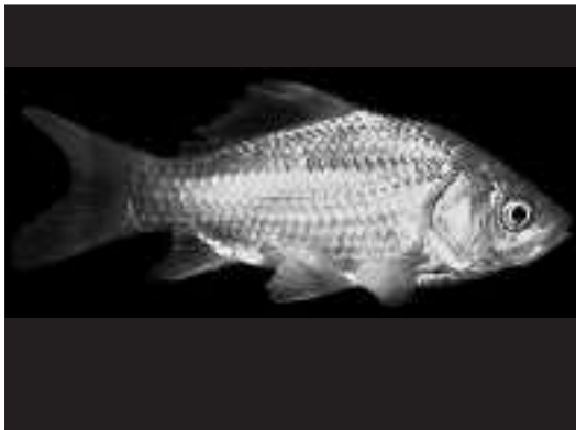
Karpina ( Carassius auratus ). HTTP://FL.BIOLOGY.USQS.GOV