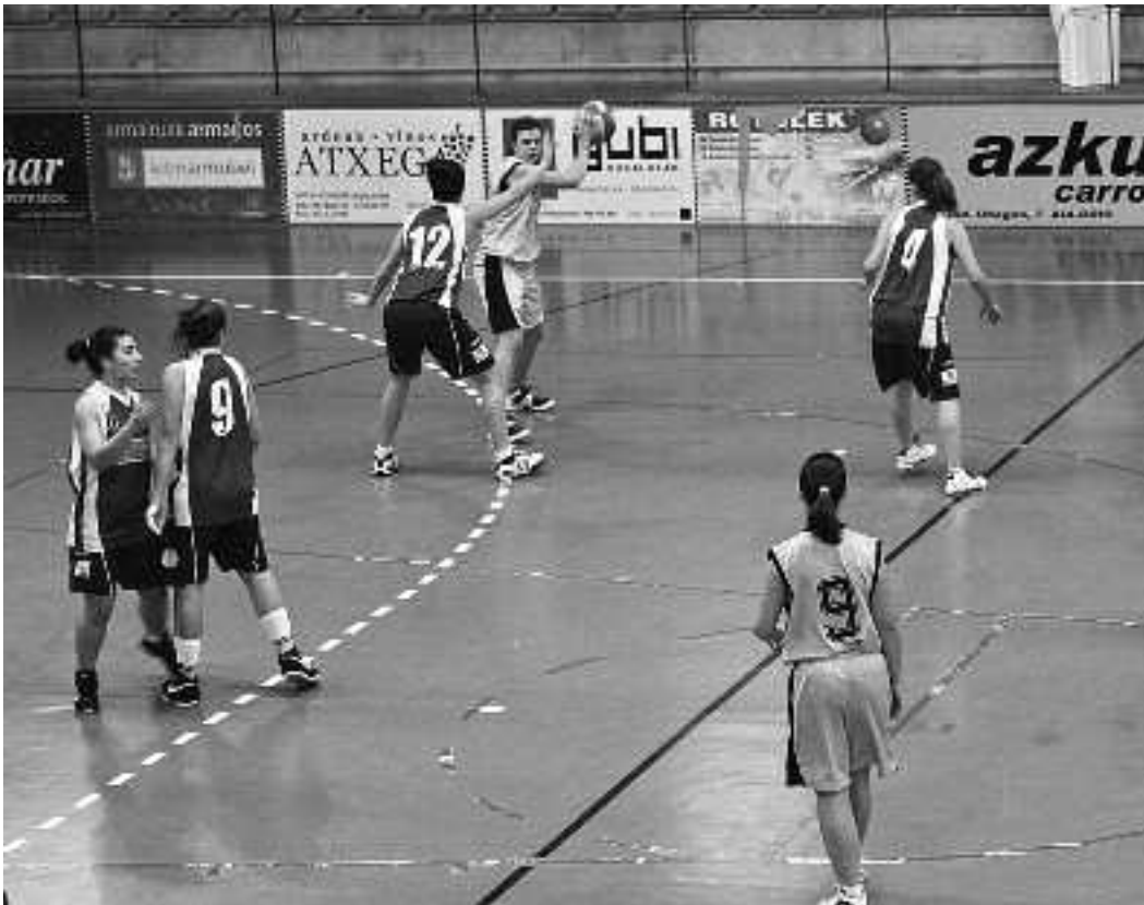
Saskibaloian federatutako taldeak ere bukatu du aurtengo denboraldia.