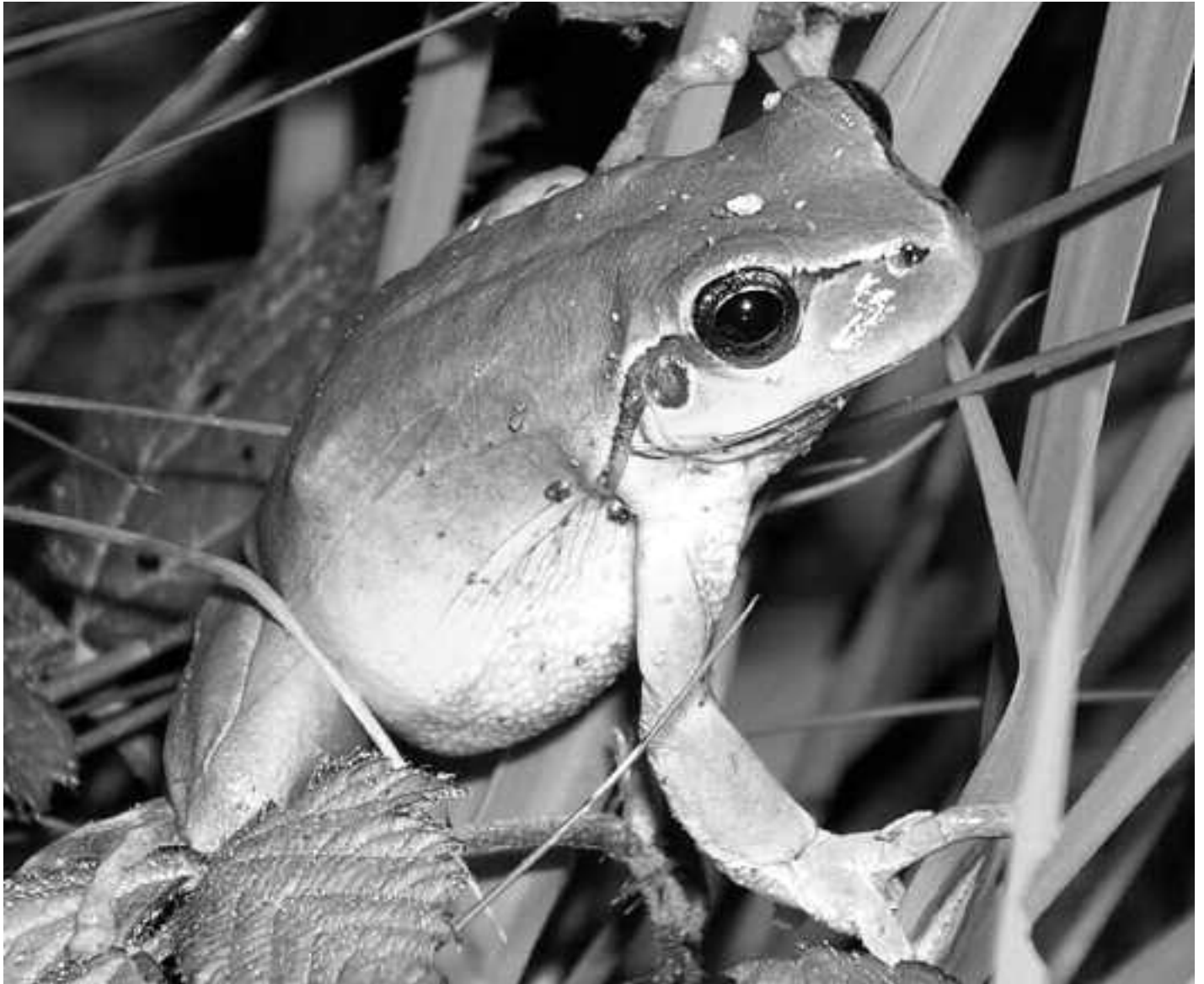
Bereziak ditu ezaugarriak gure igeltxoak: marra beltza du begietatik aurreko hanketaraino eta zuhaitzetan ibiltzeko behatetako disko itsaskorrek.