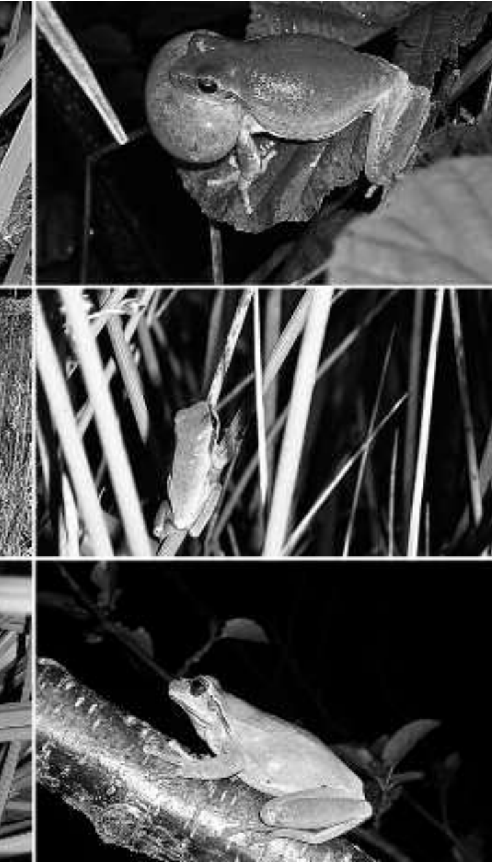
HERRIO NATUR TALDEA ETA XABI RUBIO