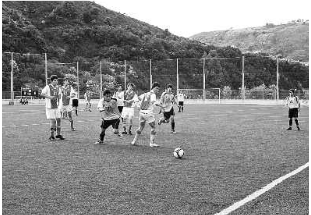
Lesakako Beti Gazte taldearen aurka aritu ziren jubentilak maiatzaren 1ean. 0-4 galdu zuten.

Jubenilek ere zaleen laguntza beharko dute zulotik ateratzeko. Jaitziera postuetan daude, 11., eta indarrak hartu beharko dituzte datozen norgehiagokak irabazteko,