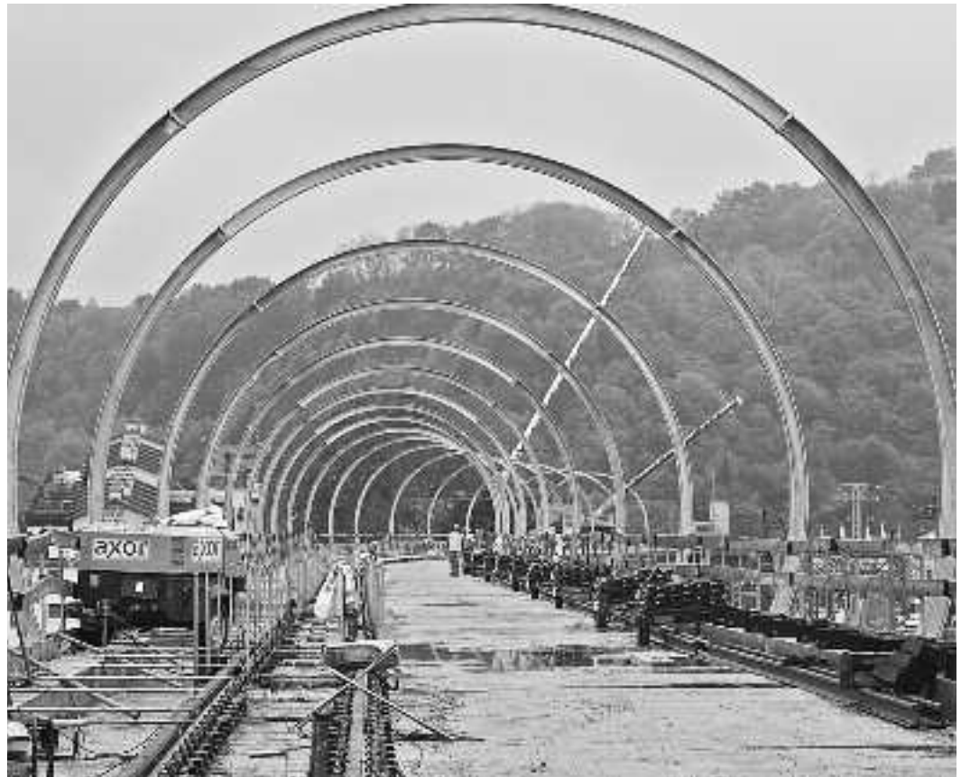
Lurraren gainetik ia 10 metrora joango da trena Aiako eta Orioko geltoki berrian jendea hartu eta uzteko.

Tren geltokiaren aurrean biribilgunea egiteko Oriai ibaiari lekua jan behar izan diotela eta, Itsasbazerretako eta Kos-