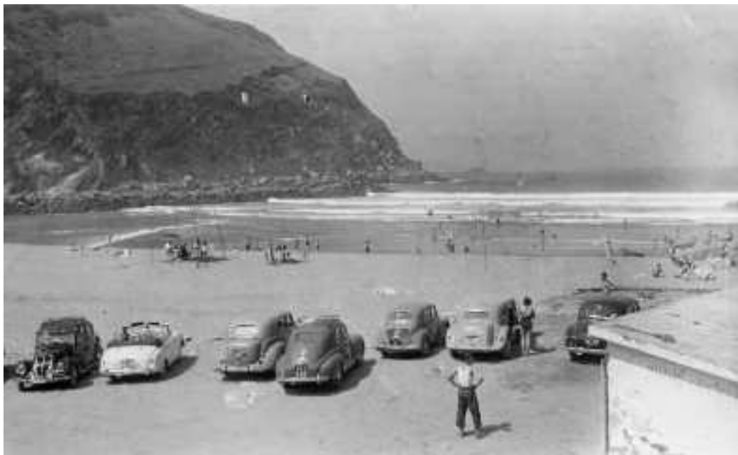
Horrelakoxea zen hondartza garai hartan, horrelakoxeak, automobilak.