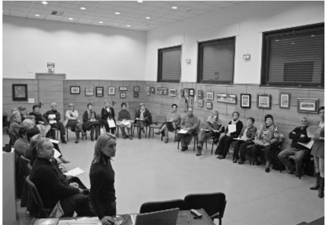
Lehen eskolak kultur etxean egin dituzte baina ikastolara igaroko dira laister.

Hizketan azkenak ikasle ohiak izan ziren, eta berriz errepikatzeko gogoia zutela eta kurtso berria hasteko desiatzen zeudela esan zuten.