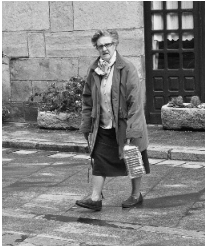
Otsailerako antolatu nahi da ikastaroa Aian.