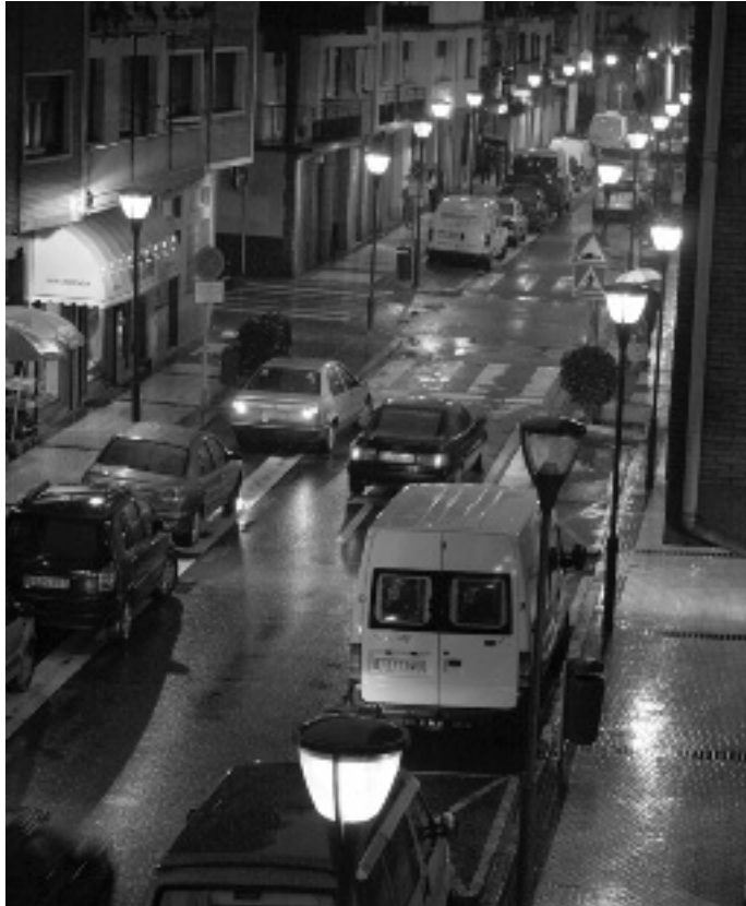
Eguraldi txarragatik gertatu omen zen itzalaldia eragin zuen txinparta. KARKARA

Ez da lehenengo aldia gertatzen dela aurten, gainera, eta haserrea sortu zuen herrian. Halako orduan gertatuta, jen-