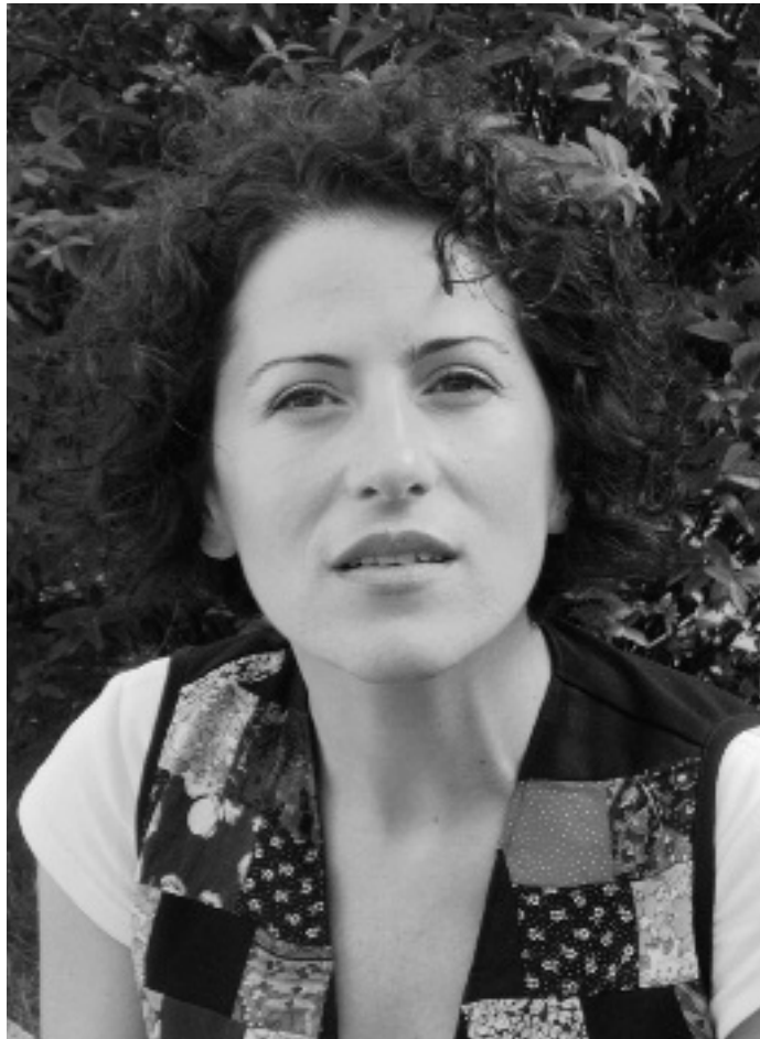
Martak dio ez dela artista, baina sorkuntzak nahitaez harrapatu du.

Animatu egiten nauelako sortzen jarraitzeko. Lehiaketa edo erakusketa baterako finalista edo aukeratua izateak badu garrantzia, ezagutzen ez nautenek estimatu baitute nire lana. Erraztasuna ematen badidate obra sortzeko, eta premia dirutan eman, lan egiteko modu bat bada. Irabaziz gero, zer esanik ez! Udan lehenengo saria irabazi nuen alfonbra baten diseinuagatik, nazioarteko Carpetvista lehiaketan. Orain fabrikatuko dute eta horrek bete egiten nau. Beti hobetu