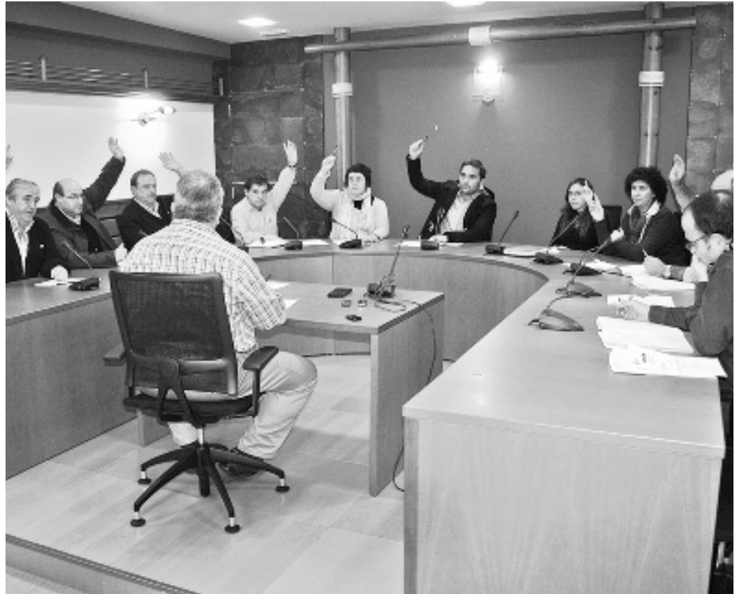
2010eko urtarrilaren 1ean jarriko dira indarrean zerga eta tasa berriak.

Orain dela gutxi martxan jarri den Iturriaga jauregiko Donejakue Bidearen inter-