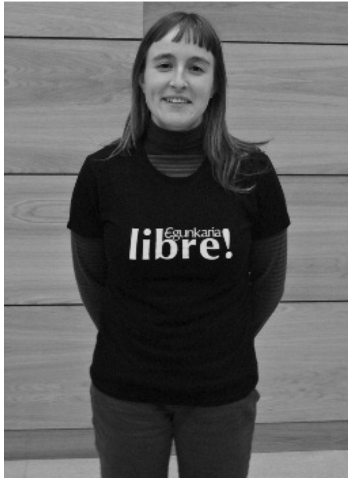
Idurre Egunkariaren aldeko Orioko batzordean ari da lanean.

Horixe baietz, Gaztesarearen aurkako operazioan asko nabarmendu zen hori.