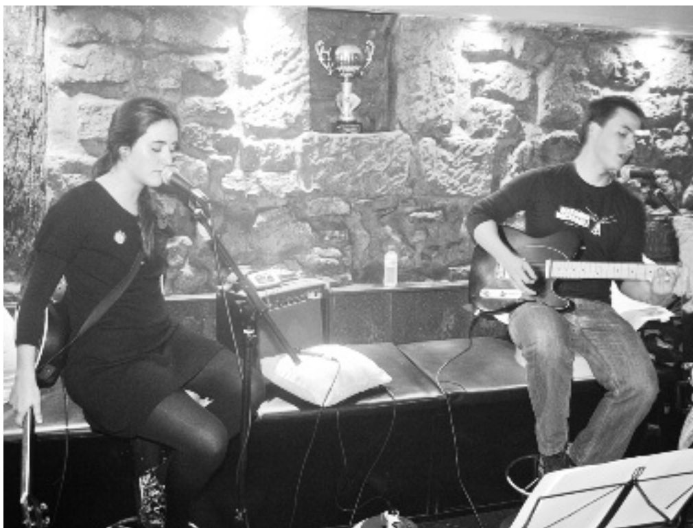
Azaroaren 6an, Napoka Iriak bigarrenez jo zuen Orion.