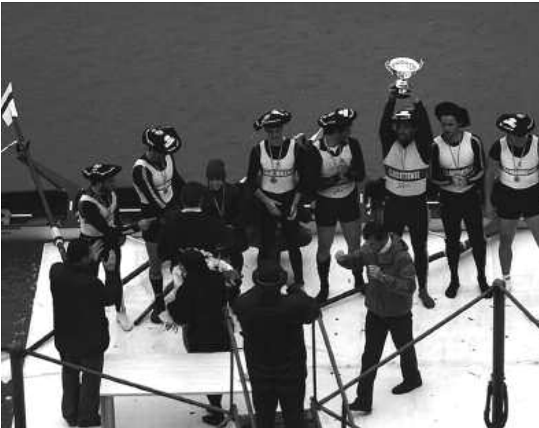
Sporting Club Caminhense taldekoak izan ziren iaz txapeldun.