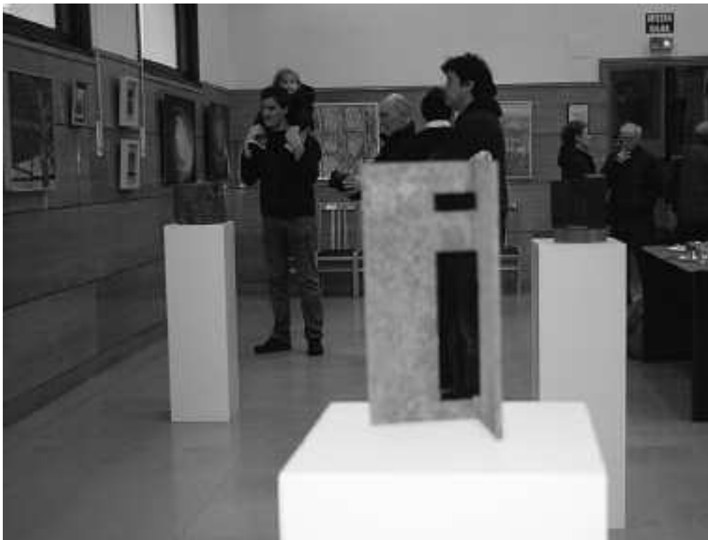
Apirilaren 30a arte egongo da zabalik artista askoren lanekin osatutako Oteizaren inguruko erakusketa.