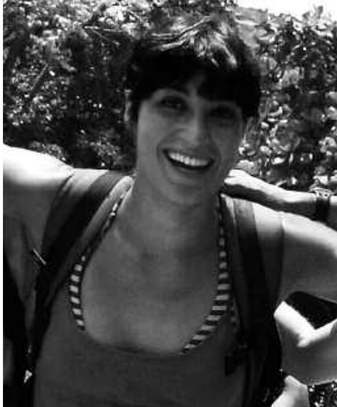
Autoarekin istripua izan ondoren atxilotu zuten, nonbait, Itxaso.

Apirilaren 16an, Legorbururen senideek Gasteizen duten etxea eta Aiztogile kaleko Garraxi taberna miatu zituen Guardia Zibilak. Egun horretan bertan, iluntzean hasi eta,