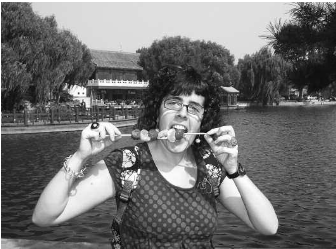
Hou Hai parkean gauza berriak probatzen.