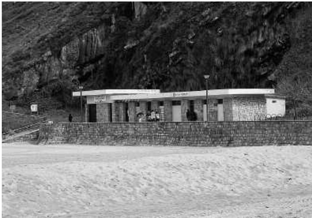
Ekainaren 6an hasiko da hondartzak zaintzen lehiaketako irabazlea.

Kontratuaren behin-behineko adjudikaziodunak hartutako konpromisoak beteko dituela bermatzeko, adjudikazioaren zenbatekoaren %5 eman behar du berme gisa eta irabazlea zein den jakiten den unetik kontatuta, 15 eguneko epea izango du horretarako.