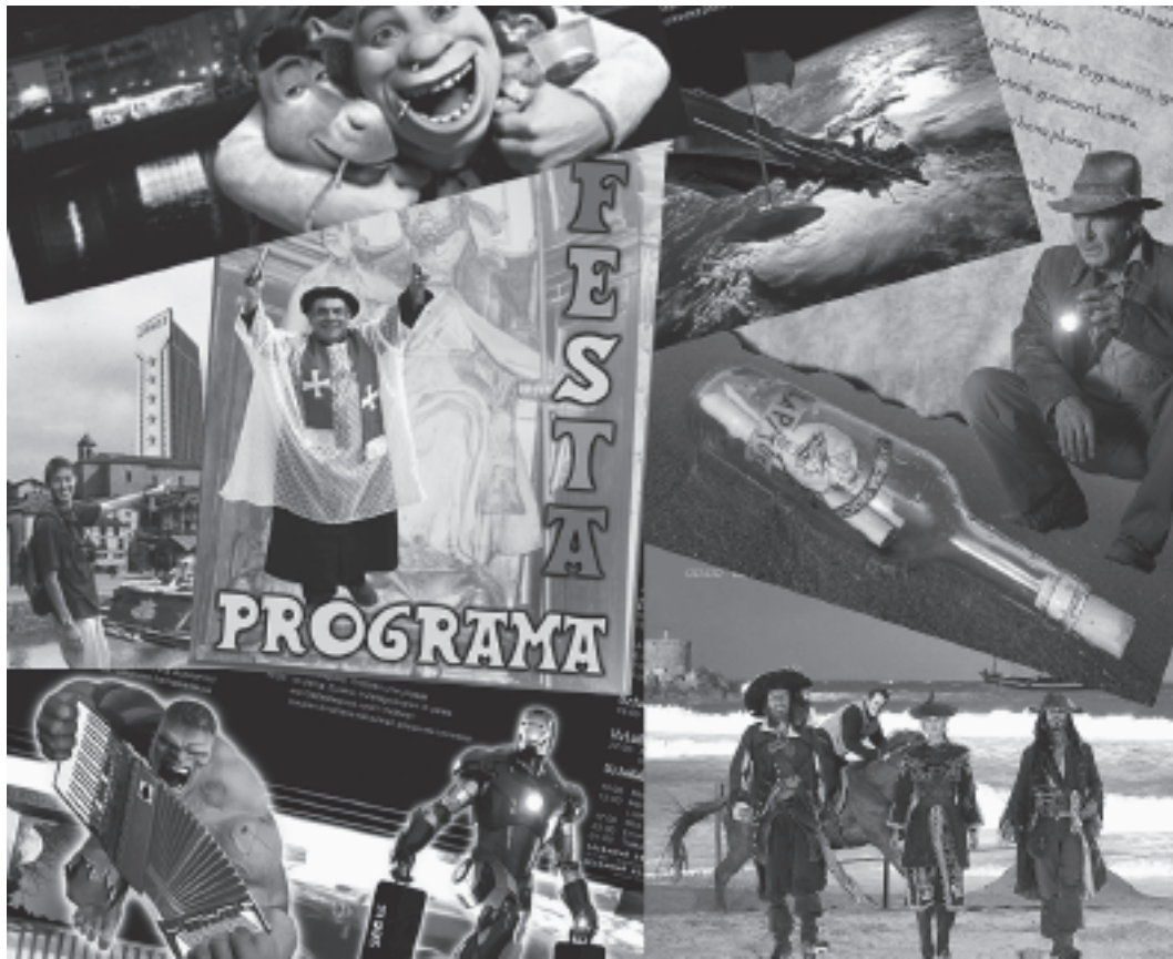
Sanpedrotako festa programa umoretsuak egin izan ditu KARKARAK azken urteotan.

Gaia librea izango da eta, KARKARAKOOK noizbait egin izan dugun moduan, urteko gertaera edo pertsona esanguratsuekin lan egin ahal izango da. KARKARAK aukeratuko du irabazlea eta, horretarako, originaltasuna eta ikusgarritasuna baloratzearaz gain, lanak Oriorekin eta euskararekin lotura izateari emango zaio garrantzia. Diseinua lantzeko,