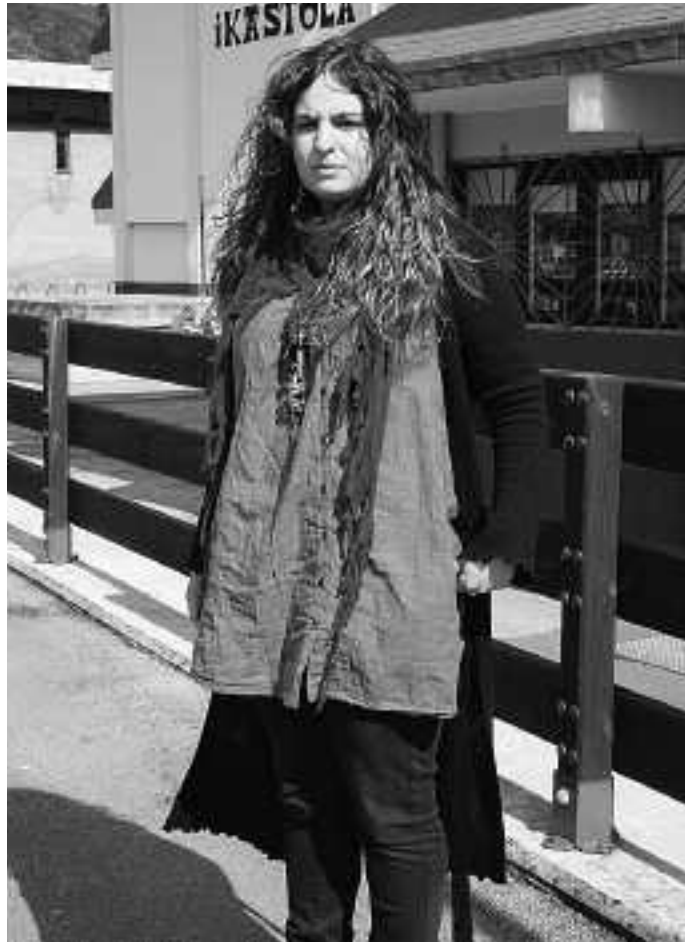
Hirugarren diskoa ateratzeko asmoa du Olaxka taldeak.

Datozen urteetan ikusiko da taldeak aurrera egiten duen edo ez, kantuari garrantzia