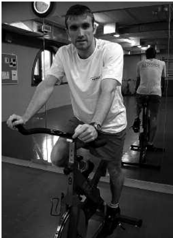
Ibanek egunero ematen ditu eskolak Karela kiroldegian.

Gero eta jende gehiago hurbiltzen zaigu eta niri ere asko motibatzen nau horrek berak.