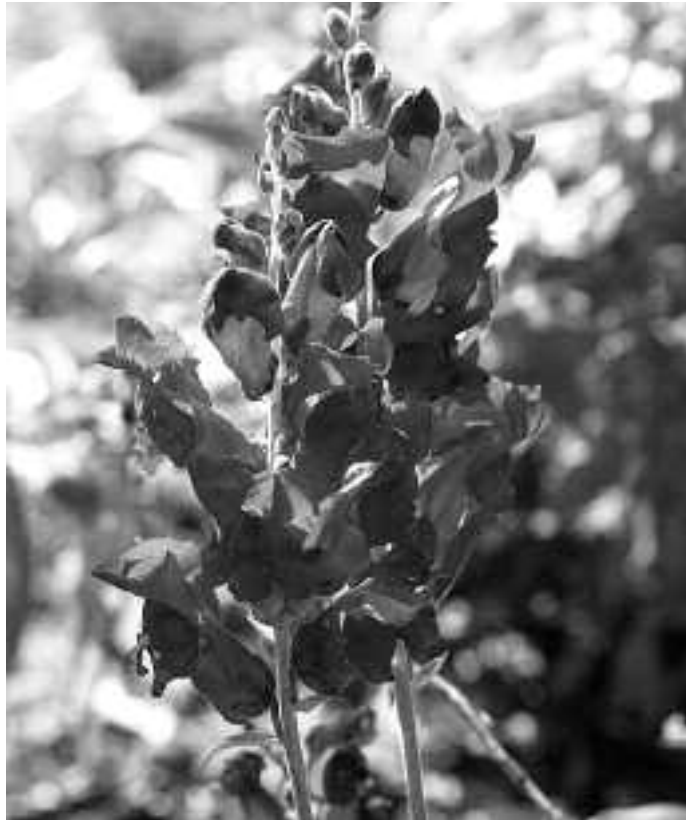
Ohiko eta ez hain ohiko landareak izango dira Iturraranen.

Antolatzaileek adierazi duteenez, landareez gain saltoki