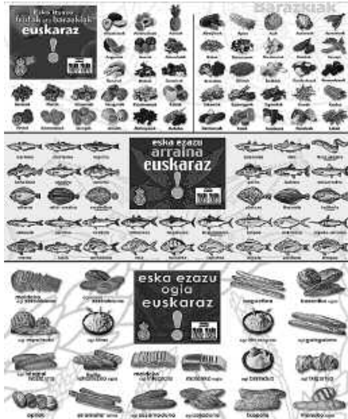
Barazkien, arrainen eta fruten euskarazko izenak dituzte kartelek.

Bestalde, kantu liburuxkaren edizio berri bat kalera-