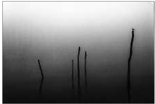
Itsas paisajeak-ingurugiroaren zaintza ataleko 1. saria | J. Lizarralde

Bestalde, semea Eibarko Arrate eskubaloi taldean jokatzen ari da aurtengo eta partiduen argazkiak aterata eta nire blogean —www.picasa-