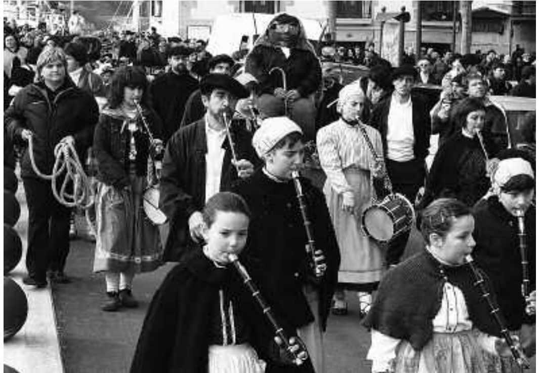
Ikastolakoak eta Zaraguetakoak elkarrekin arituko dira Olentzeroren eta Jaiotzaren inguruan kantari 24an.

Abenduaren 27an, Aurtengo kirolzalea 1. festa izango da, 12:00etan. 22:00etan, Herribil 4 ikuskizuna Karel-an. Hilaren 28an Salatxo abes-batzak kontzertua eskainiko du elizan, 12:45ean. 29an, The Upper Room taldearen Gospel emanaldia izango da kul-