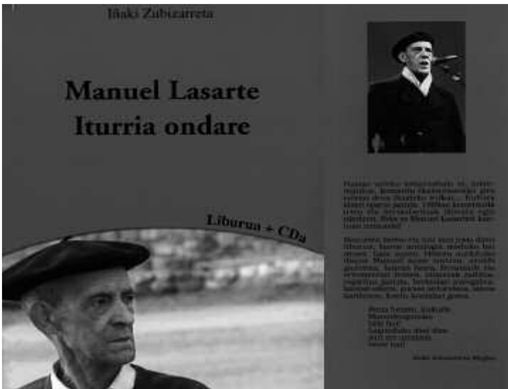
Manuelen idatzi eta bertso askotan aiarren eta oriotarren oso gertuko errealitatea agertzen da.