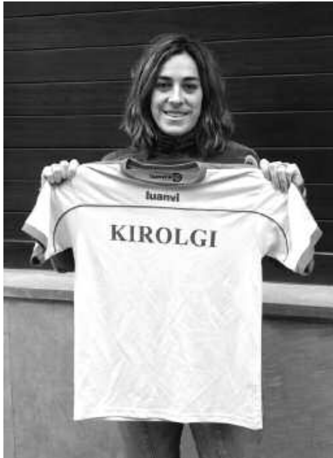
Babesle bila dabilta OBB taldeko neska.

Oso dibertigarria da: errebotek izaten dira, kanasta jotzen badu ere balio du... kiroldegiko edozein atal da