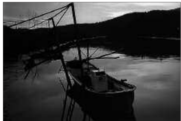
Itsas paisajeak-ingurugiroaren zaintza ataleko accessita | J. Lizarralde