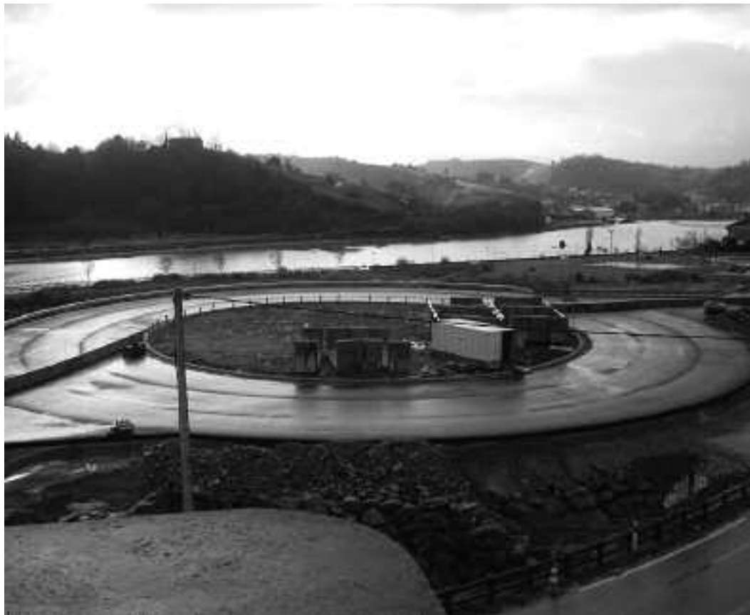
Anibarko Portuko inguruan egiten ari diren lanek sortu dute lurjabeen errekurtsoa.