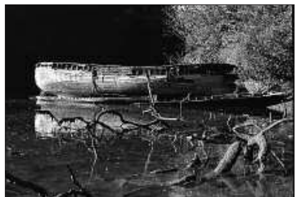
Kirol arrantza ataleko accessita | J. Lizarralde

web.google.com/JOXEAN-BIXKI— zintzilikatzen ditut, nahi duenak ikusi eta jaitsi dituzten.