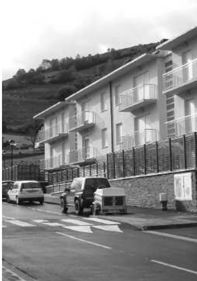
Etxeak jabeen zain daude, erabat bukatuta.

ARAZOAK ARAZOEN GAIN Oso prozesu luzea eta polemikoa izan da Ametsgain kooperatibaren etxeak egitekoa eta kooperatibistak ez daude batere gustura egindakoarekin. Udalak etxeen kalifikazioa zehaztera behartu gintuen,