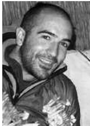
JOSEBA BRIT KANTARI KOSMOPOLITA

Dirudienez, ez gaude prest disko batek duen pre-