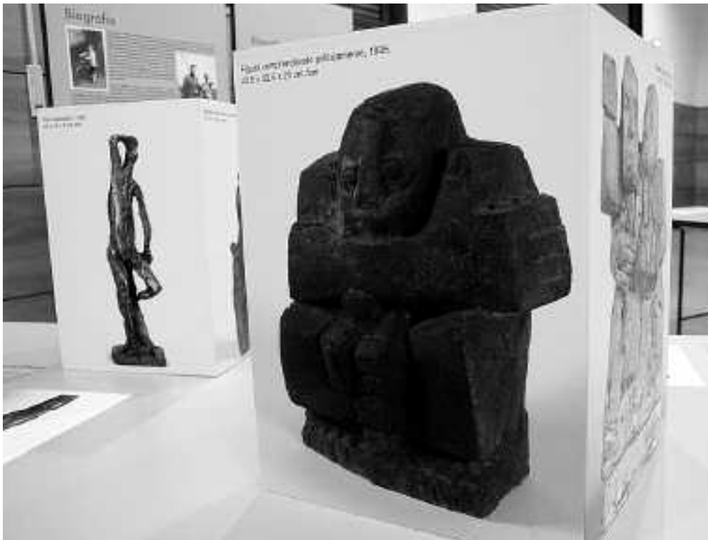
Azaroaren 26a arte dago ikusgai kultur etxeko areto nagusian Oteizari buruzko erakusketa.