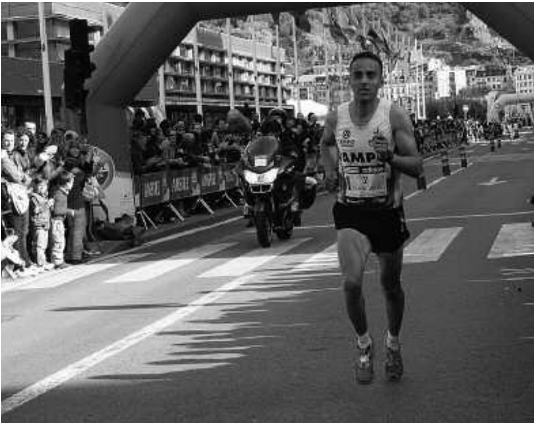
Iazko edizioan bezala, aurten ere bigarren izan da Kamel Donostiako bulebarreko helmugan.