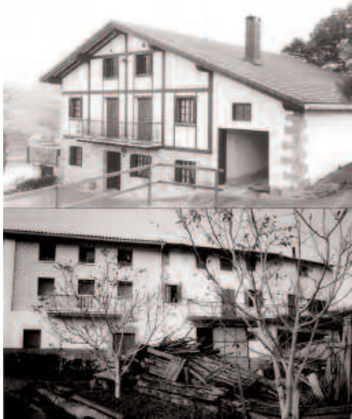
Baserrietan bizi direnek aukera dute diru laguntzak jasotzeko.

Euskal Autonomi Erkidegoko baserri inguruko biztanleei zuzenduta dago programa eta lau laguntza mota eskaintzen ditu: baserri ingurua zaintzera eta bertako biztanleen bizi kalitatea hobetzera zuzendutakoak —era horretara, baserriarrei oinarriko hornikuntza zerbitzuak hobetzeko aukera ematen zaie—; enpresak sortu, handitu edota modernizatzeko laguntzak —jarduera ekonomikoetarako lurzorua zein jarduera horretarako beharrezkoak izan daitezkeen lokalak prestatzeko asmoak ere atal honetan sartzen dira—; lanpostuak sortzera zuzenduak —aurrez lanik eduki ez duten edo lana galdu duten pertsonak kontratatzea izango da kontuan hartuko dena. Horrez gain, nork bere kabuz jarduera sortzeko asmoa duenak ere, laguntza mota hau eskatzeko aukera izango du—; etxebizitzak egiteko edo berritzeko