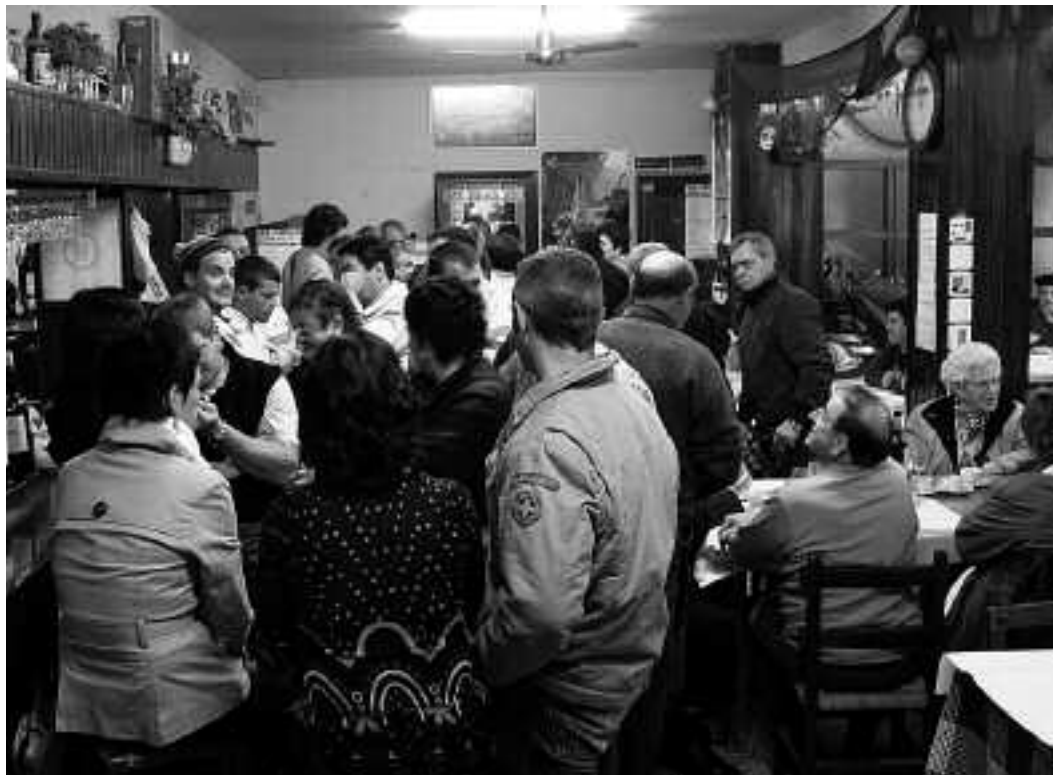
Sagar biltzea eta toka txapelketa bertan behera utzita, auzotarrak hamaiketakoak egiteko bildu ziren.

San Martin egunean, berriz, meza izan zuten San Martin baselizan eta, ondoren, izatekoak ziren sagar biltzea eta toka txapelketa bertan behera geratu ziren, eguraldi txarra zela eta.