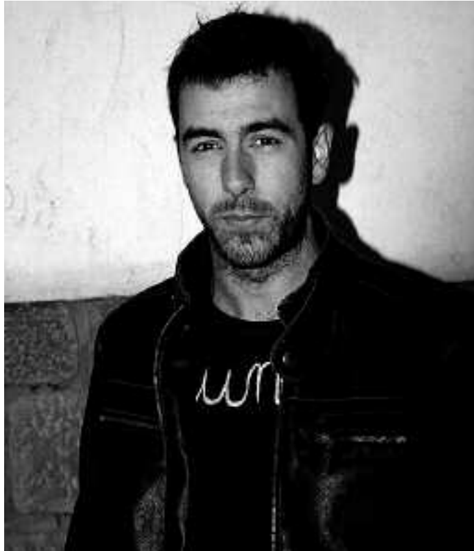
Ilusioz hasi du Zinkunegik aurtengo denboraldia.

Gauzak horrela, uste dut entrenatzaileak nigan kon- fiantza baduela, eta nirekin kontatzen duela atea behar bezala zaintzeko.