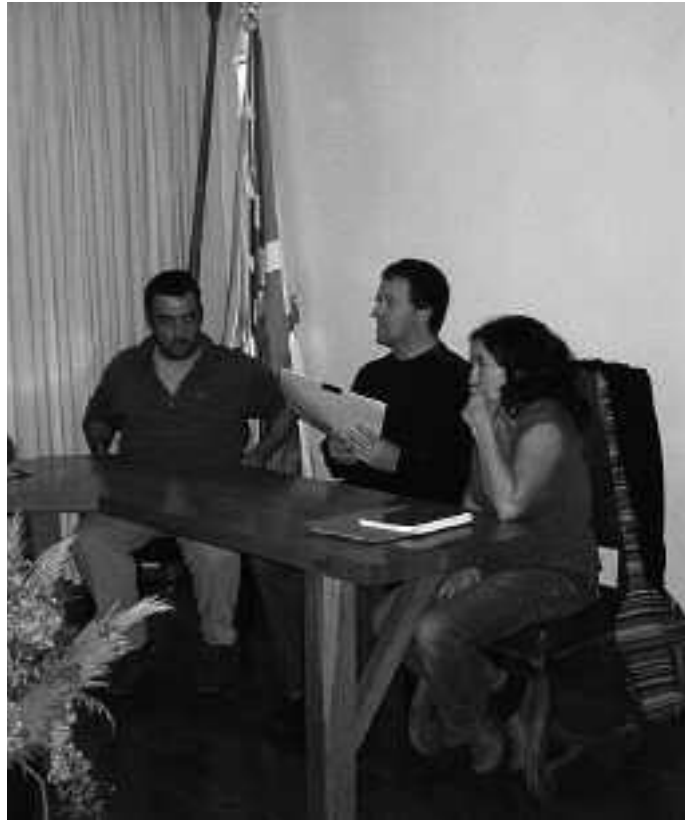
Zinegotzien egoeraren gaiari heldu zioten udalbatzarrean.