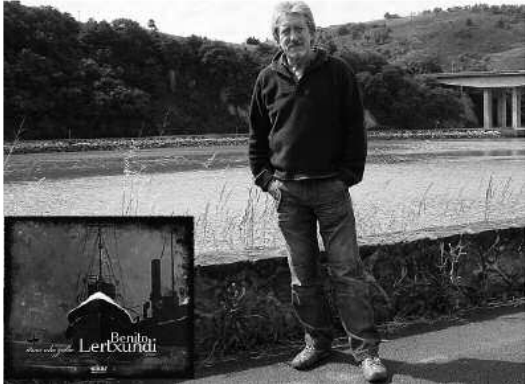
Hamar kantu bildu ditu Benito Lertxundik urriaren 16an kaleratu zuen Itsas ulu zolia disko berrian.

Itsas ulu zolia udaberrian grabatu zuten, Elkar etxeak