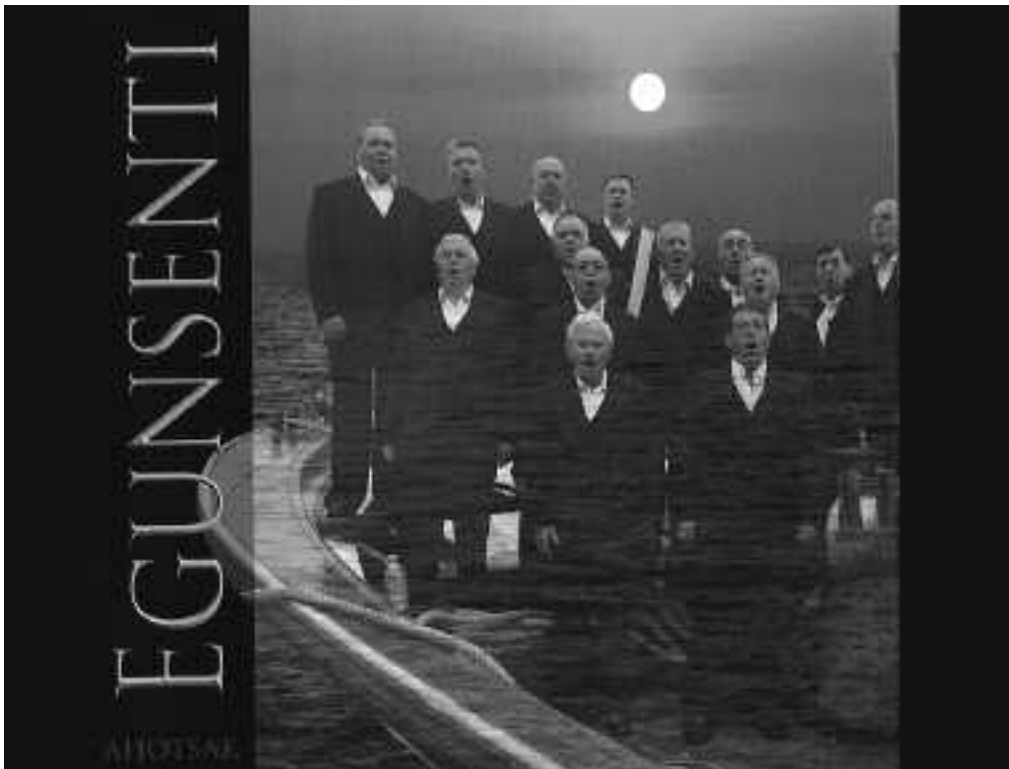
Euskal Herrian ez dira otxote asko izango: gutxiago hamalau lagunek osatutakoak.