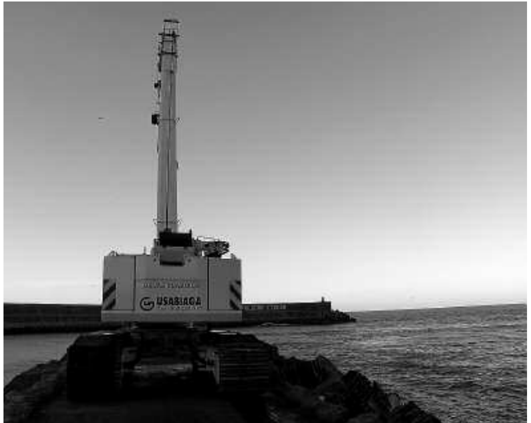
Abenduaren erdi aldean hasi zituzten eskoilera egokitzeko lanak.

Goiko kalera igotzeko bigarren igogailuari dagokionez, 3 hilabete lanak amaituta izatea espero duela adierazi du