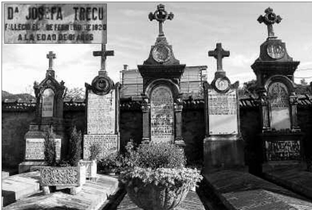
Nire aipamenak izango dira beste laurogei urtean... zioen Txirritak. Baita Josepa Trekurenak ere, hil eta 88 urtera. KARKARA