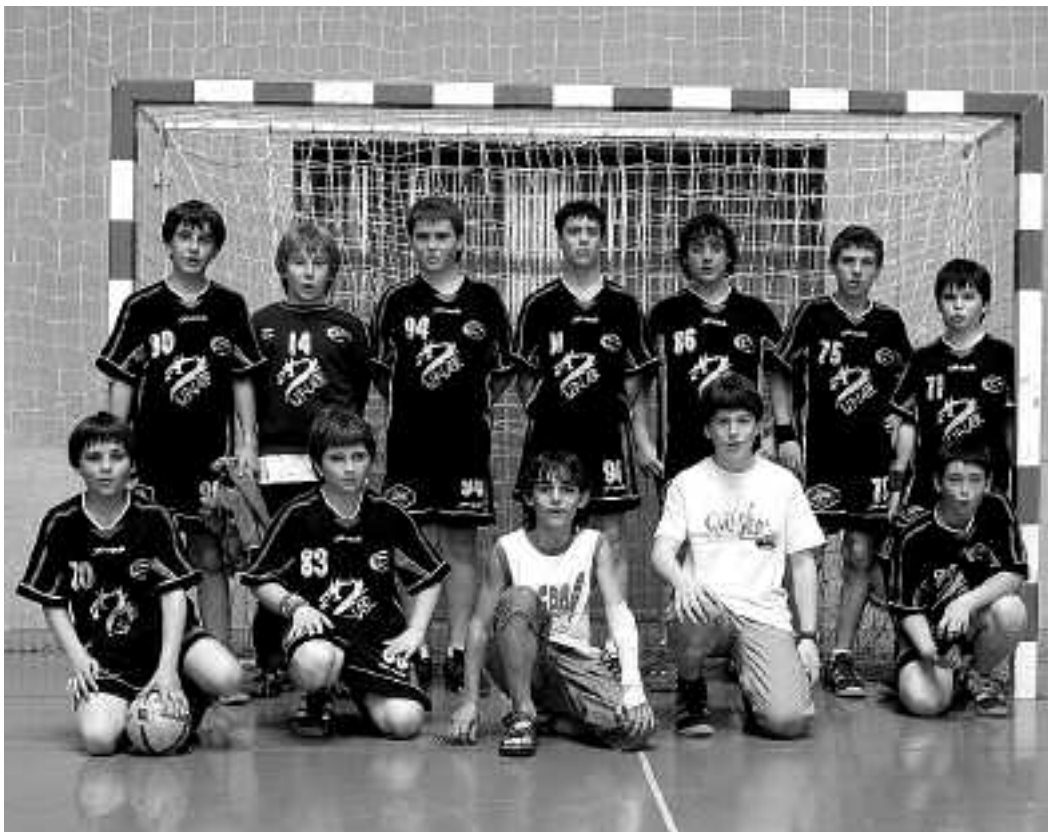
Azken partidaren 8-38 irabazi zioten Xurumurru taldeko mutilek Leitzarangoei.

Bestalde, Orioko pilotata elkarteak VI. eskupilota txapelketa herrikoia antolatatu du. Bertan izena emateko epea otsailaren 15ean bukatuko da.