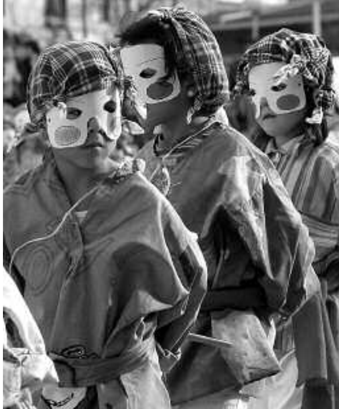
Ikastetxeek, nork bere aldetik, ospatuko dituzte inauteriak.

Urtarrilaren 31 aukeratu du Ikastolak inauteri jaia egiteko. 14:30ean, LHko ikasleek jolasak izango dituzte DBHko ikasleek antolatuta. Mozo-rrotuta hartuko dute parte gutziek; 15:30ean, HHko ikas-leak Ikastola aurreko plazole-tara aterako dira, kalejiran, dantza egitera; 15:45ean, LHko ikasleek inauteriekin