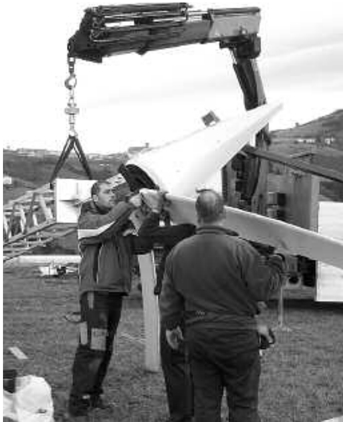
Haize errota sortzen duen energia neurtu eta erabiliko dute bertan.

Geotermikoa martxan jartzeko, baserri atzeko belardian 1.500-2.000 metro koa dro lur altxatuko dute, metro beteko sakonean tuboak sartzeko. Bero-ponpa baten bidez lurraren azaleko eta lur azpiko tenperaturen aldea aprobetxatzen du sistemak beroa sortzeko. Zelaia lehen bezala geldituko da esan digu Aizpuruak. Sortutako beroa erabiliko da lorategiko berotegietan, baina berdin erabil