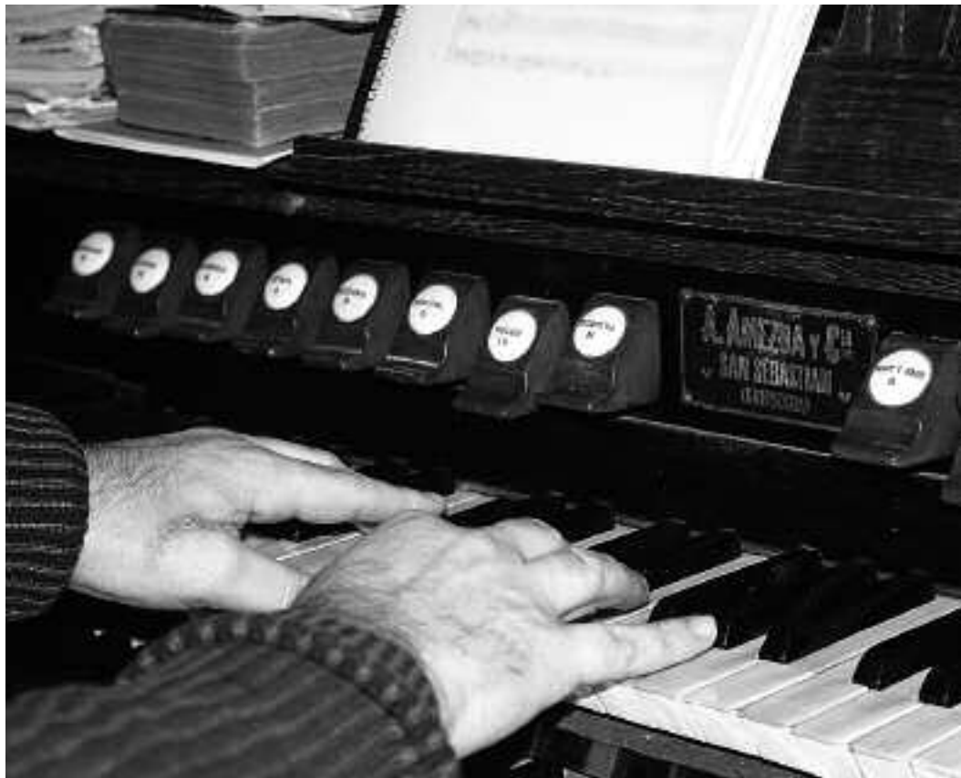
la konturatu gabe, New Yorkekin eta Genevarekin lotu du Aia organoak.

Organora bueltatuz, Amezua eta Konpainiak organo-egile garrantzitsuak ziren Eus-