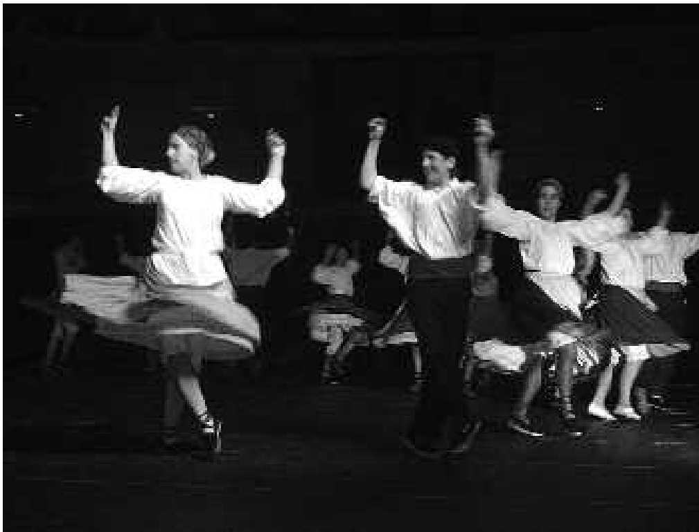
Herribil taldeko dantzariak saio bikaina eskaini zuten Herribil III ikuskizunean.