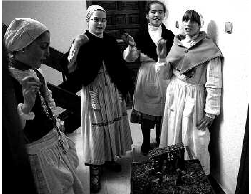
Ohitura den bezala, Gabon egunean etxez etxe kantari, eskean ibili ziren haurrak.

Kantuak eta musikak ere izan dute tarterik festetan. Salatxok elizan emandako kontzertura lagun ugari hurbildu zen. Abenduaren 24an, berriz, herritar asko ibili zen Gabon kantuan, bai goizean eta baita arratsaldean ere. Benito Lertxundiren emanaldia ere arrakastatsua izan zen, Kiroldedia bete egin zen eta sarrera guztiak saldu ziren. Hala ere, jende asko geratu zen sartu gabe, leku faltagatik. Herribil III. ikuskizunaren ere bete egin zen Karela. Muthi-