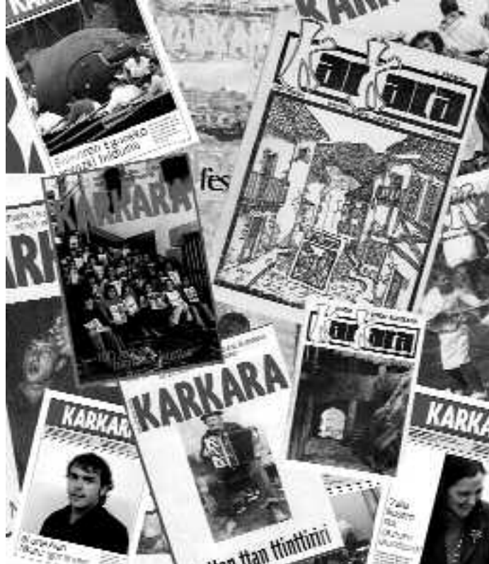
233 zenbaki argitaratu ditu Karkarak sortu zenetik, orain 19 urte.

Argitaratzen dugun publizitate kopuruak ere zerikusi handia izan du erabakia hartzeko orduan. Aspaldi honetan, modulu berri gehiago sartzeko apenas lekuri gabe galbiltza. Tarteka, erakunde edo enpresaren batek orrialde erdi edo oso bat kontratatu nahi izan duenean, lau orrialde