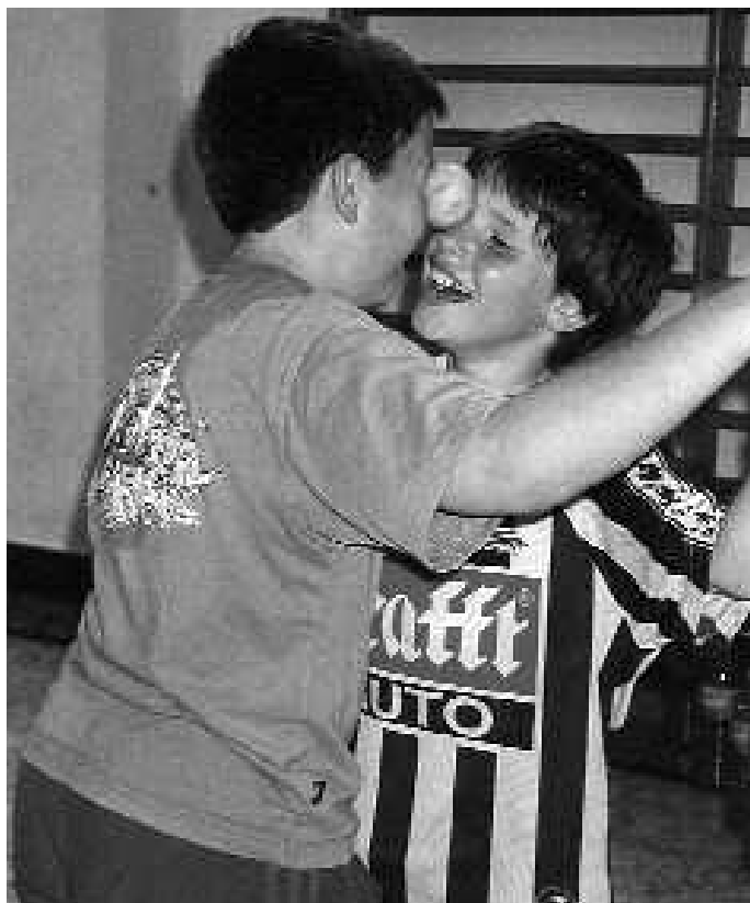
Azken 25 urteetan egindako argazkiekin bilduma osatu nahi dute

Azken 25 urteetan eskolarekin lotura dituzten argazkiak (eskolan, irteeretan... hartutakoak) kultur etxera ekartzeko deia egin du komisioak. Konpromisoa hartu dute