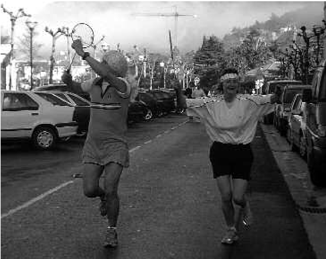
Giro aparta izan zen Ibilbide osoan, mozorroturik eta ttuntturroen laguntzaz amaitu zuenik ere izan zen.