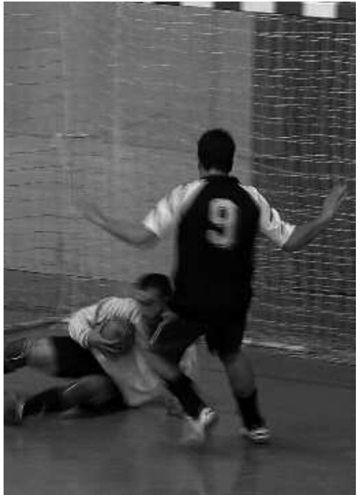
1-2 gailendu zitzaion Altuna Autoak Tiki-Takari finalean.

Urtarrilaren 4an jokatu ziren finalaurrekoak. Tiki Taka Xixarioren aurka lehiatu zen (3-