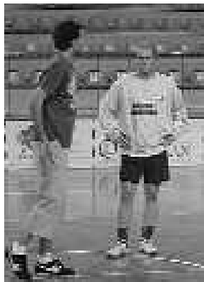
Karelana jokatuko da Txapelketa.

Urtero bezala, Txapelketa lehenengo 4ek saria jasoko dute: 500 euro eta trofeoa irabazleak; 250 euro eta trofeoa txapeldunordeak; 100 euro eta trofeoa hirugarrenak eta trofeoa besterik ez laugarrenak.