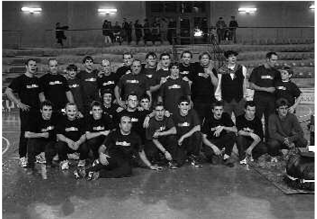
Parte hartzearen adibide garbia izan zen herri kiroletan aritzeko bildutako lagun guzti hauena.

Hurrengo festetarako zer hobetua ere badela adierazi du