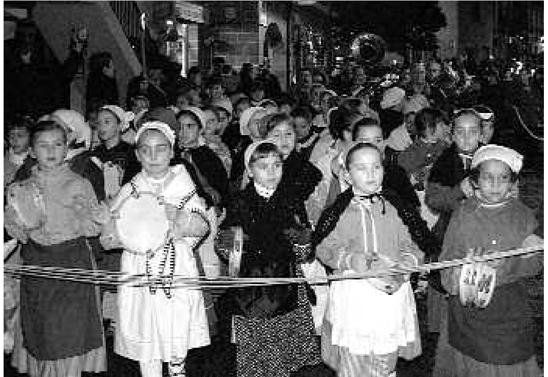
Ohi bezala, erregeen kabalgata jendetza bilduko du aurtengoan ere.

Abenduaren 22an trizikloak, kotxe pedaleak eta patineteak izango dituzte haurrek jolasteko. 17:00etatik 19:00etara izango da, Ikastola aurrean edo pergolan, eguraldiaren arabera; 23an, Salatxo abesbatzak kontzertua eskainiko du elizan, meza nagusia eta gero; 24an, goizean hasita, ikastetxeetako haurrak kantari arituko dira herrian barrena; 26an, globo mezulariak eta txokolatada izango dira plazan, 17:00etatik 19:00etara; 27an, joko tailerra egingo da plazan, 17:00etatik 19:00etara; 28an, 0-3 urte arteko haurrentzako txiki-txokoa prestatuko dute kultur etxean, 10:30etik 12:30era; 28an, haurrentzako bideo emanaldia eskainiko da kultur etxean, 17:00etan. 22:00etan, berriz, Benito Lertxundik kantuan jarriko du herria, kiroldegian; 29an, Herribil 3 dantza ikuskizuna eskainiko du Harribilek Karelana, 22:00etan; urtarilaren 2an eta 3an, haurparkea zabalduko dute Karelana, 11:00etatik 13:30etara eta 16:00etatik 20:00etara; 4an, aintzinako jolasak ezagutzeko aukera izango da plazan, 17:00etatik 19:00etara; 5ean, Erregeen kabalgata iritsiko da