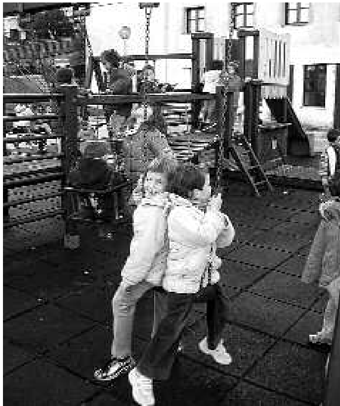
Eskolaren etorkizuna aztertzeke taldea sortu da.

Aurten 1.000 euro gehiago egokitu zaie KARKARA eta Hitzari, eta euskara ikasteko kopurua 1.000 eurotik 3.000 eurora igo da. Hitzez emaku-