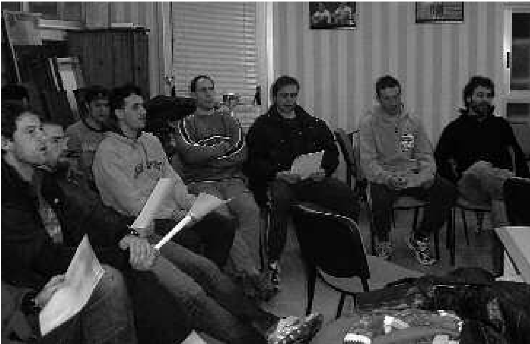
Benitok kantu bat egin die aguiluchoei , mirotzei, eta oriotarroi aurkeztuko digu kiroldegian, abenduaren 28an. IÑAKI ITURAIN