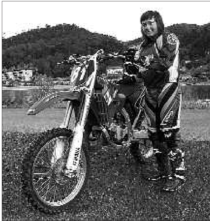
Garak onenen pare dagoela erakutsi du, beste behin.

Txapeldun berriak merezitako deskantsua hartzeko aukera izango du neguan, datorren urterako indarrak hartzeko. Munduko txapelketan parte hartzeko gonbita egin dio Team edo atzerriko talde batek baina, oraingoz, ezetza eman die. Izan ere, ikasketekin jarraitu nahi du eta baietza emanaz gero, ezingo lituzke, motoa