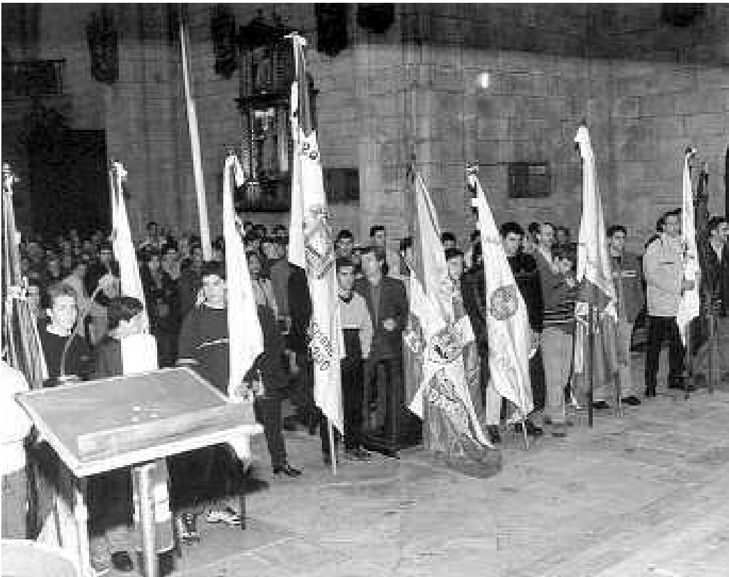
7 urteko hutsunearen ondoren, Kontxako bandera bedeinkatuko da aurten.