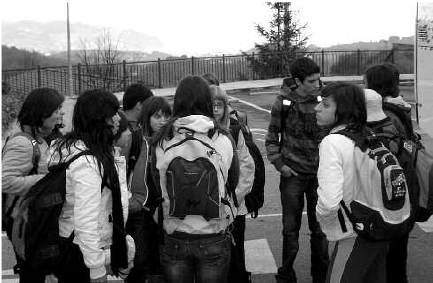
Gero eta gazte gehiago dira Aian, eta interes handia erakutsi dute jakiteko haienzako leku bat egongo den.