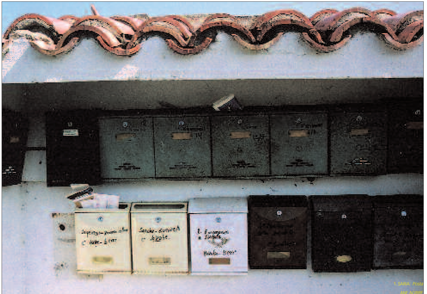
1 SARIA: Posta ANE AGIRRE