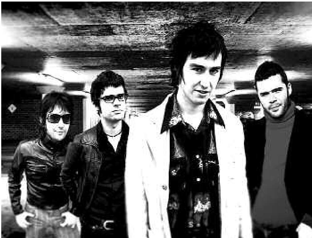
Sekulako kritika onak jaso zituen iaz argitara eman zuten Amateur universes lanak.