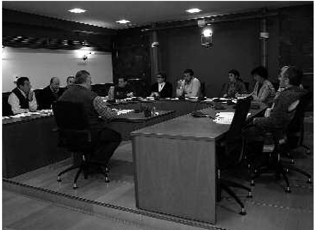
Azaroaren 27an izandako udalbatzarrean puntu guztiak onartu ziren, 2008ko aurrekontua barne.