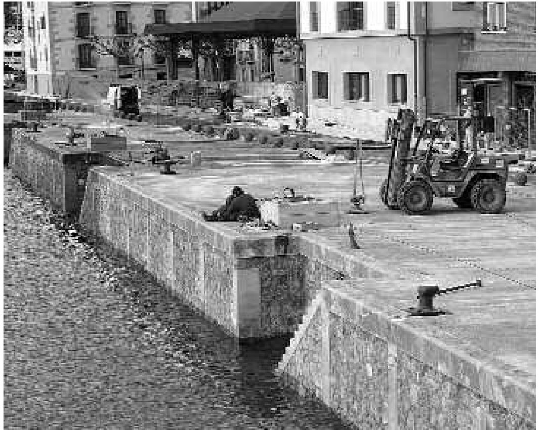
Txukun eta dotore, gustura hartu dugu oriotarrok itxura berritutako moila.

Kultur etxeko ondoko plazari, ia prest izan arren, igogailuaren lanak amaitu arte ez dela jendearentzat libre jarriko gehitu du Redondok.