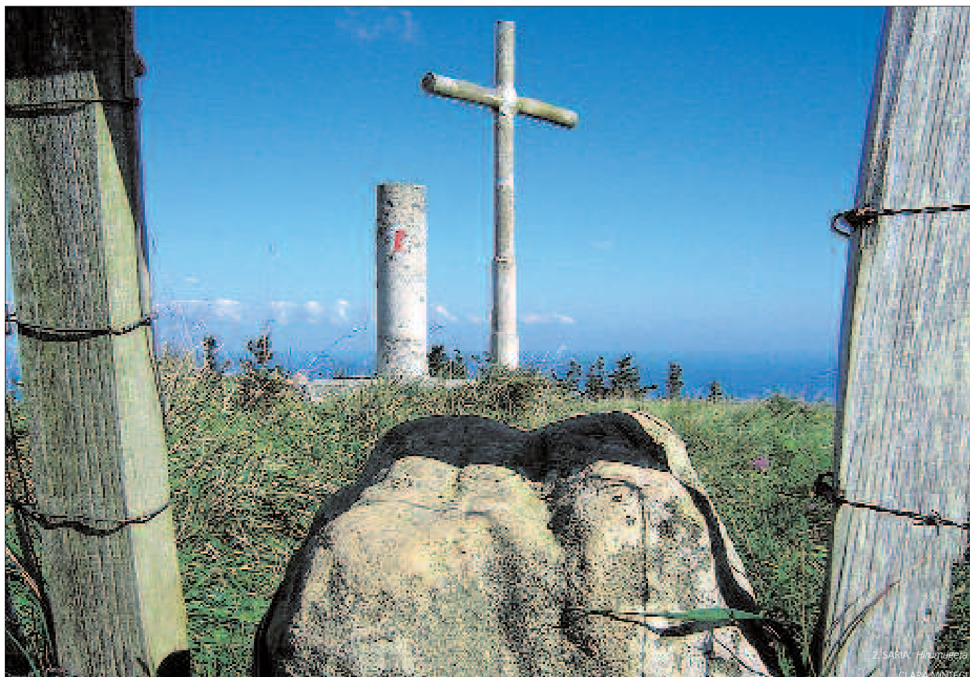
2. SARRIA: Hiruñugeta CLARA MINTEGI