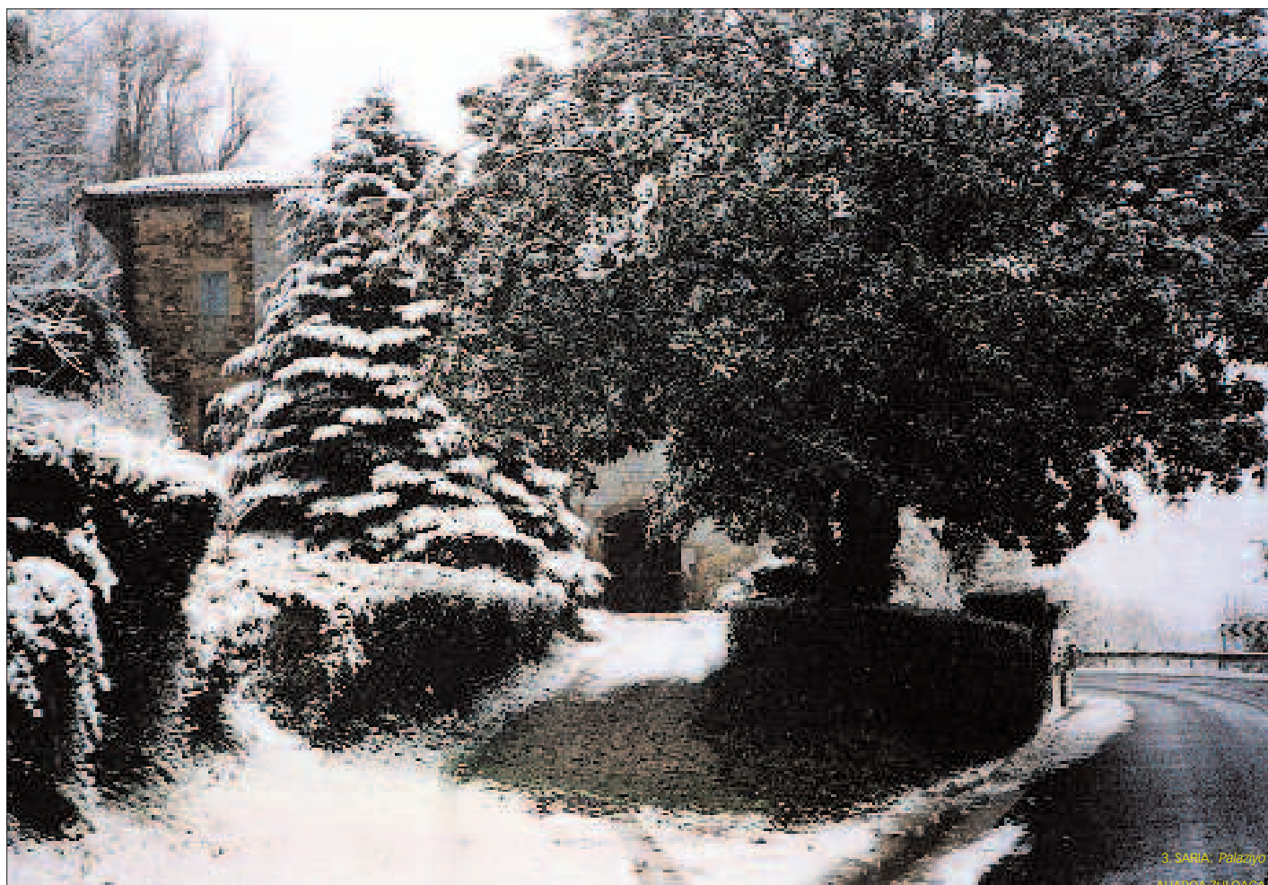
3. SARRIA: Polazio AHAROA ZULOAGA