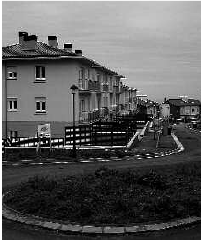
Ametsgain kooperatiba egiten ari diren etxebizitzak.