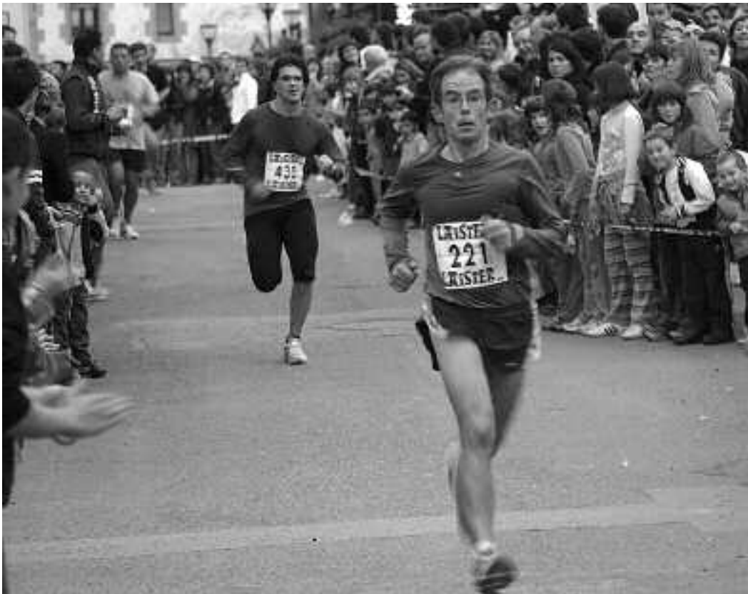
Orioko bertako herritar gutxi izan ziren Orioko II. Krosean.