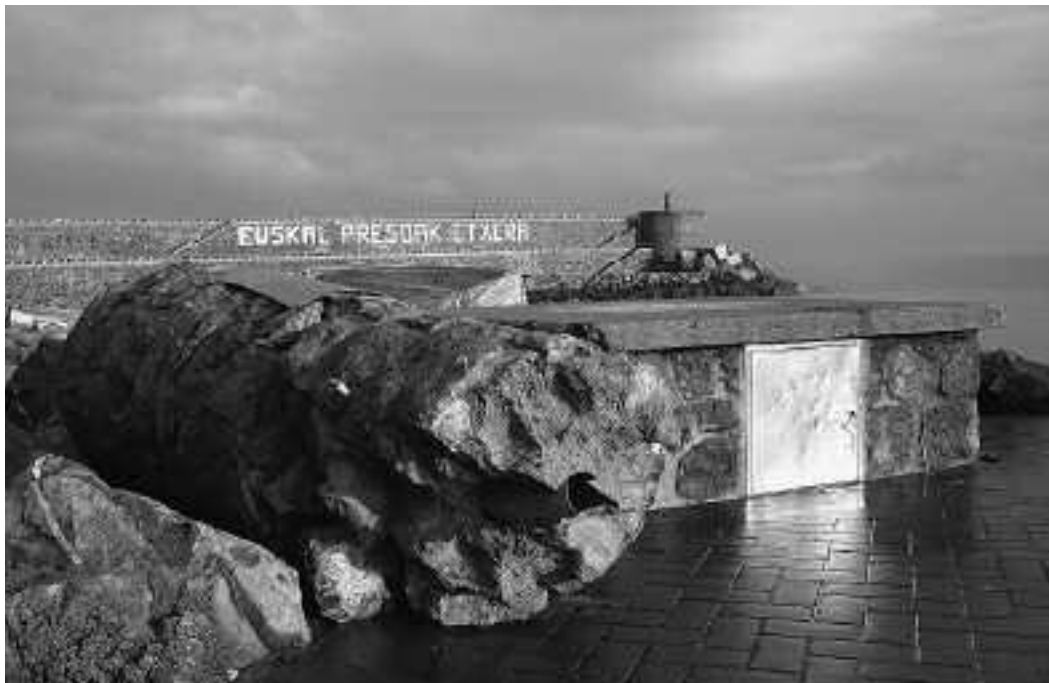
Itsasoaren indar ikaragarriak ez dio bizirik kendu inori, baina uretara eraman zuen plaka itsatsita zuen harria.