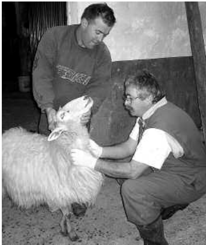
Ardiak dituzten guztiak kezkatuta ditu mingain urdin gaitzak.

Abereak dituztenak kezkatuta daude, gaitza duten animalia gutxi azaldu arren, baserritarren ekonomian eragin handia izan baitezake. Bate-tik, gaixotasunak berak eragindako galerak daude: animaliak hil, abortuak, tratamenduen gastuak... edota