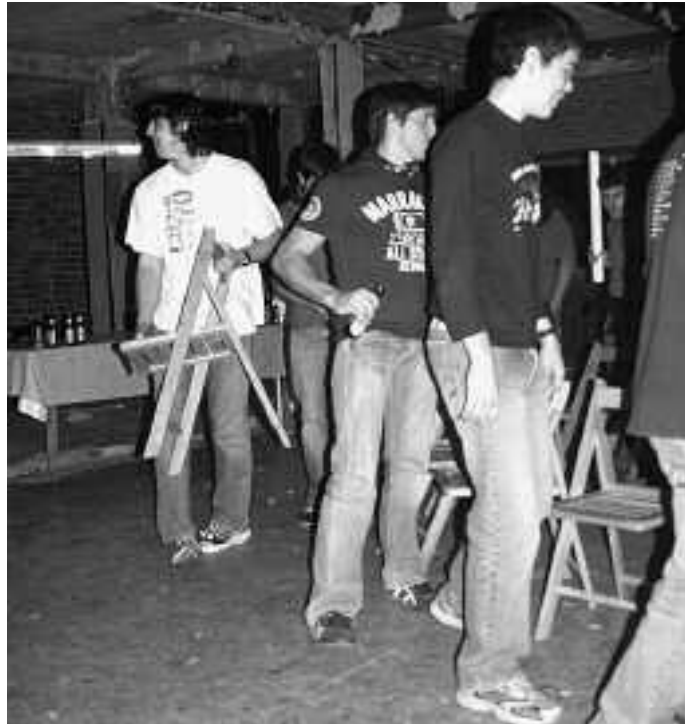
Orain arteko lokalean beharrean, aparkalekuan egin dituzte dantzaldiak. KARKARA

Gaur gauean Ortzaikan agertzen direnek nahi adina dantza egiteko aukera izango dute Izotz taldearekin. Larunbatean, berriz, oilasko biltzaileak baserriz baserri ibiliko dira goizean. Arratsaldean,