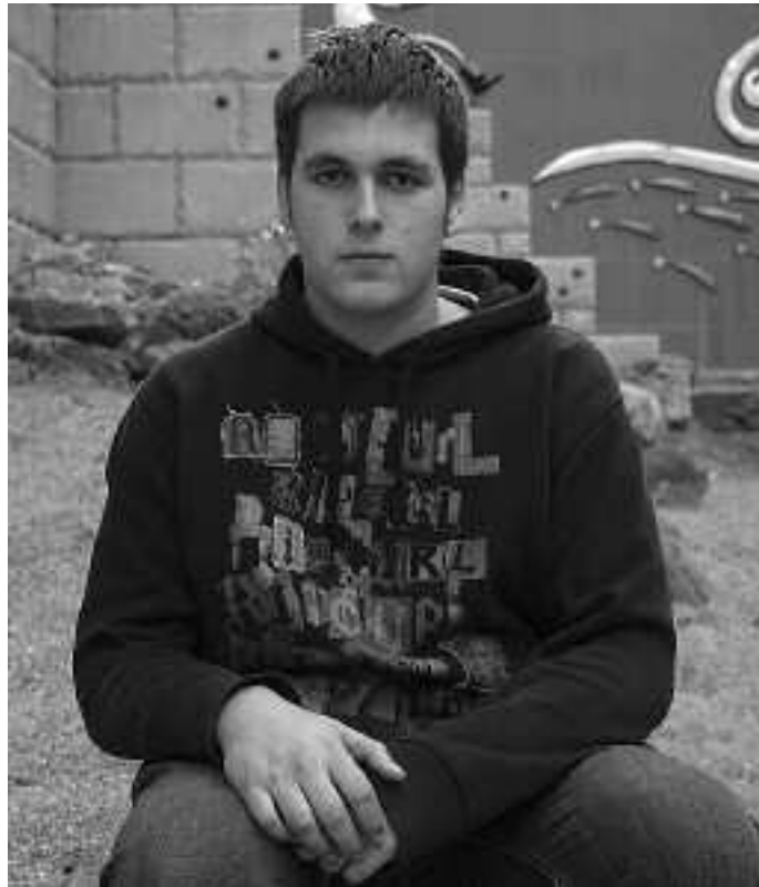
Hilaren hasieran herrian izan dira selekzioko mutilak eta Josu tartean. KARKARA

Urrian, berriz, Zarautzen beste egonaldi bat egingenuen eta hemendik aurre-