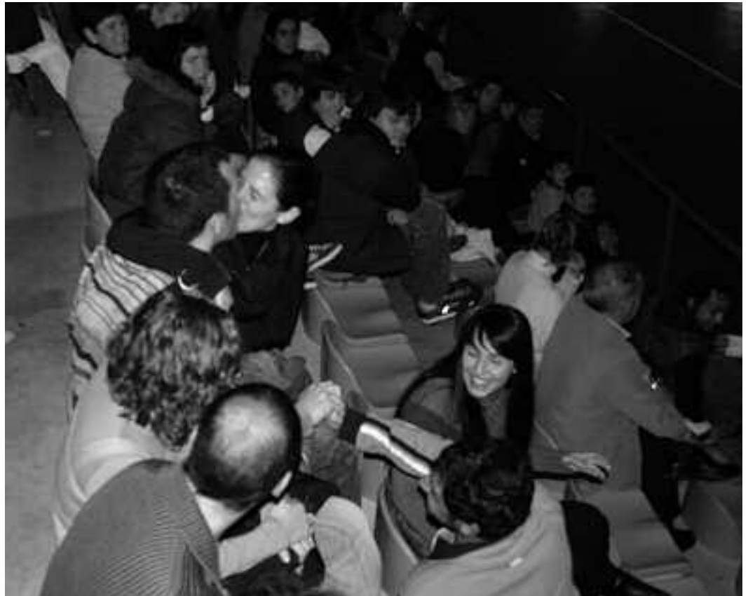
Poza nagusi norberaren izena entzun zutenen artean. Koadrila honetan, hiruzpalau lagunek entzun zuten berea.