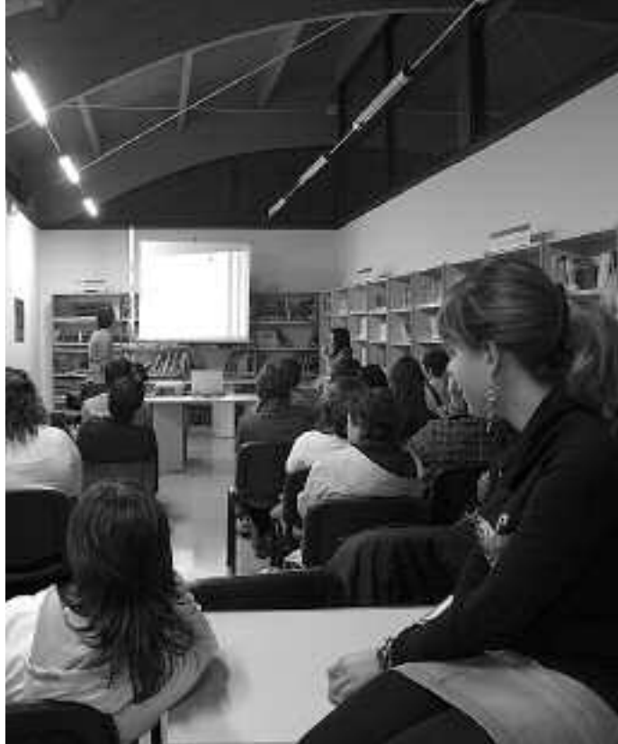
Liburutegia txiki geratu zen Txurrumuskik deitutako bileran.