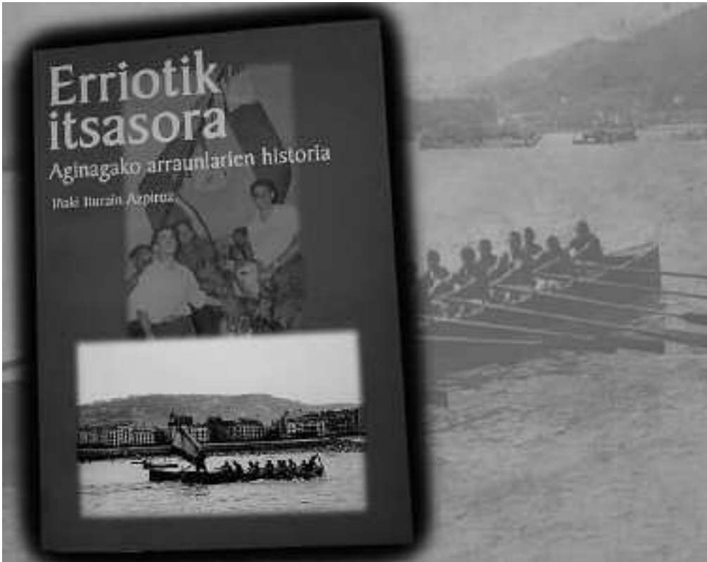
Mapiletik barra muturrera jaitsi, eta oriotarren istoria ulertzeko osagarri ezinbestekoa da liburua.