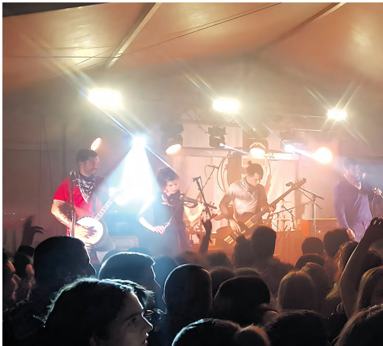
2022. urteko Bertsio Gaueko une bat.