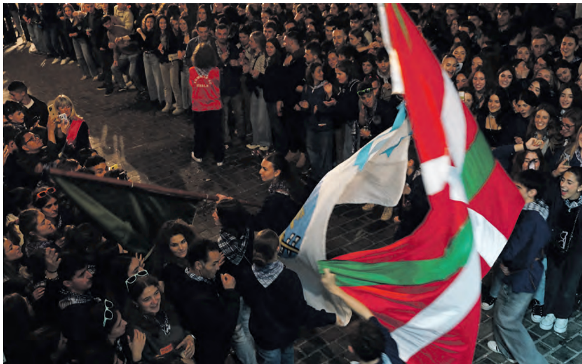
lazko banderaren igoerako irudia.

10:15. Prozesioa, San Telmo ermitara. 10:30. Meza nagusia. Itsasoaren aurrean otoitza egingo