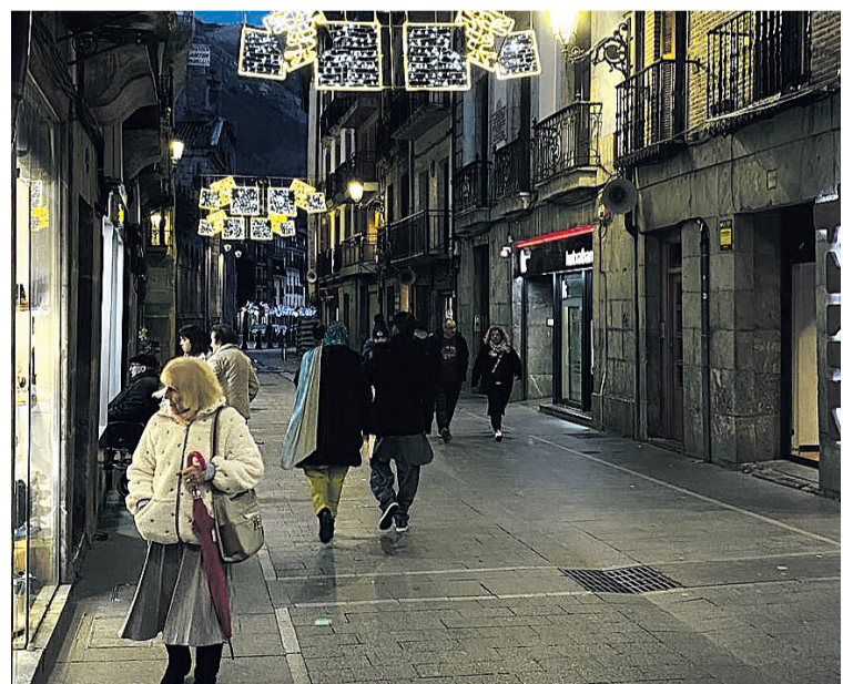
Herritarrek Kale Nagusiko saltokietako erakuslehoiak ikusten.

Erosketa egin eta beharrezko guztia eskuratzeaz gain, azkoitiarrek dirua irabazteko aukera ere izango dute Gabonetan. Abenduaren 23tik aurrera herriko saltokietan erosketak eginez gero, paper bat beren datuekin betetzeko aukera izango dute herritarrek, eta hori egiten duten