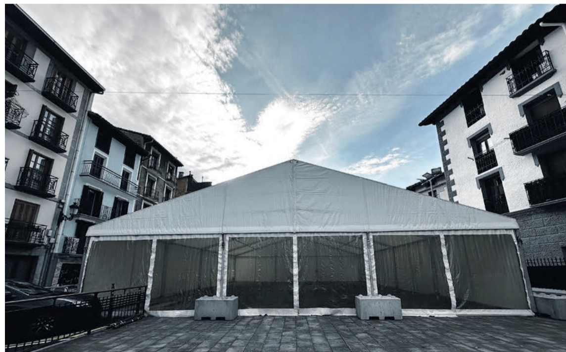
Frontoi Txikiaren ondoan jarri dute izotz pista.

Horrez gain, urtarrilaren 2an, 19:00etan hasita, antzerki emanaldia izango da Frontoi Txikian; eta urtarrilaren 3an, toki eta ordu berean, Family Bingo jolasa egingo dute.