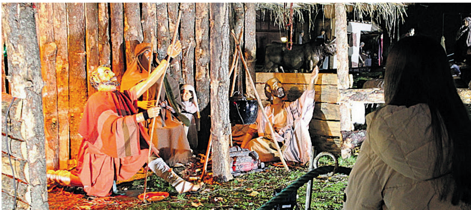
Bisitariak Narrosko jaiotza ikusten.

Bestalde, abenduaren 24ra bitartean egiten dituzten erosketen trukean txartelak banatuko dizkiete bezeroei, eta herritarrek, horiek beteta, askotariko zozketetan parte hartu ahal izango dute: 500 euroko bi erosketa txartel, 200 euroko lau txartel, 20 errege-opil eta Zarauzko dendetako produktuekin osatutako lau saski zozkatuko dituzte. Azkenik, Zarauzko Udalak, Turismo sailaren bitartez eta Murkil laguntzaz, erakusleihen lehiaketa antolatzen du Gabon giroa sustatzeko. Egitasmoan parte hartu duten saltokietako erakusleihen urtarilaren 6ra arte egongo dira apainduta. Lehiaketaren irabazleak orri-garria eta 800 euro jasoko ditu, bigarren saridunak 500 euro, eta hirugarrenak, 300 euro.