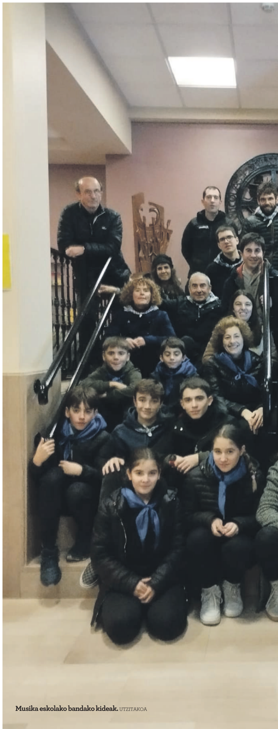
Musika eskolako bandako kideak.

1986. urtean sortu zuten musika eskola, eta gaur egun, 340 ikasle ditu. Askotariko ikastaroak jasotzen dituzte horiek: pianoa, esku-soinua, gitarra, txistua, klarineta, tronpeta edota panderoa bezalako instrumentuak ikasten dituzte, baita euskal dantzak, musika mintzaira eta mugimen-