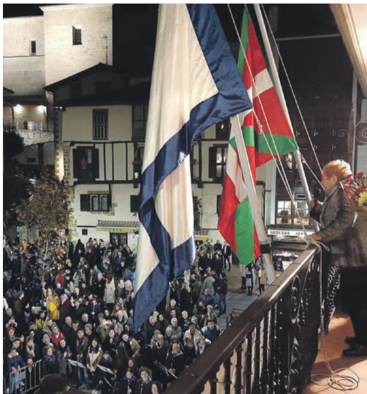
Iazko sanikolasetako txupinazoa.

Guztira 59.000 euroko aurrekontua dute aurtengo festek. Ingaruko festa garestienak ez bada ere, mimoz landutakoak dira, eta Orioko festetako ekitaldi ba-