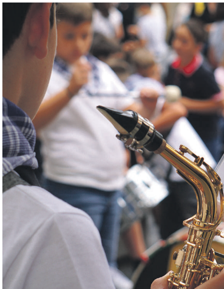
Aurtengo San Pedro egunean eskaini zuten lehen emanaldia.

ko kideek azaldu dutenez, zabaltsun handiagoa eman nahi diote hasiberri den proiektuari: «Kalean eta festan ikusten dugu geure burua, zerbait ospatu behar den aldiro, prest gaude herriak behar gaituen ekitaldi guztietan jotzeko»