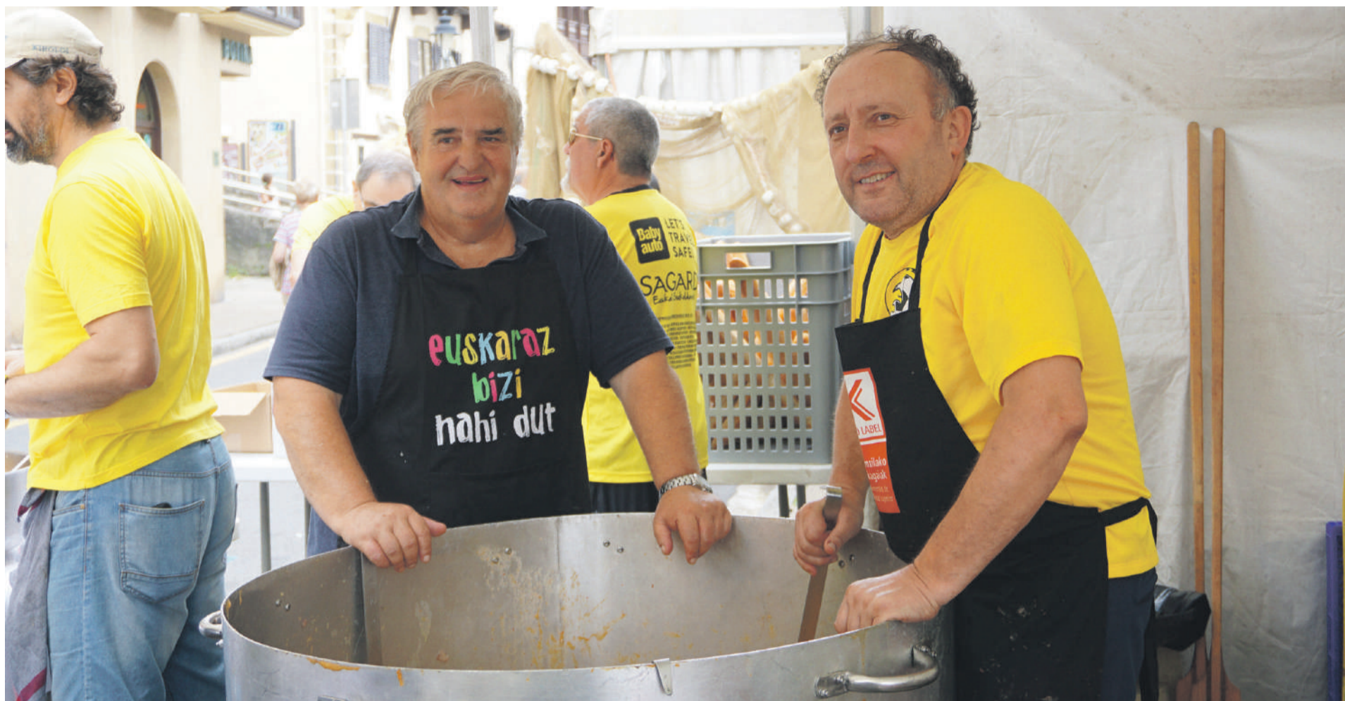
2019ko Bisiguaren Festa.