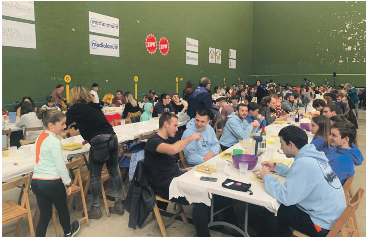
Aurten Karela kiroldegian egingo da sanikolasetako herri bazkaria.

18:00. Danbolin musika eskolako bandaren kontzertua. Ondoren, San Nikolas festetako ekitaldi nagusia. Pello eta Nikolasa, Salatxo, Harribil, Danbolin