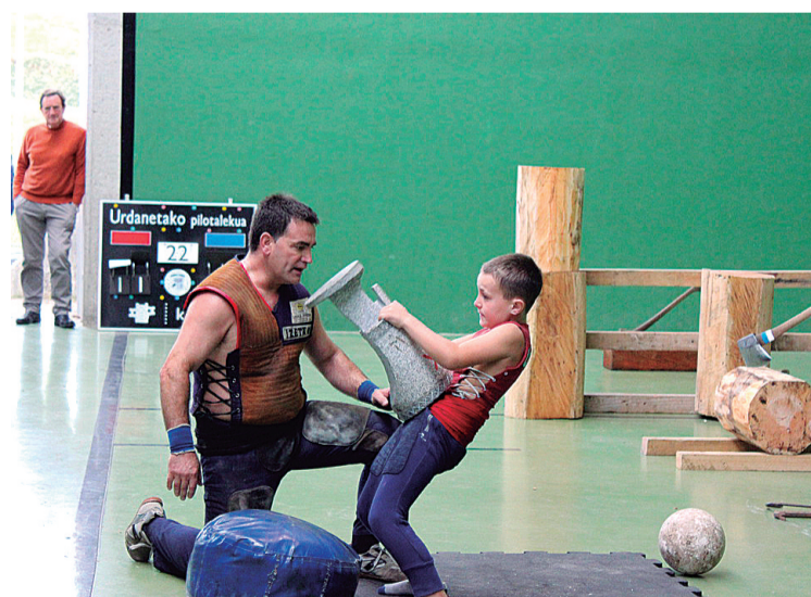
Eskualdeko hainbat herritan eta auzotan ospatu dituzte samartinak asteburuan. HITZA

San Martin festak ospatu dituzte asteburuan eskualdeko hainbat txokotan. Errezilen herriko jaiak dituzte, eta besteak beste, azoka, gazta nahiz tarta lehiaketak eta bertso saioa izan dituzte.