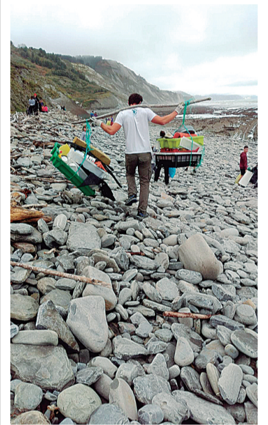
Harraldea garbitzen. W. PRINSE

ZUMAIA // Bi hilean behineko odol emateak egingo dira asteazken honetan 16:30etik 20:30eta bitartean Eusebio Gurruztaxaga plazako gizarte zentroko bigarren solairuan. Gabonetako loteria ere salgai izango dela adierazi du Zumaia odol emailen taldeak.