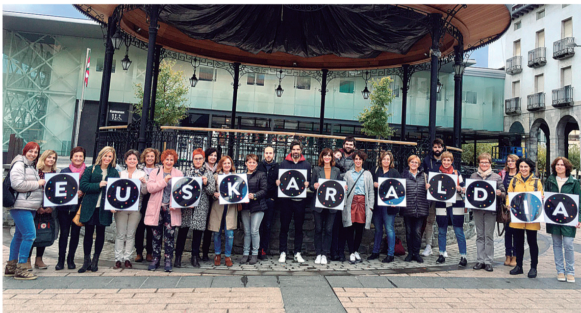
Azpeitiko Bertan merkatari elkarteak bat egin du Euskaraldiarekin. HITZA