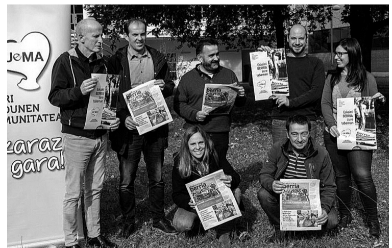
Berriako, Uemako eta hainbat udal txeko ordezkariak. UEMA

AZPEITIA // Udalak abenduaren 15ean banatuko ditu aurtengo Kirol Sariak, eta herritarrek dagoeneko aurkez ditzakete hautagaiak. Hilaren 18ra arte egin daitezke proposamenak kirolak@azpeitia.eus helbidera idatzita, 943-15 00 95 zenbakira deituta edo Udala Harrera Erregistrora bertarata. Ondoren zabalduko dute botoa emateko epea.