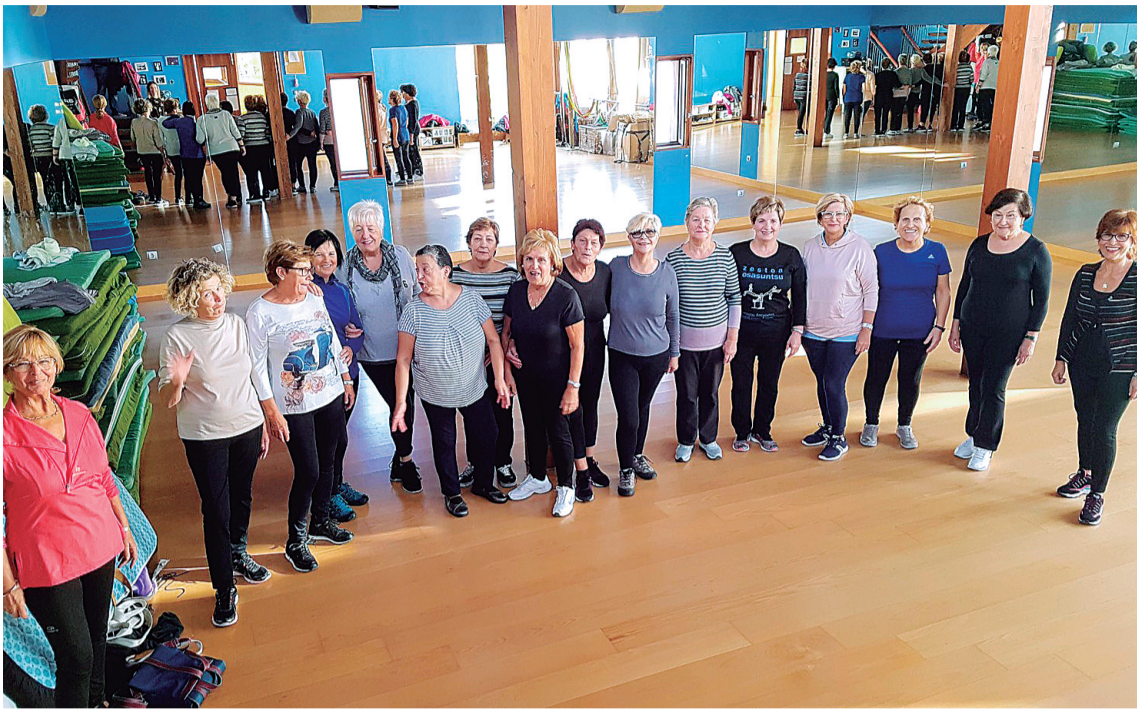
Dantza saio hauetan parte hartzen ari diren zumaia batzuk. JUAN LUIS ROMATET