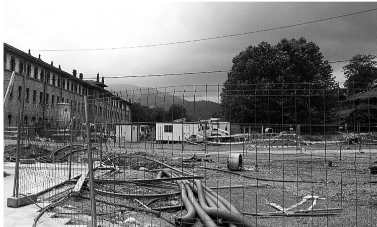
Esklabak-Iturtzulo eremuko lanak.

Udal sustapeneko etxebizitzetan izena eman zuten herritarrek ez dute halako orririk aurkeztu beharko; izan ere, ho-