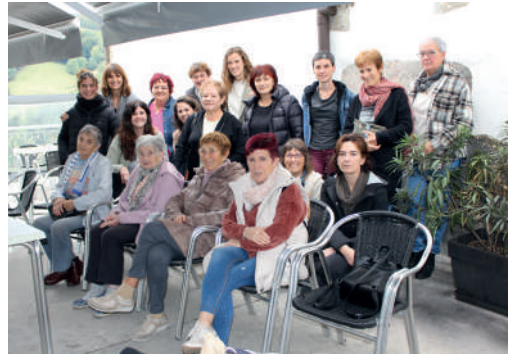
Errezilgo aurkezpenean izan ziren herritarrak.

"HERRITARREKIN EGIN DUGU, EZ GENUELAKO NAHI HERRITARRENGANDIK URRUN GERATZEA"