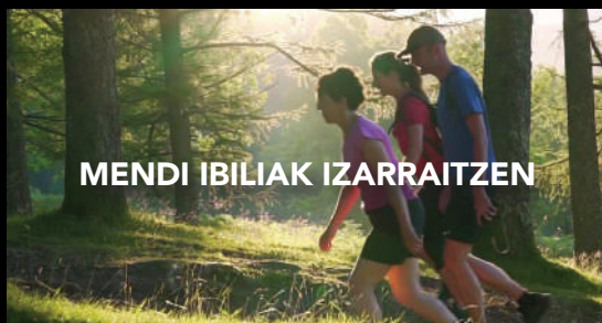
MENDI IBILIAK IZARRAITZEN