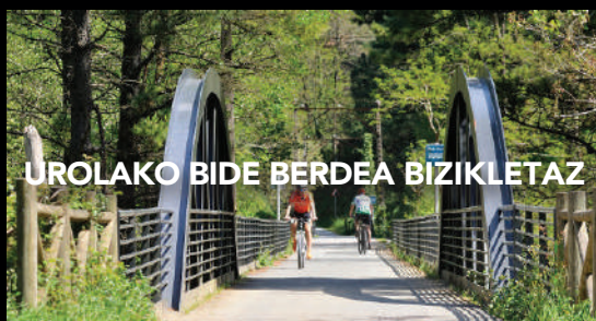
UROLAKO BIDE BERDEA BIZIKLETAZ