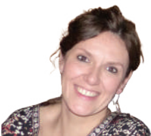
IGONE ARRUTI HEZITZAILEA (BEIZAMA)

Ezagutzen ez ditudan leku guztietara joango nintzateke, baina bat aipatzekotan, AEBak gurutzatuko nituzke kostatik kostara".