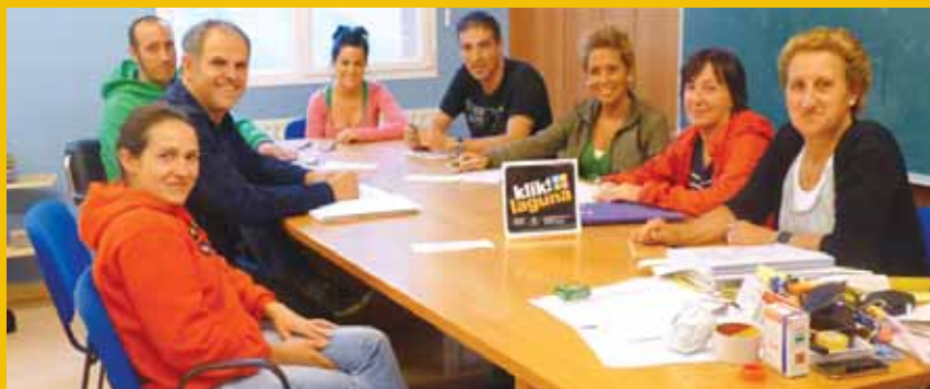
Kilometro egunerako lan-poltsa osatzeaz arduratzen ari den lan-taldea.

Aurtengo kilometroek "elkarlanaren bitartez festa polit bat osatzea" dutela helburu gaineratu dute. "Hala, herriko talde nahiz eragileak eta norbanakoak kilometroetako parte izatera animatu nahi ditugu". Interesatuak izena emateko bide desberdinak dituzte: kilometroetako web orrian, zenbait denda eta elkarteetan izena emanez, kliklaguntzaile@gmail.com helbidean, ikastolara gutuna bidalita edo 688 640 904 deituta. ✖