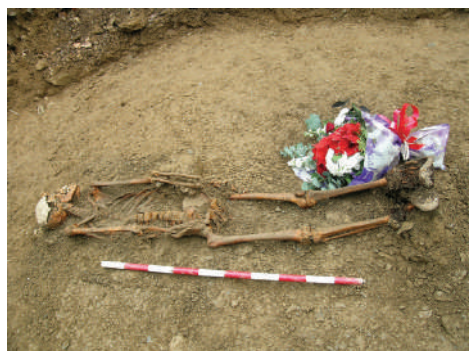
Azkoitian egindako desobiratzea.