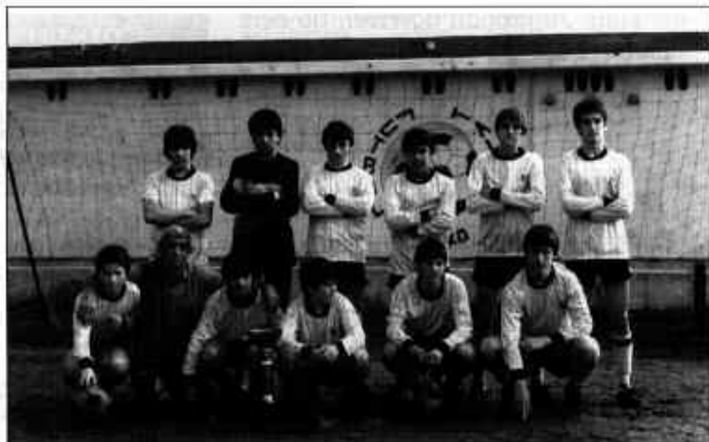
Orioko Futbol Taldeko bere lagunaren artean

I.A.- Egia esan, orokorrean Orioko herria ondo ikusten dut, baina etxebizitzaren falta nabaria da, batipat gazteentzat.