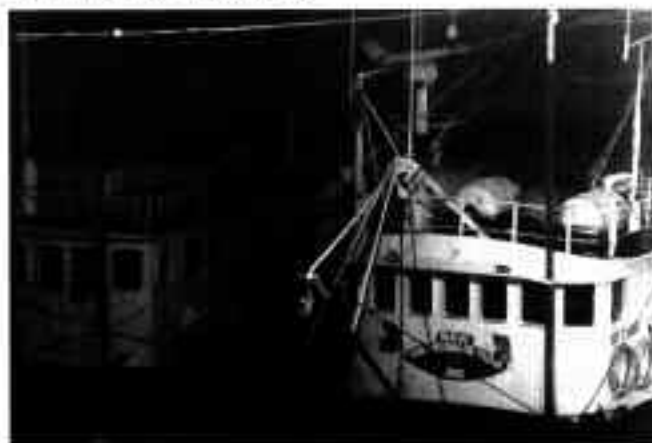
Etorkizun beltza du antxo arrantzak

Antxo-arrantzak jasan duen beherapena ulertzeko zenbait faktoreren eragina aztertu beharrezkoa izango litzateke. Adibidez, gehiegizko arrantza, flota pelagiko frantsesa, itsasoaren kondizio bereziak, kontaminazioa, etab. Baina beste batetarako utziko dugu azterketa hau. □