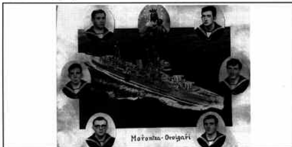
Hauen garaian pentsa ezina zen soldadu ez joatea

Zenbat errezo egin izan det nere denboran elizan, ta pozik nago ikusirikan pakian nola gabiltaan. Ni naizen bezin kobarderikan inor ezin leike izan, semeak gerra ez joateatik mutilzar gelditu nintzan.